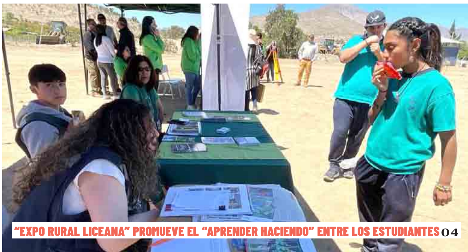
“EXPO RURAL LICEANA” PROMUEVE EL “APRENDER HACIENDO” ENTRE LOS ESTUDIANTES 04