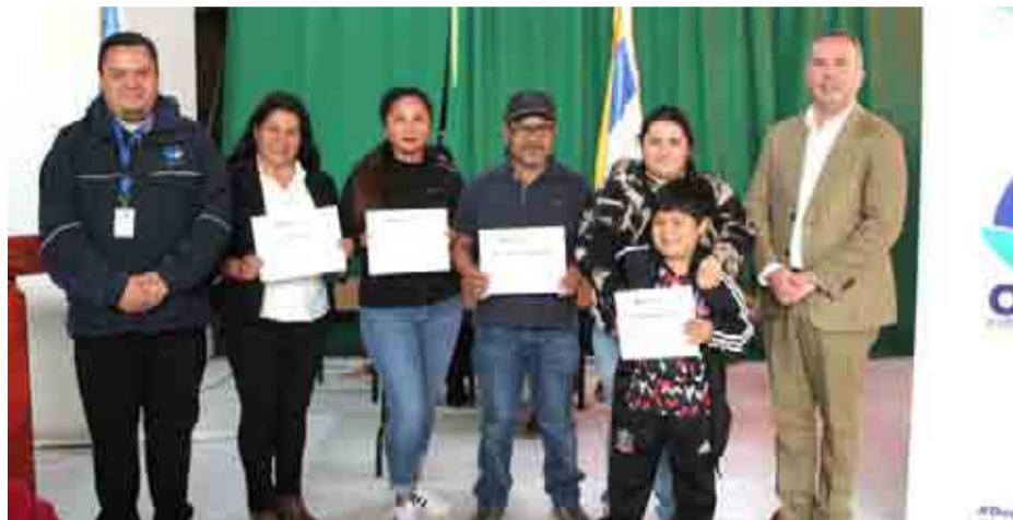
Locatarios reciben los certificados de la capacitación.