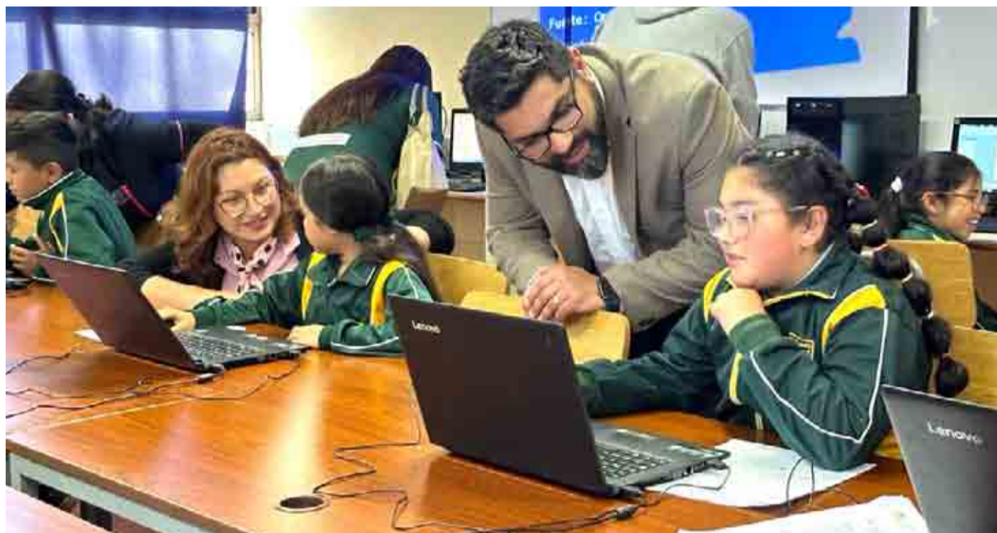
La iniciativa impulsada por el Ejecutivo contempla una inversión de más de 504 millones de pesos.

Hasta el año 2022 eran beneficiados 433 establecimientos educacionales de las Provincias de Elqui y Choapa, con una matrícula de 124.077 estudiantes y con una inversión de $1.017.751.128. Cuando se termine la etapa de implemen-