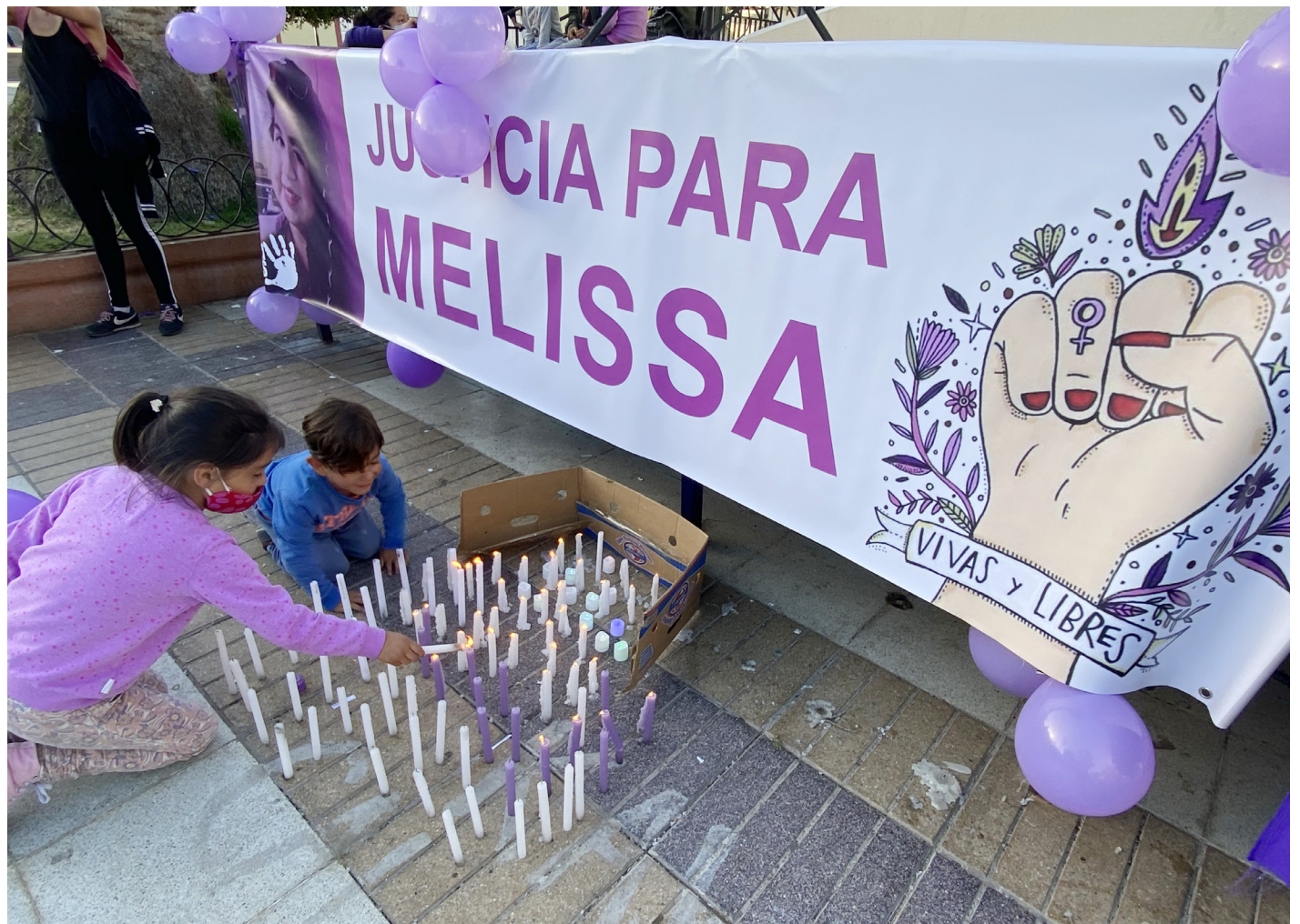
Velación realizada por vecinos que en diversas oportunidades han pedido justicia en el impactante caso.