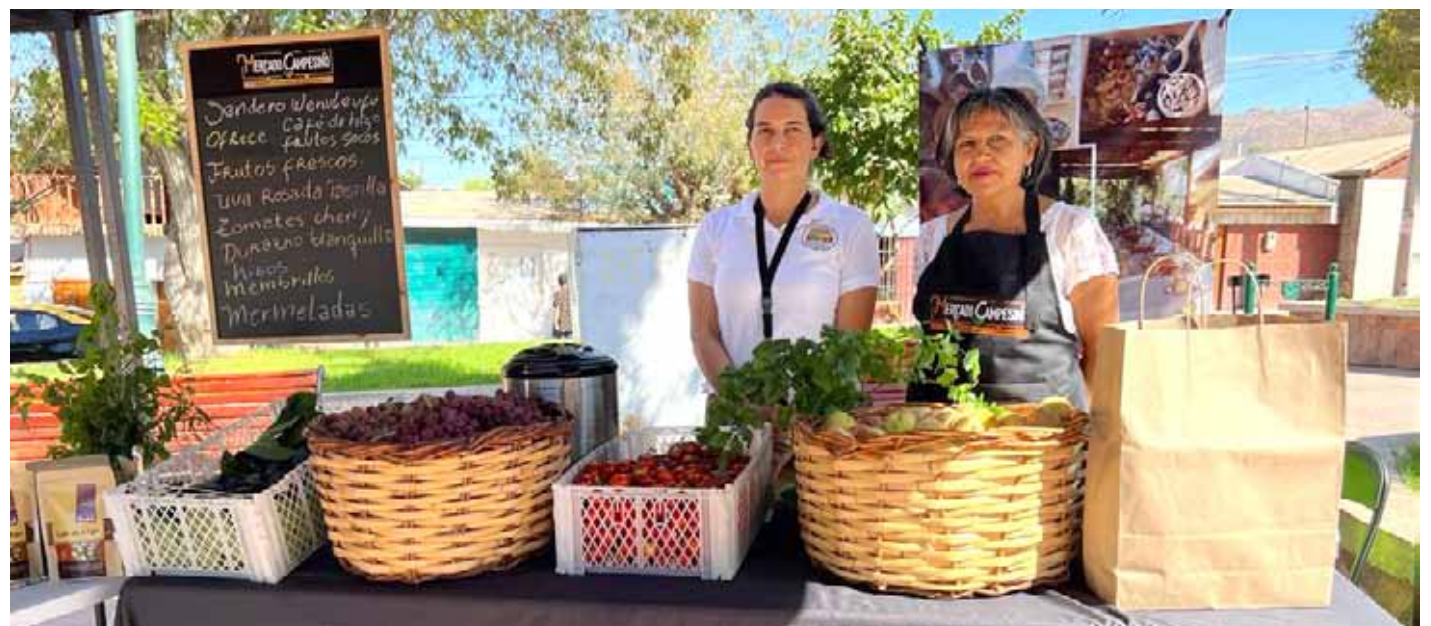
En el Mercado Campesino de Monte Patria es posible encontrar diversos productos.

¿En qué consiste? El Mercado Campesino de Monte Patria aumentó la cantidad de días de funcionamiento, pasando de establecerse solo una vez al mes a, desde julio del 2023, estar todos los viernes, de 10:00 a