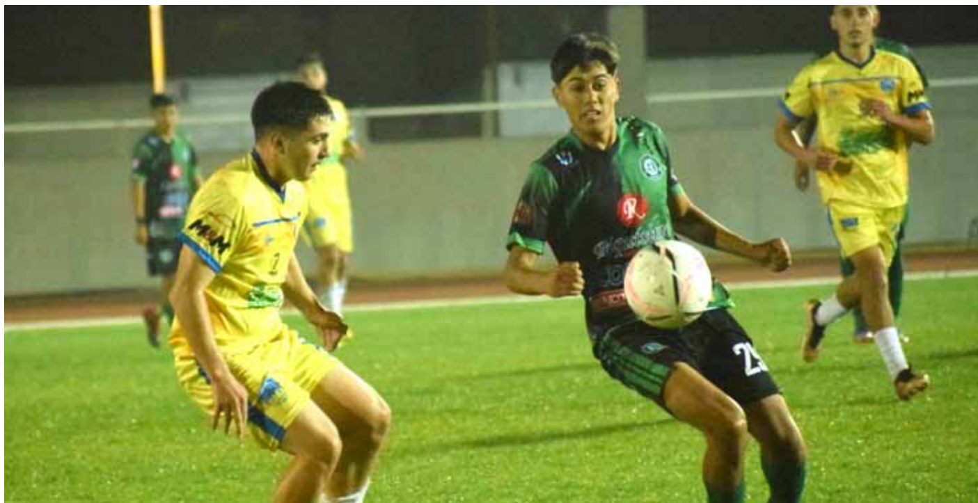
El partido entre CSD Ovalle y Cultural Maipú se vivió en la noche del sábado 15 de julio.