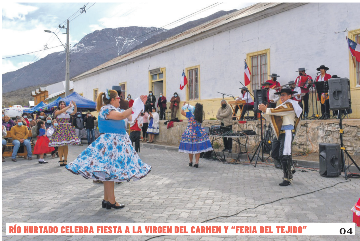
RÍO HURTADO CELEBRA FIESTA A LA VIRGEN DEL CARMEN Y "FERIA DEL TEJIDO"