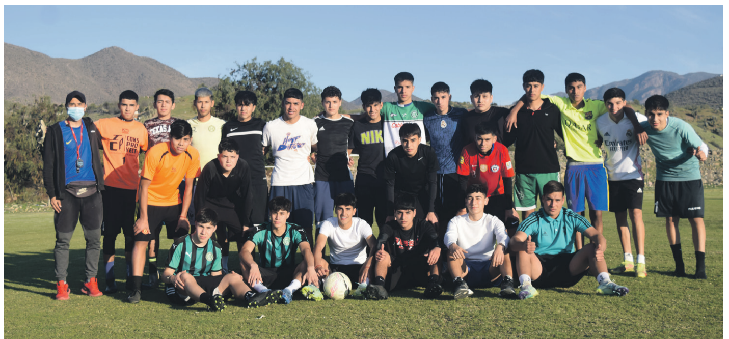
El Club Social y Deportivo Ovalle espera repetir sus buenas actuaciones pasadas en el torneo de Novatos.