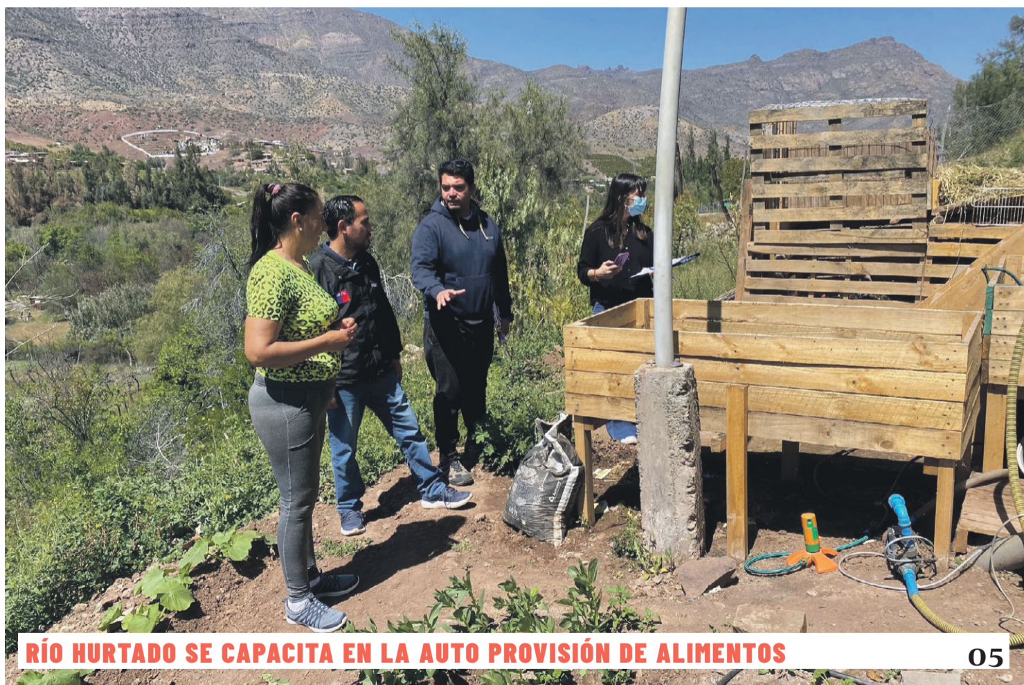
RÍO HURTADO SE CAPACITA EN LA AUTO PROVISIÓN DE ALIMENTOS 05

Denunciados y reconocidos por la víctima, y registrados en video por distintas cámaras, los adolescentes fueron capturados por Carabineros y formalizados por el cargo de Robo por Sorpresa, aunque salieron libres sin medidas cautelares por ser declarada ilegal su detención, debido a varias inconsistencias en el acta policial y en el procedimiento de registro 02