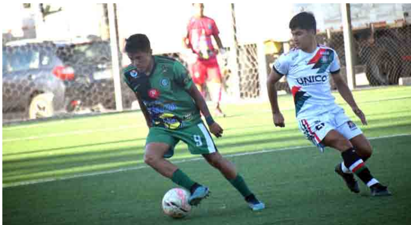
El encuentro entre Ovalle y Lota Schwager fue de fuerzas parejas, pero fueron los sureños quienes se llevaron la victoria.

El "Equipo de la Gente" cayó por 1 a 0 ante Lota Schwager, con un gol anotado en los primeros minutos del partido. Los verdes ahora deberán enfrentar como visitante a Imperial Unido, con la misión de sumar para mantenerse en la lucha por el ascenso.