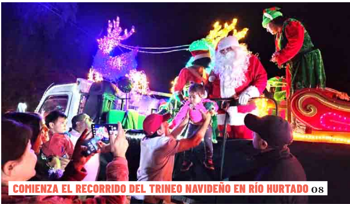
COMIENZA EL RECORRIDO DEL TRINEO NAVIDEÑO EN RÍO HURTADO 08

El ministro de Agricultura, Esteban Valenzuela, destacó que la tramitación de dicha resolución ya está en marcha, lo que permitirá mayores medidas para enfrentar la sequía. Por otro lado, aseguró que se trabaja en acortar los plazos para la instalación de una planta desaladora en el territorio. 02