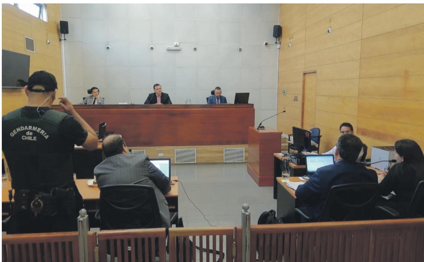
El juicio se inició este lunes a las 8:40 de la mañana en Ovalle.

Como parte de los argumentos, el abogado defensor agrega, "en el curso del juicio nuestro defendido declaró, ha reconocido su participación como siempre ha sido su actitud desde el principio de la investigación. Debo destacar que apenas ocurre el