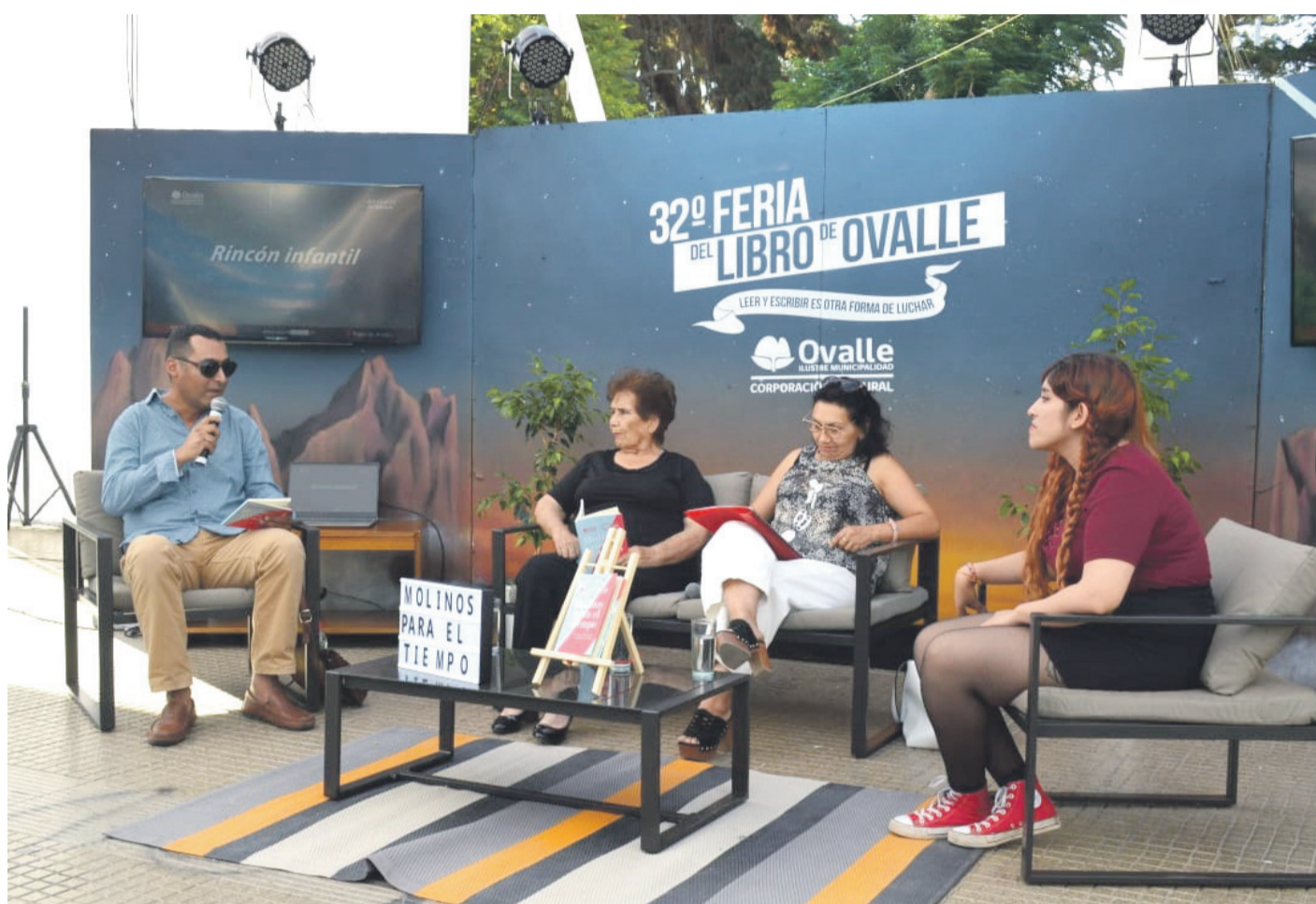
Durante la tarde de este lunes se presentó la primera antología poética que nace de un Laboratorio Cultural en Ovalle