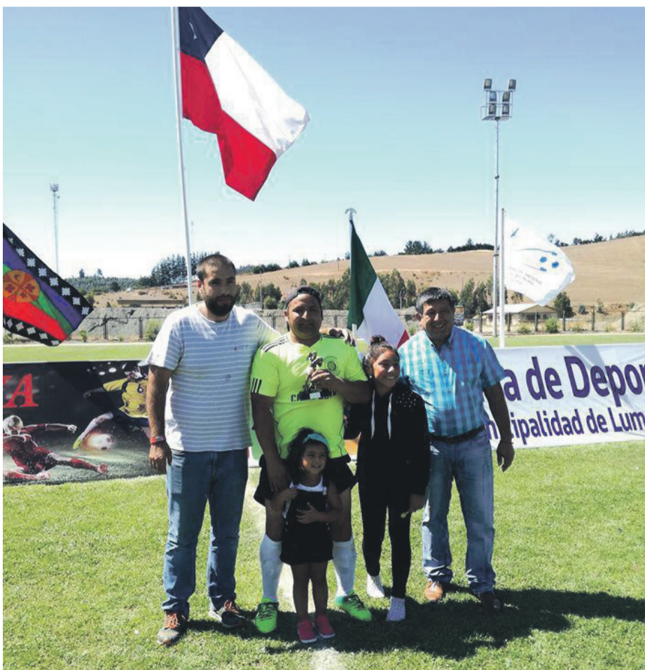
La localidad de Unión Campesina recibió a los jugadores con una gran celebración