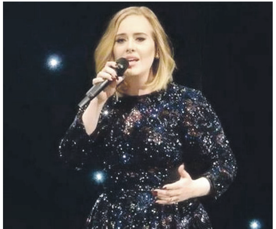
Adele ofreció ya una pista sobre la posible salida al mercado del disco el pasado mayo, cuando reveló que “30” será una grabación ‘drum n bass’.