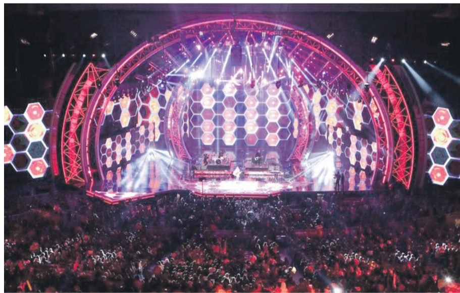
Aseguró el productor, quien estima que los primeros shows de cada jornada comiencen alrededor de las 21:45 horas. El año pasado, la transmisión televisiva se inició a las 21:30 horas

Este año, además, se reforzarán las cámaras del recinto y aumentará el número de guardias de seguridad. “Si te dijera que tenemos medidas de seguridad distintas para el día domingo, que para el día que actúa Mon (Laferte, lunes), sería mentir. Es todos los días lo mismo para nosotros”, confirmó Merino.