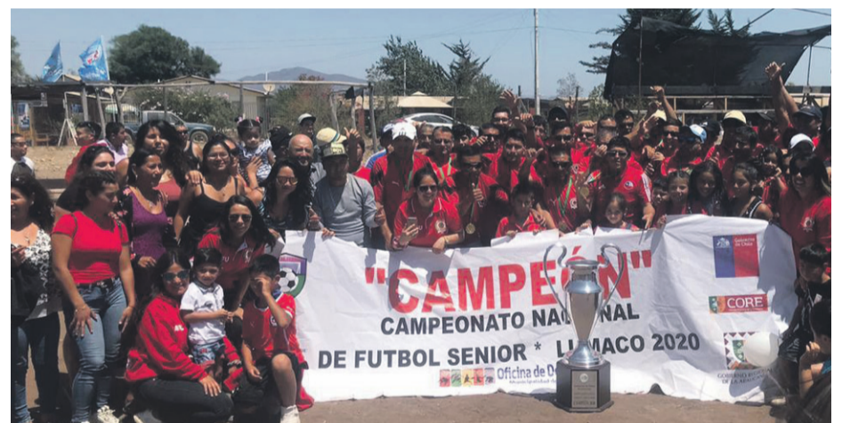
Es primera vez que Club Deportivo Unión Campesina obtiene este título nacional