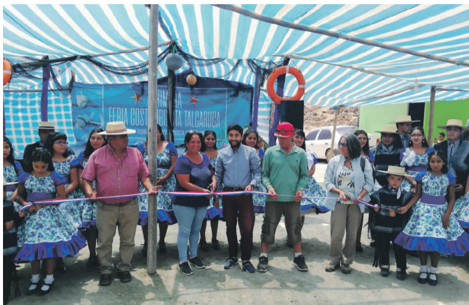
La primera feria costumbrista de Caleta Talcaruca rescató lo mejor de la gastronomía local

Los diferentes shows en vivo fueron parte de la programación de la fiesta que igualmente tuvo juegos infantiles y un gran baile final, los que amenizaron la actividad, donde además de rica comida, los visitantes y la propia comunidad pu-