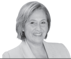
ADRIANA MUÑOZ D'ALBORA SENADORA