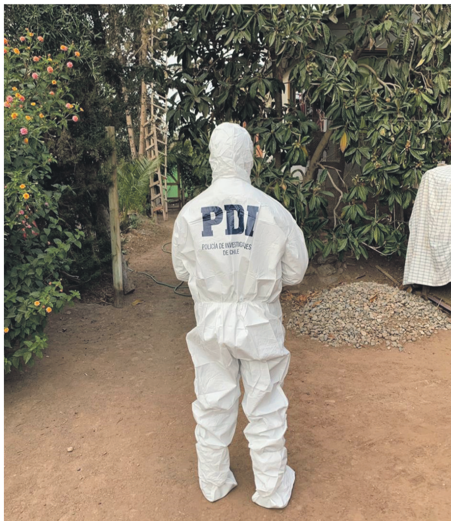
Los hechos ocurrieron el 11 de agosto del 2019 en Lagunillas.