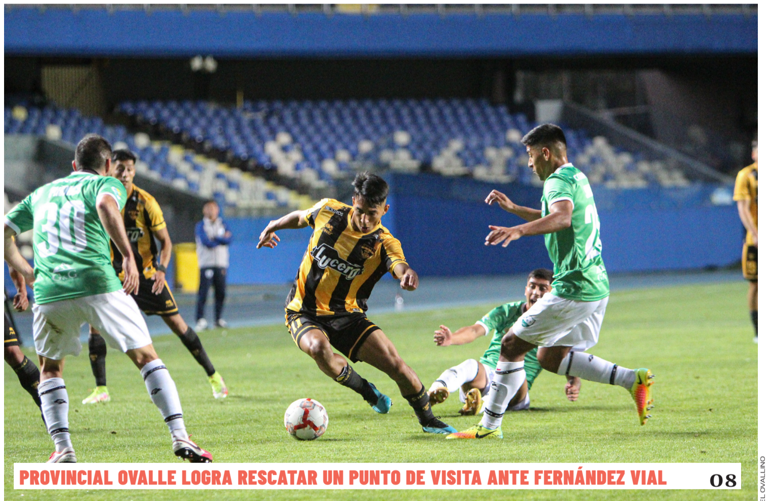
PROVINCIAL OVALLE LOGRA RESCATAR UN PUNTO DE VISITA ANTE FERNÁNDEZ VIAL