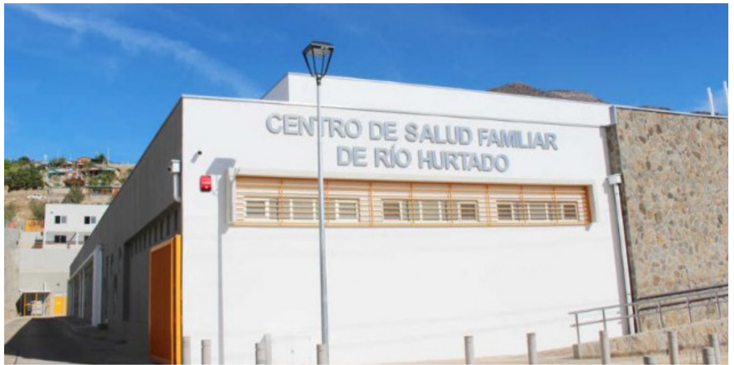
En la salud primaria de los municipios rurales apuntan a la necesidad de mayores recursos para sus funciones.

"Este es un trabajo que venimos desarrollando desde el año pasado en la comisión, la idea es iniciar un trabajo con los legisladores de la región, tanto diputados como senadores, de todo el amplio espectro político, para poder lograr modificar la ley y aumentar el valor per cápita de la salud rural en un 50%. El ministerio hoy nos mide con la misma vara a todos los municipios del país, pero el municipio de Santiago, Providencia o Las Condes, es muy distinto al de Río Hurtado, Monte Patria o Combarbalá,