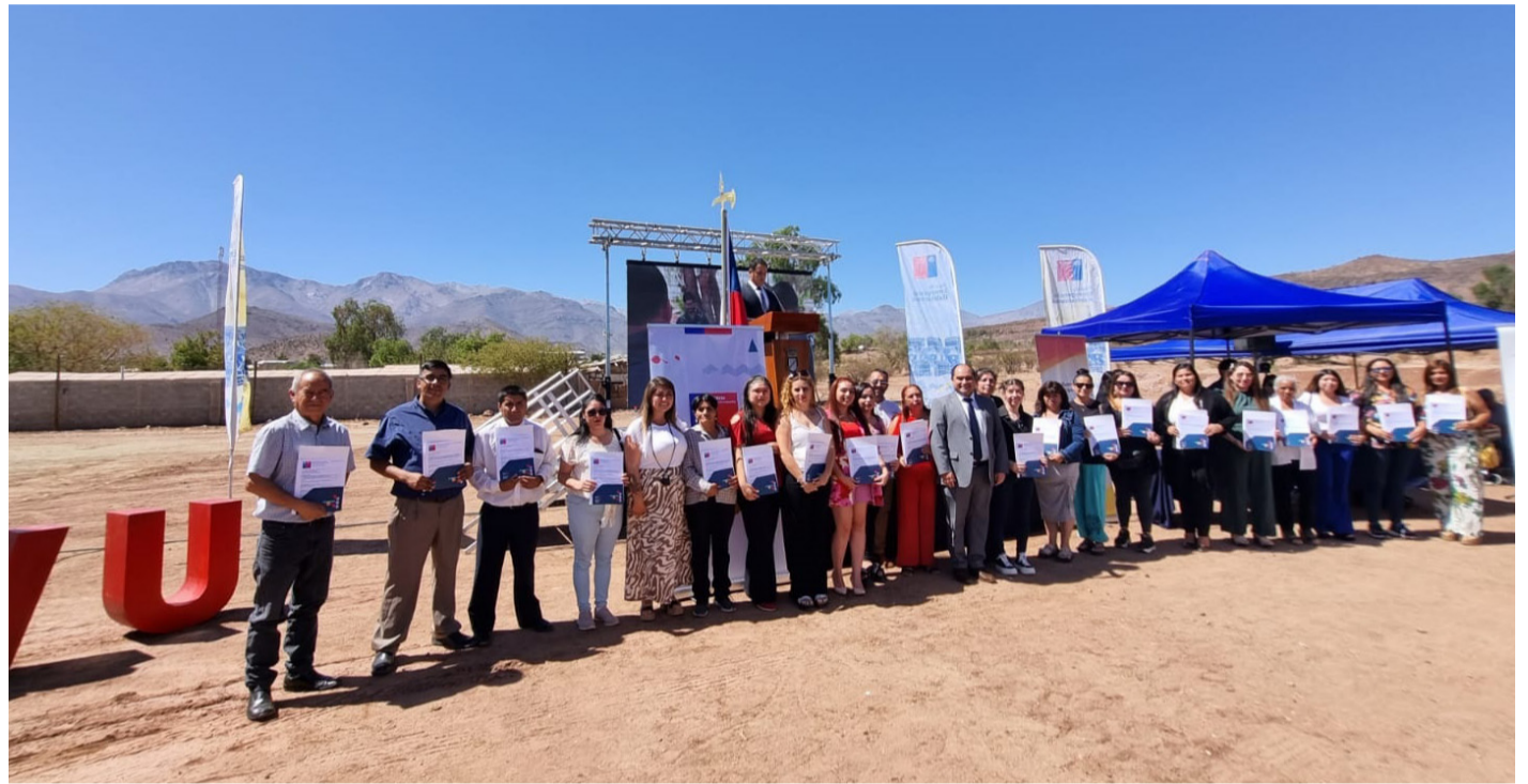
En la ceremonia de primera piedra y entrega de subsidios participaron autoridades y vecinos beneficiados.