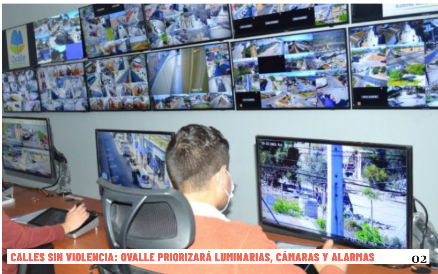
CALLES SIN VIOLENCIA: OVALLE PRIORIZARÁ LUMINARIAS, CÁMARAS Y ALARMAS