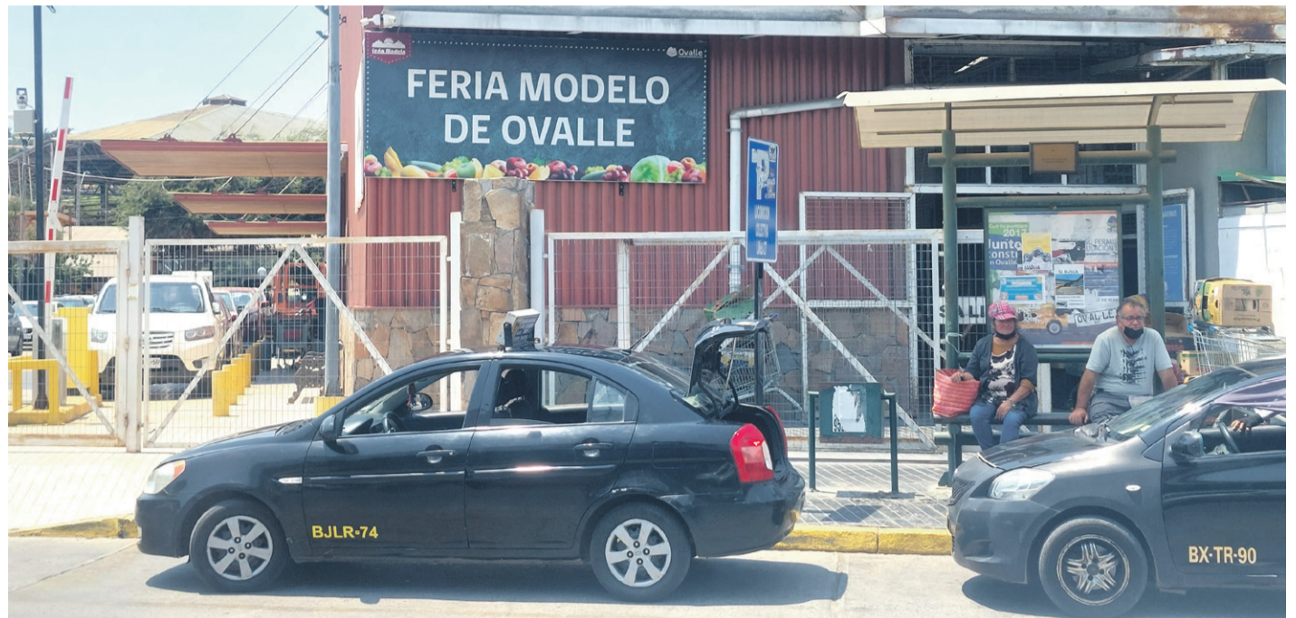
Uno de los problemas que aqueja a la Feria Modelo son los escasos colectivos que llegan hasta el lugar.