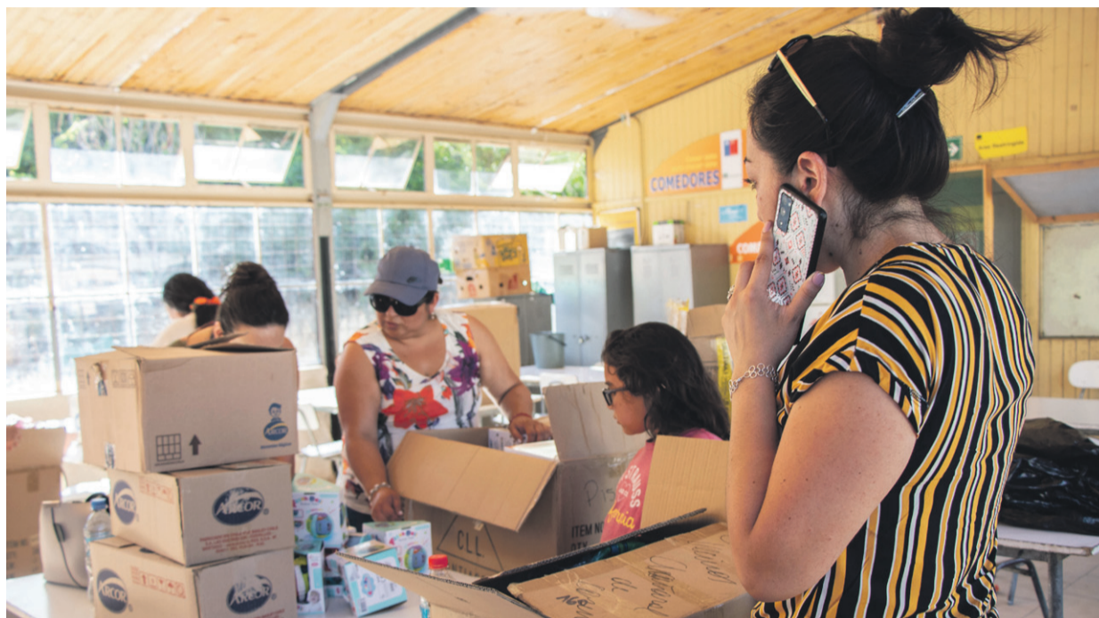
Organizaciones sociales de Monte Patria recibieron los más de seis mil juguetes que se repartirán en Navidad.