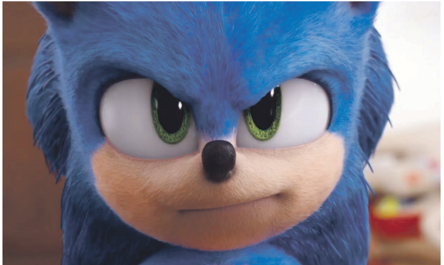
SONIC, THE HEDGEHOG

De título completo "Birds of Prey: And the Fantabulous Emancipation of One Harley Quinn", la historia sigue los pasos de Harley Quinn (Robbie), ya alejada del Joker y ahora