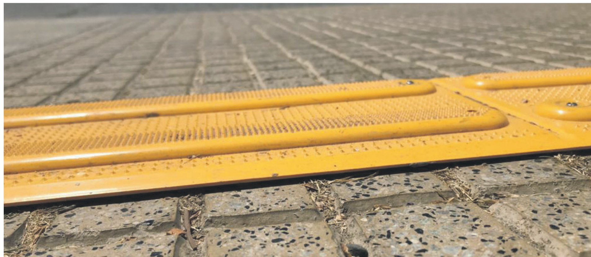
Bandas podo tácticas están sobrepuestas en la vereda en el perímetro de la Plaza de Armas.. CEDIDA

En cuanto a gestiones logísticas, desde el Serviu expresaron que, "se ha mantenido una comunicación constante a través de reuniones y visitas en terreno con el Municipio y la Comunidad, con la finalidad de mantener a los vecinos informados sobre las obras a ejecutar y sus correspondientes plazos. Realizando las coordinaciones necesarias para llevar adelante correctamente el programa de trabajo". 020011