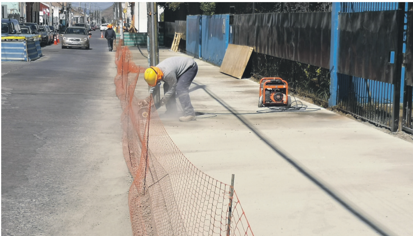
Las "Rutas Inclusivas" se instalarán en las principales calles de Ovalle.

podo táctil las vías peatonales, con un diseño amigable para las personas que tienen discapacidad visual.