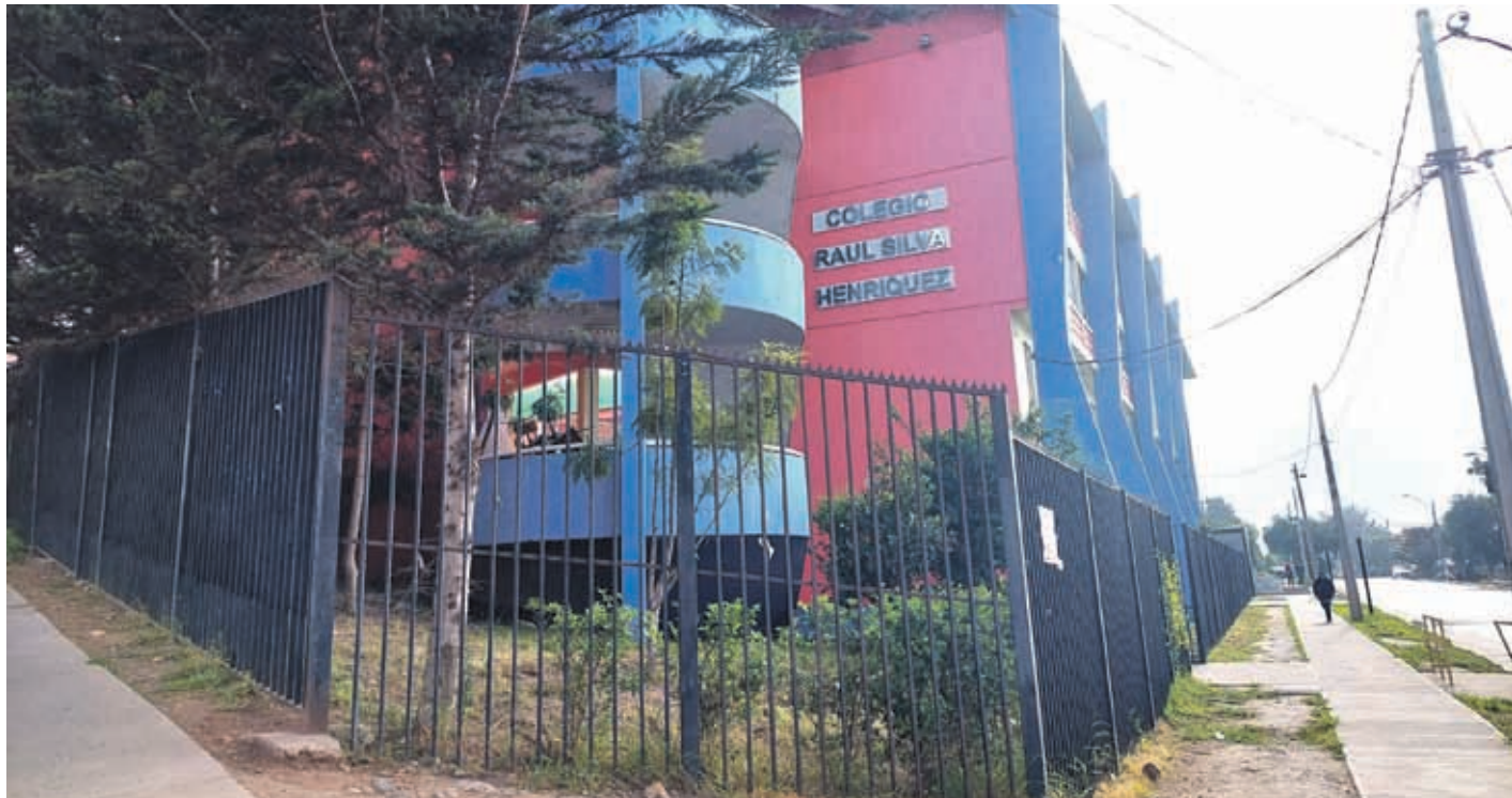
El Colegio Raúl Silva Henríquez retorna a clases este martes 18 de octubre.

Ya este lunes los estudiantes habían manifestado su molestia e incomodidad al sentirse “discriminados”, ya que no se les permitió ayudar en el