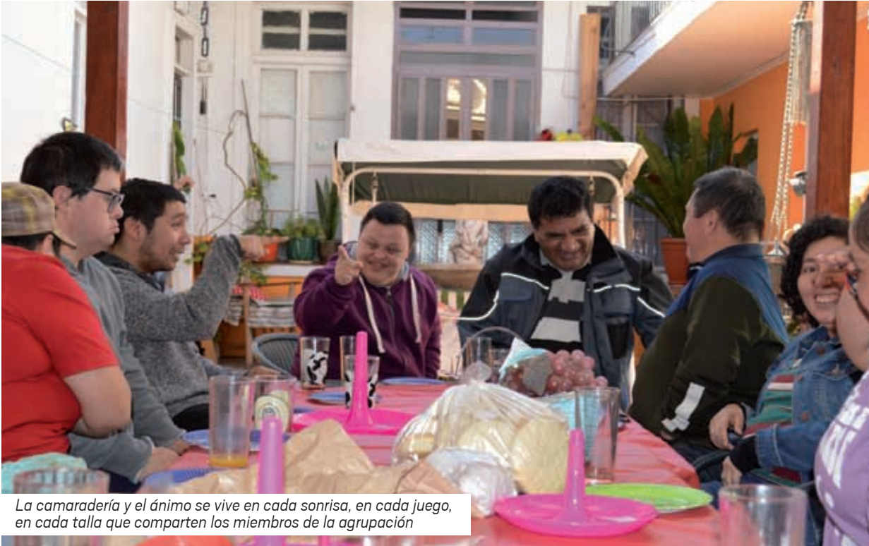
La camaradería y el ánimo se vive en cada sonrisa, en cada juego, en cada talla que comparten los miembros de la agrupación