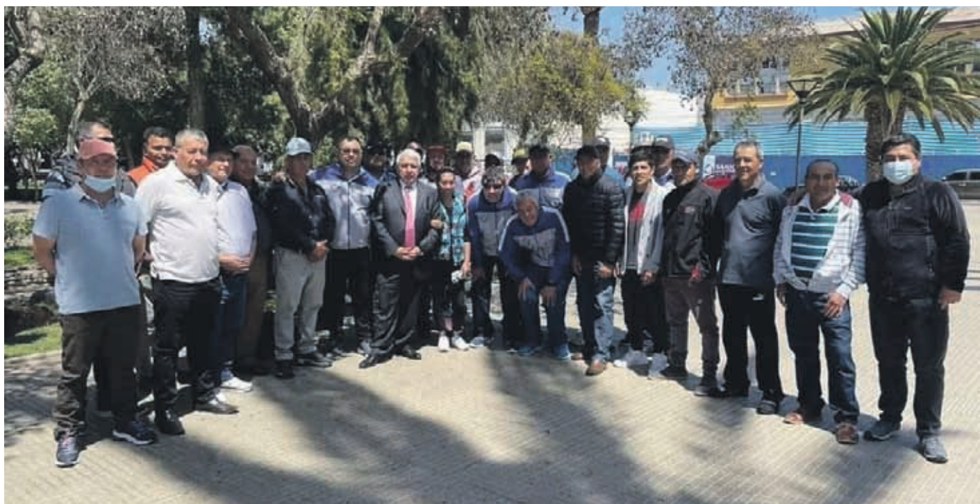
Un total de 30 deportistas de la Asociación de Rayuela de Ovalle viajó hasta Curicó.

"Los que estaban debutando estuvieron excelentes, muchos me hacían comentarios de los nervios previos al debut, pero dentro de las partidas se fueron soltando y jugando mejor, alcanzando un nivel muy óptimo. Estoy muy contento con la gente nueva que por primera vez iba a un nacional, y