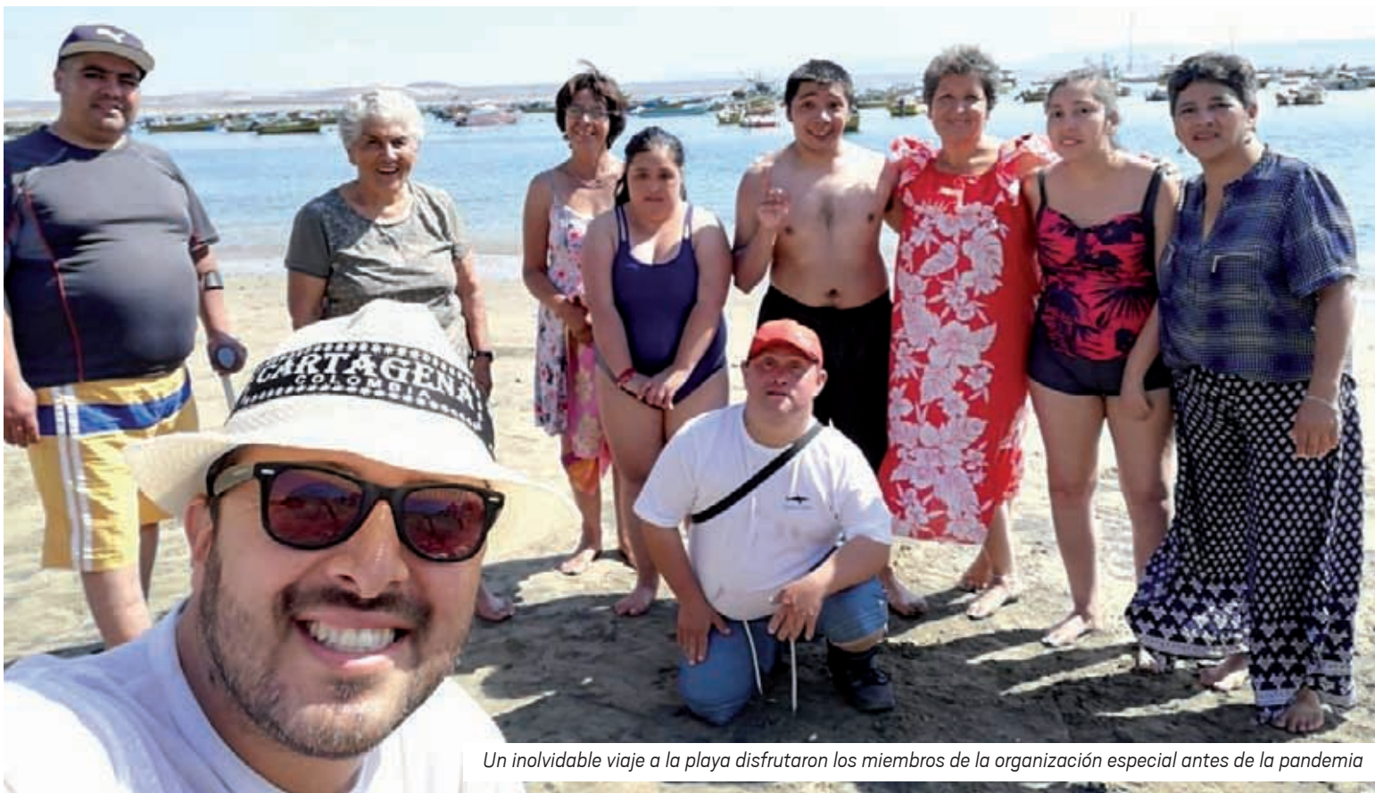
Un inolvidable viaje a la playa disfrutaron los miembros de la organización especial antes de la pandemia