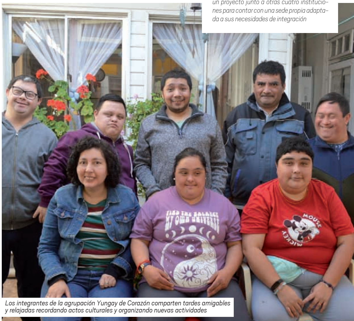
Los integrantes de la agrupación Yungay de Corazón comparten tardes amigables y relajadas recordando actos culturales y organizando nuevas actividades

Si bien administrativamente le faltan apenas unos pasos para su registro formal, las familias que hacen vida en la organización ya tienen experiencia en educación e integración social de los niños con Trastorno del Espectro Autista. Actualmente elaboran un proyecto junto a otras cuatro instituciones para contar con una sede propia adaptada a sus necesidades de integración