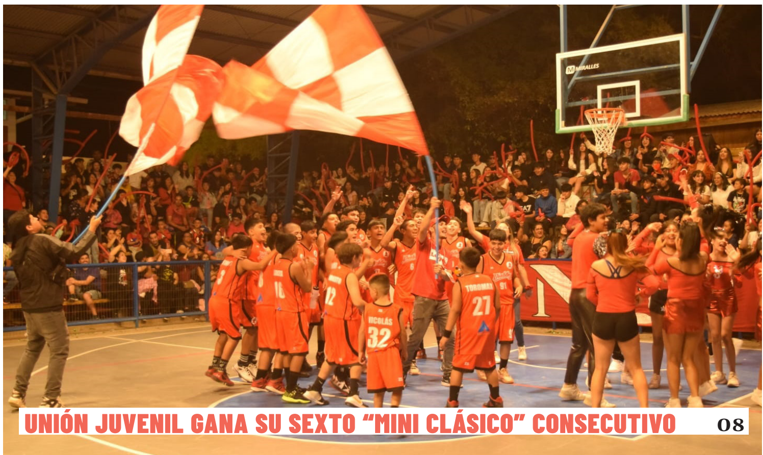
UNIÓN JUVENIL GANA SU SEXTO "MINI CLÁSICO" CONSECUTIVO 08