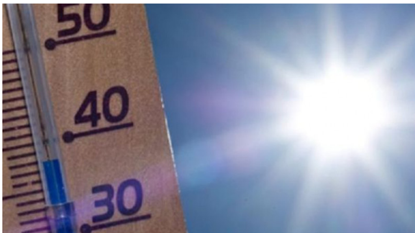
Enero fue uno de los meses más calurosos del último tiempo en la Región de Coquimbo, e incluso a nivel global.