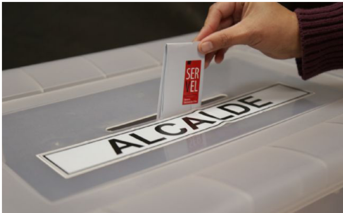
El 10 de abril vence el plazo para que formalicen candidaturas aquellos partidos o alianzas que decidan organizar primarias.

La líder señala que lo más probable es que no presenten candidatos en todas las comunas, pero ya tienen algunas precandidatura "las que nos