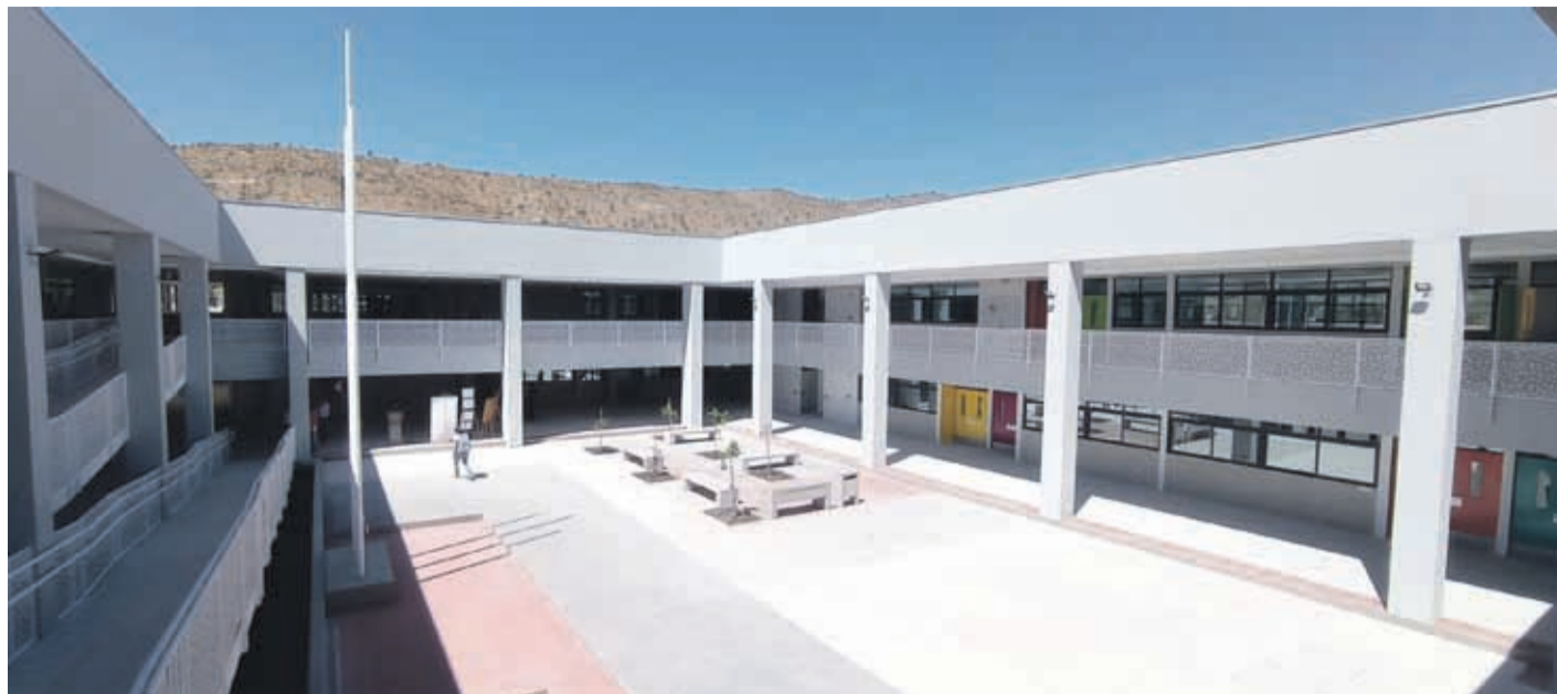
El Liceo Alberto Gallardo Lorca de Punitaqui cuenta con una nueva y moderna infraestructura, pero todavía no comienzan las clases.

“El 24 de febrero se hizo entrega a explotación del recinto, situación que no debió ser en esa fecha, ya que la entrega oficial debió ser en el año anterior, esto provocó que tuviésemos plazos acotados para presentar el traslado del local, que está vinculado al reconocimiento oficial del edificio, que en el fondo es la autorización del ministerio para que podamos funcionar en ese establecimiento. Ya tenemos nuestro recinto, y está equipado, pero la Seremía nos tiene que autorizar usarlo, y como además hubo cambio de autoridades