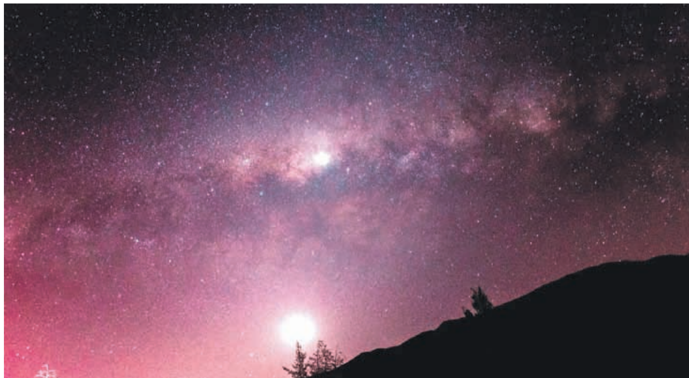
Río Hurtado ha destacado como un potencial destino de astroturismo.