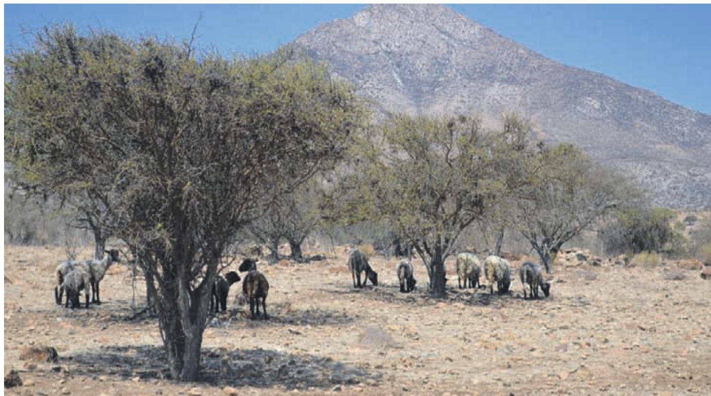
Las comunas de la Provincia del Limarí han sido una de las más afectadas por la sequía.