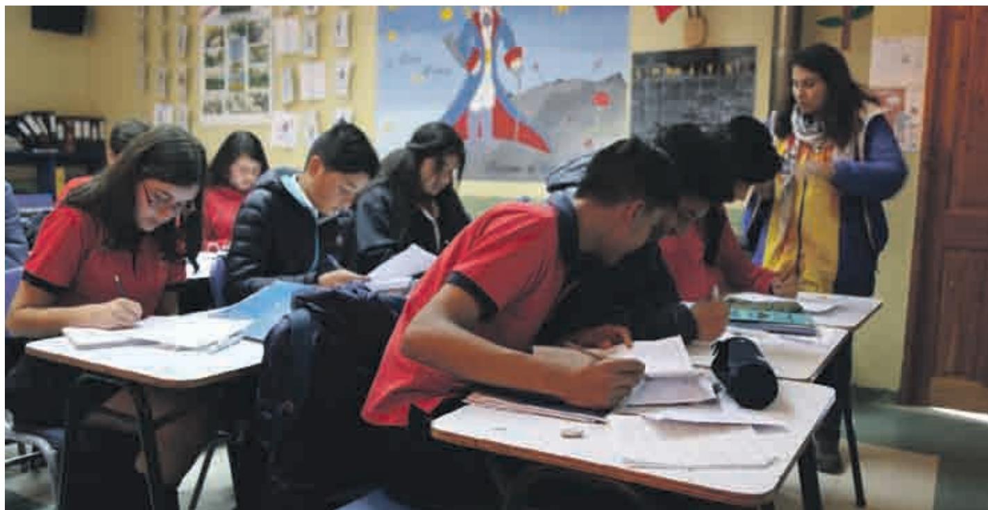
Los establecimientos pueden postular e integrarse gratuitamente completando el formulario en el sitio de la Red de Escuelas Líderes.

Red de Escuelas Líderes es una iniciativa que lleva 15 años integrando a establecimientos educacionales de Chile en contexto de vulnerabilidad para trabajar en la mejora educativa. La iniciativa tiene como foco integrar a escuelas y liceos para que compartan sus prácticas, conocimientos