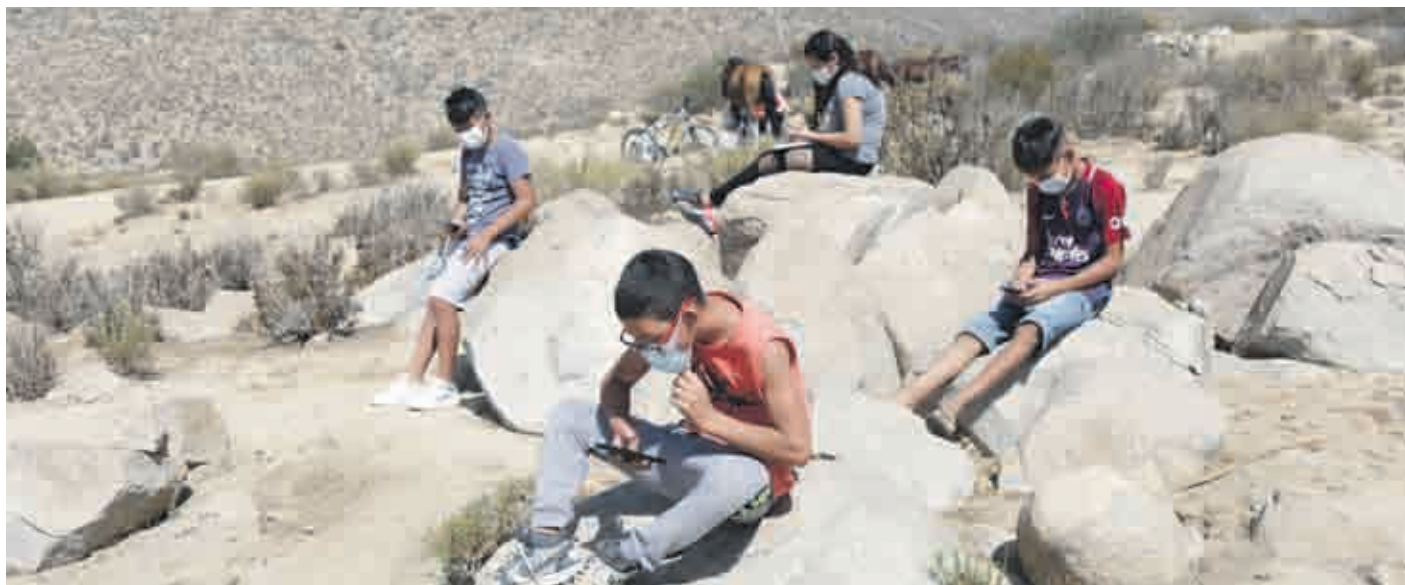
Los habitantes de algunas zonas rurales de la región deben subir un cerro para encontrar señal para conectarse.

Los datos revelados por la SUBTEL muestran una gran brecha entre los territorios rurales y urbanos. En la conurbación La Serena Coquimbo el internet llega al 80% de los hogares, en tanto en comunas Río Hurtado y Paihuano, el registro se ubica en 1,1