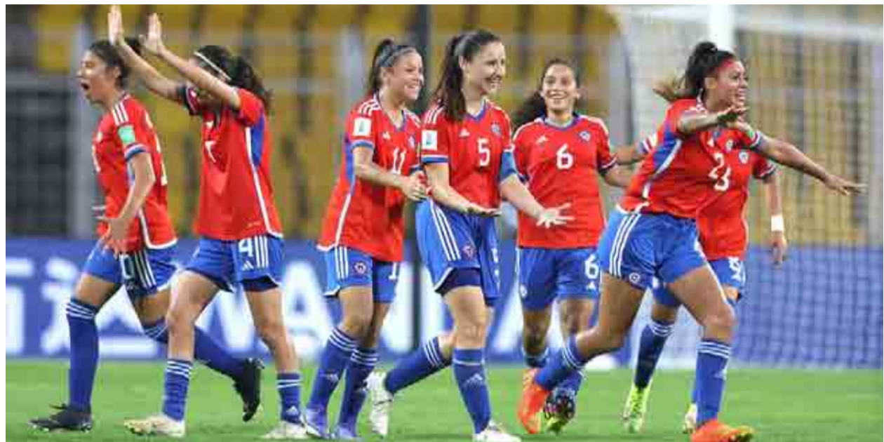
Los seleccionados chilenos de fútbol en Santiago 2023 ya conocen a sus rivales.

En la ceremonia de sorteo realizada ayer participó la seleccionada na-