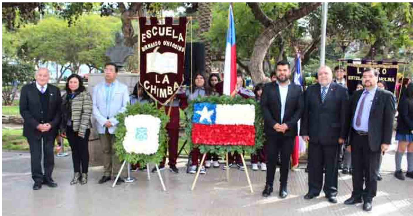
Una ofrenda floral en homenaje al general Bernardo O'Higgins dejaron las autoridades ovallinas y de la provincia.