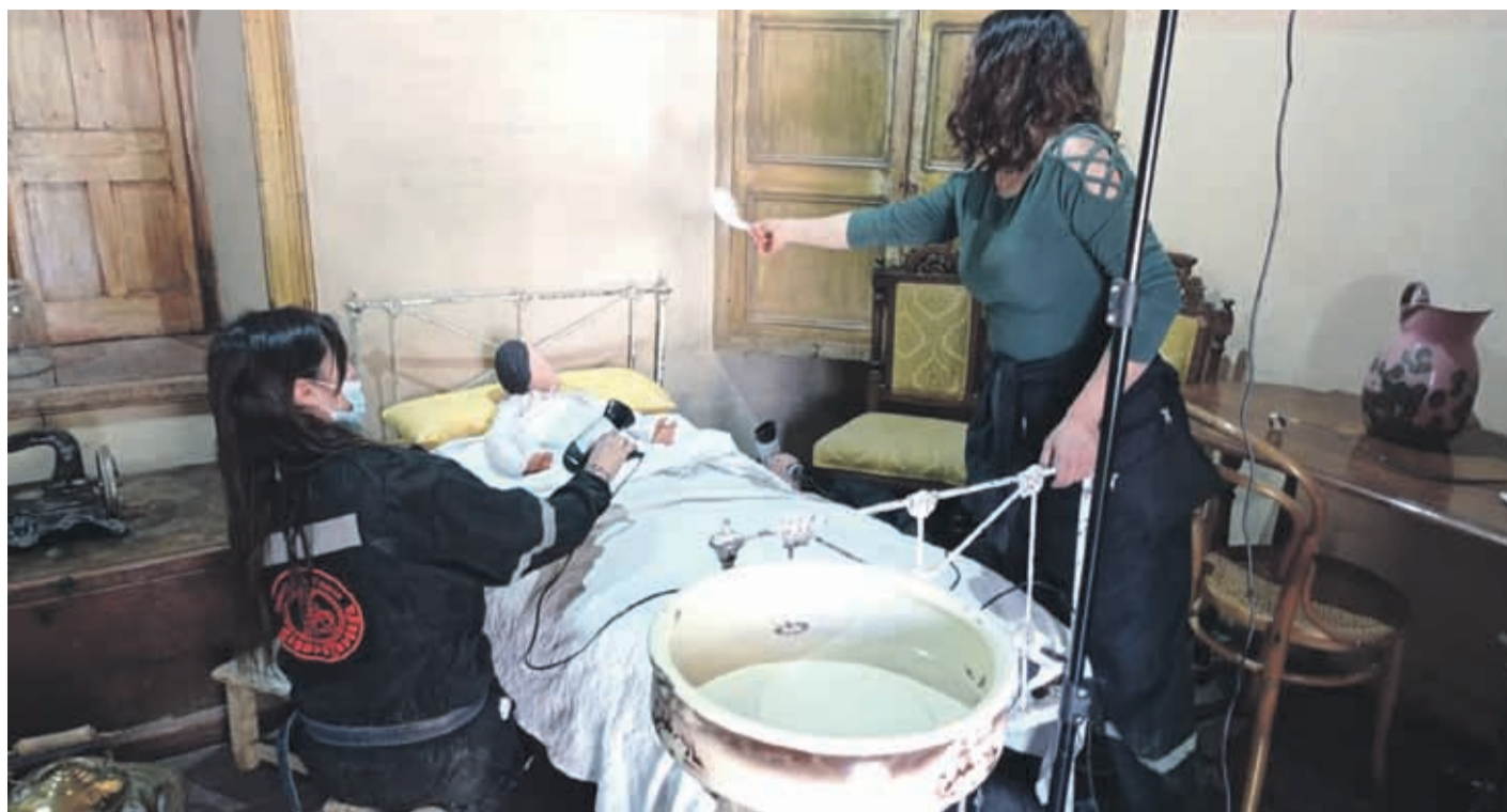
Artistas locales se unieron para dar vida a la propuesta que narra con títeres varios episodios en la vida de Gabriela Mistral.

"Nuestra expectativa es poder seguir trabajando en esta área, y una de las propuestas es continuar narrando la vida de Gabriela Mistral, porque lo que hicimos esta vez fue hacer