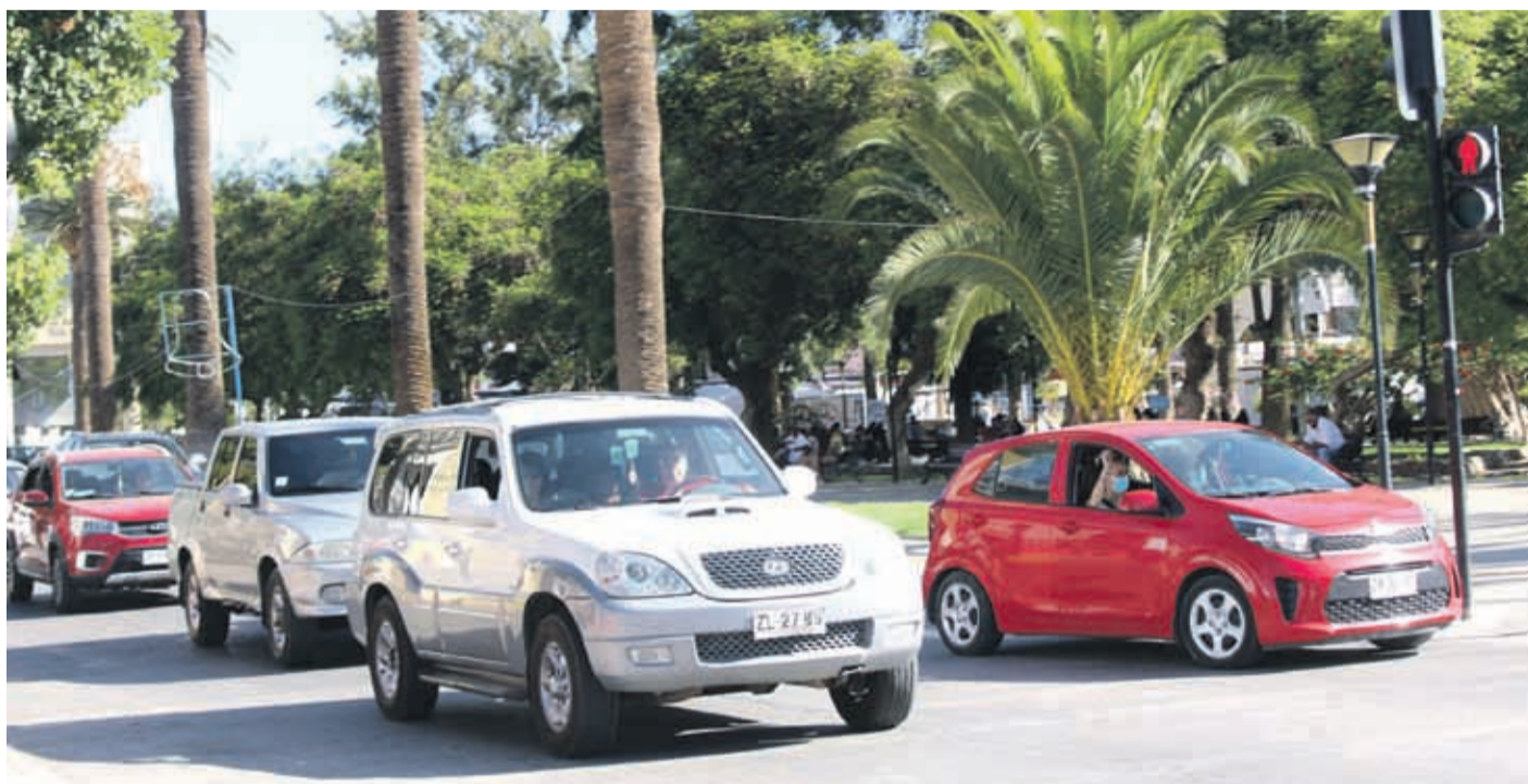
Las principales calles de Ovalle sufren de congestión vehicular en algunas horas del día.