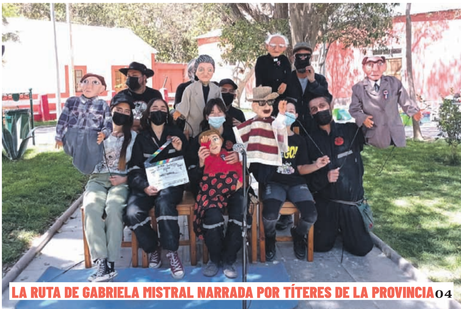
LA RUTA DE GABRIELA MISTRAL NARRADA POR TÍTERES DE LA PROVINCIA 04

En seis distintos procedimientos se logró la incautación de más de seis mil plantas de marihuana y droga procesada. Los operativos registran un factor común: todos se originaron desde una denuncia ciudadana. Autoridades destacan la importancia del apoyo de la comunidad. 03