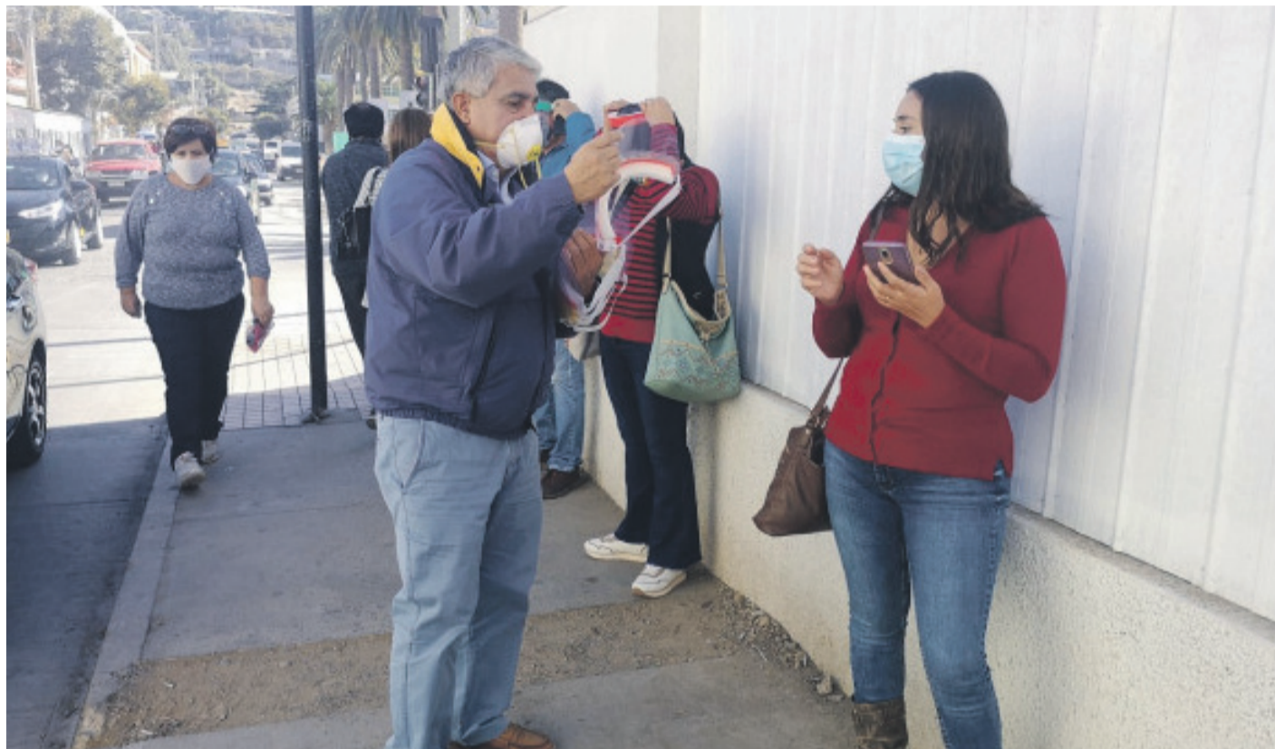
Los alcaldes solicitan medidas en materia de seguridad, empleo, educación, salud y ámbito municipal.

Junto con ello, las medidas sanitarias son un punto esencial para