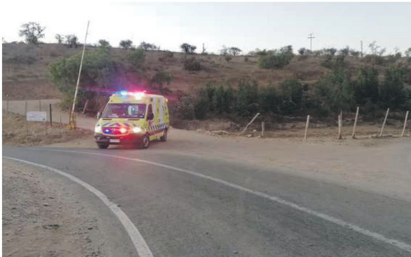
El herido fue en la tarde de este domingo.