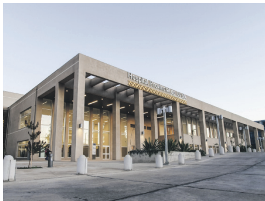
En el hospital se mantiene el herido, sin riesgo vital.