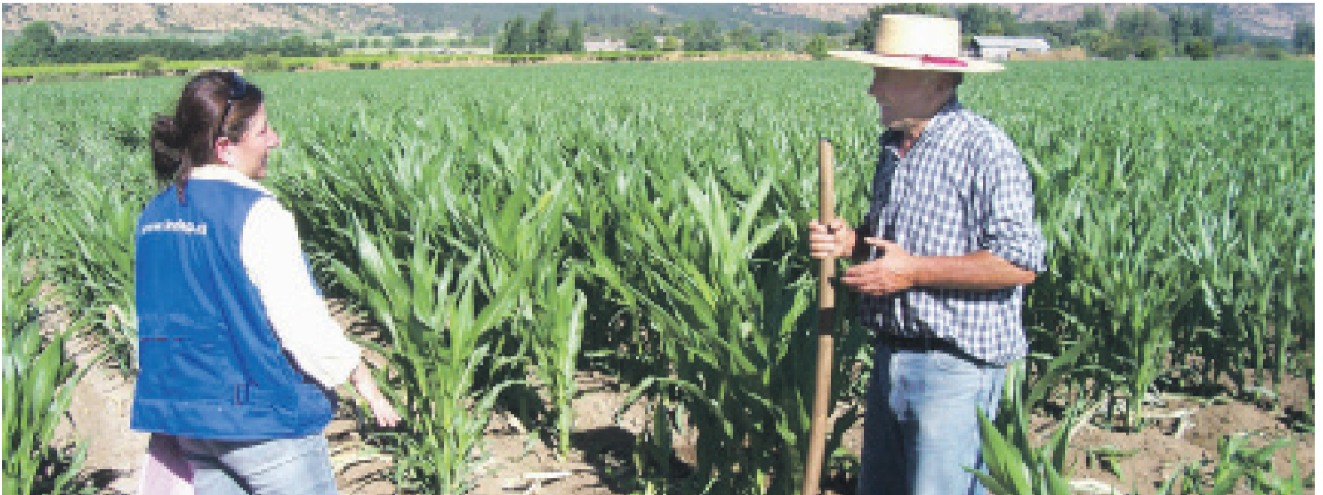
El temor a contagiarse en el ámbito laboral se incrementó tras conocerse la muerte de un funcionario en la región del Maule