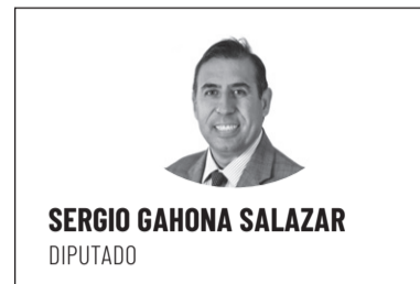
SERGIO GAHONA SALAZAR DIPUTADO

Quienes viven en la Provincia del Limari y especialmente en la Comuna de Ovalle, deben sentirse particularmente orgullosos de estar enfrentando los desafíos que significa la pandemia del coronavirus, con el apoyo que ha entregado el Gobierno del Presidente Piñera, a través del Gobierno Regional, que se ha reflejado en importantes medidas puestas en marcha en las últimas semanas y que han significado un cambio significativo en el ámbito de la salud pública.