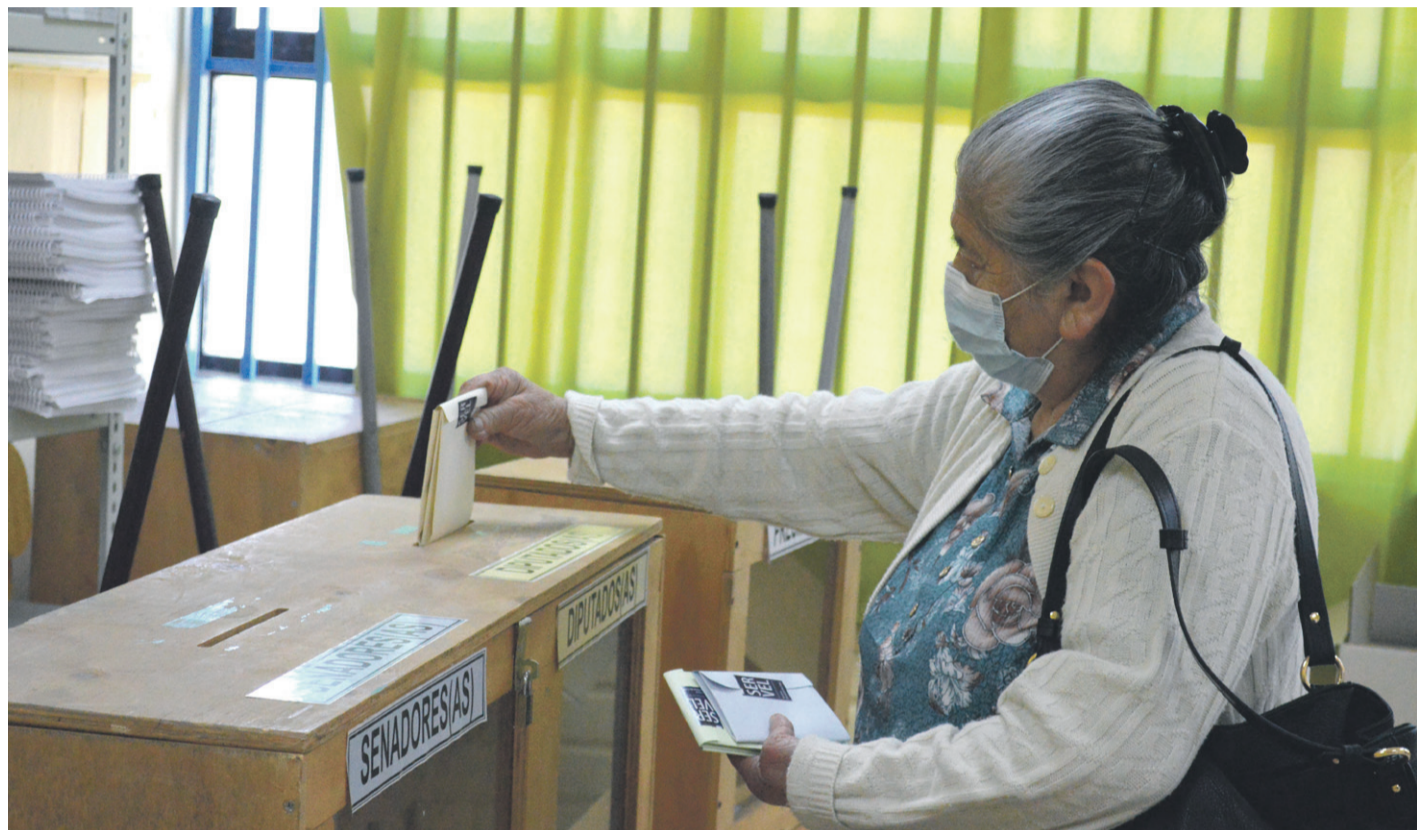
Casi 150 mil electores están habilitados para sufragar el próximo 4 de septiembre en el plebiscito de salida