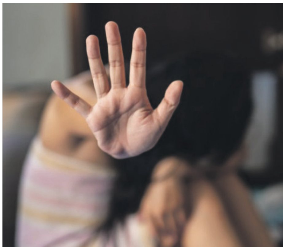
Altas cifras en denuncias de VIF se ha registrado en la comuna de Río Hurtado, por lo que han fortalecido la labor de la Oficina de la Mujer

Además del incremento en los casos de VIF, entre las razones para la conformación de esta instancia, se quiere potenciar las habilidades y el empoderamiento económico de las mujeres de la comuna.