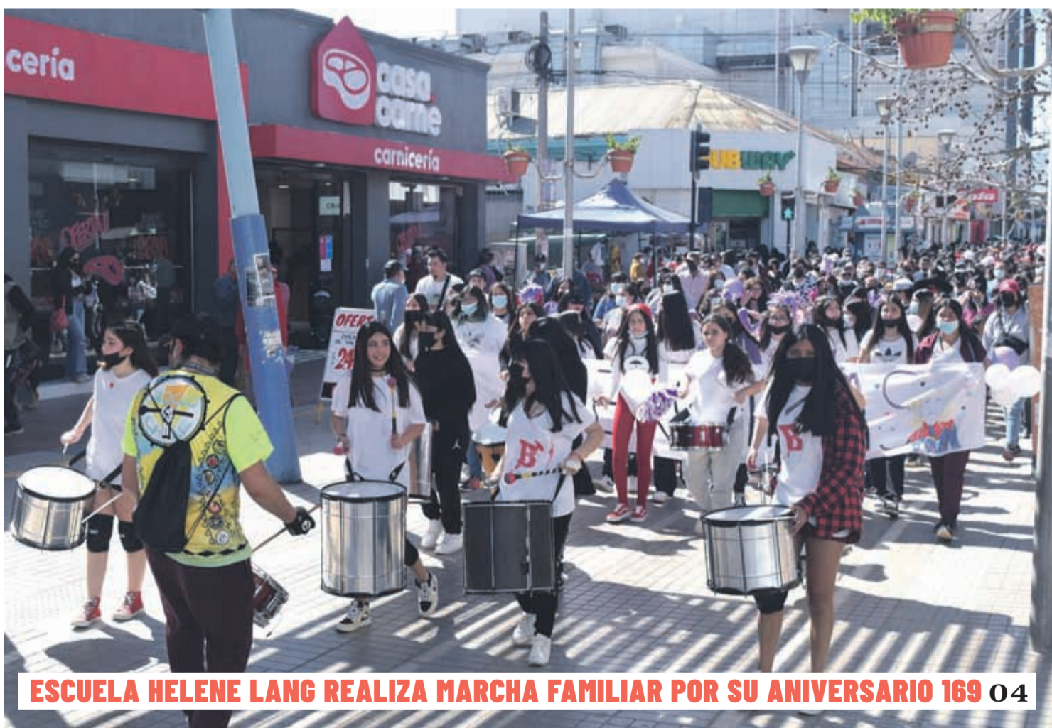
ESCUELA HELENE LANG REALIZA MARCHA FAMILIAR POR SU ANIVERSARIO 169 04

TAEKWONDO DE COMBARBALÁ VIAJA A COSTA RICA 16