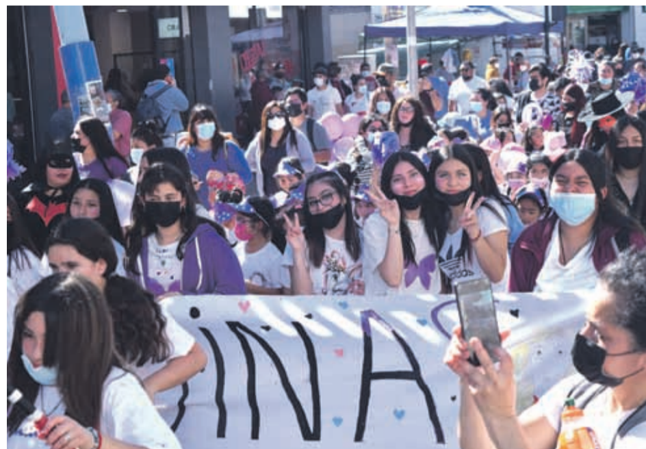
Las alumnas de la Escuela Helene Lang disfrutaron de esta tarde entre amigas.