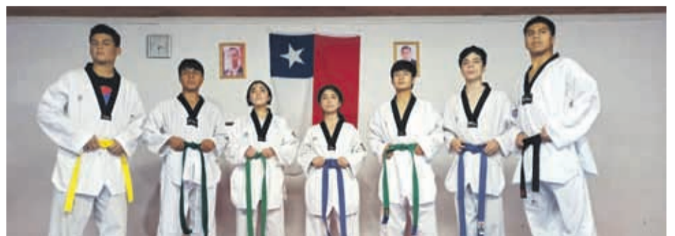
Un total de siete luchadores combarbalinos competirán en Costa Rica.