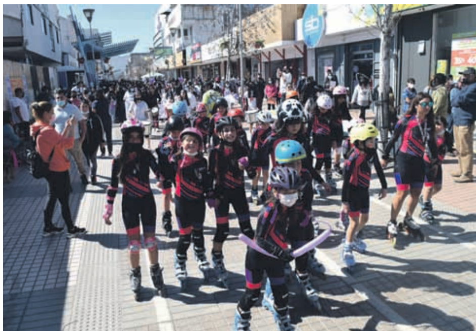
La academia de patín carrera de la escuela estuvo al frente de la marcha.

TIENEN NUEVAS ACTIVIDADES DENTRO DE LA PRÓXIMA SEMANA