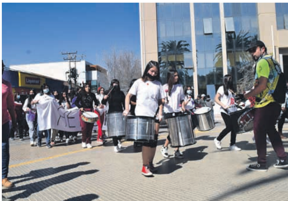
Las batucadas no dejaron de tocar durante toda la caminata.

Esta actividad se vivirá a partir de las 10 de la mañana de dicho sábado 27, en el área de estacionamiento del mall Open Ovalle, ante lo cual está invitada toda la comunidad ovallina.