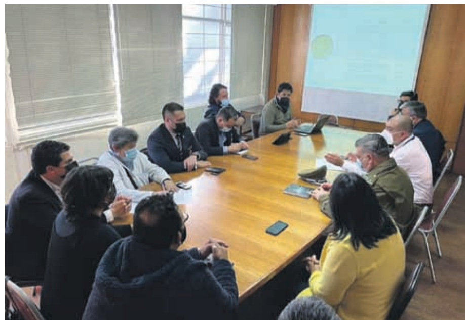
Vecinos y comerciantes del centro de Ovalle sostuvieron una reunión de seguridad con las autoridades.

“Los comerciantes están cerrando a las 6 de la tarde, antiguamente uno cerraba a las 7:30 o a las 8 de la tarde, pero ahora es peligroso, uno