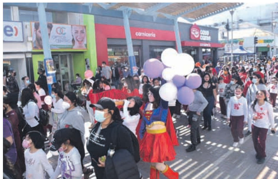
La comunidad educativa de la Escuela Helene Lang marchó por el centro para celebrar su aniversario.