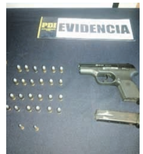
Un arma de fuego, municiones y un chaleco antibalas fueron incautadas en la residencia del detenido.

El imputado quedó a disposición del Ministerio Público para su control de detención.