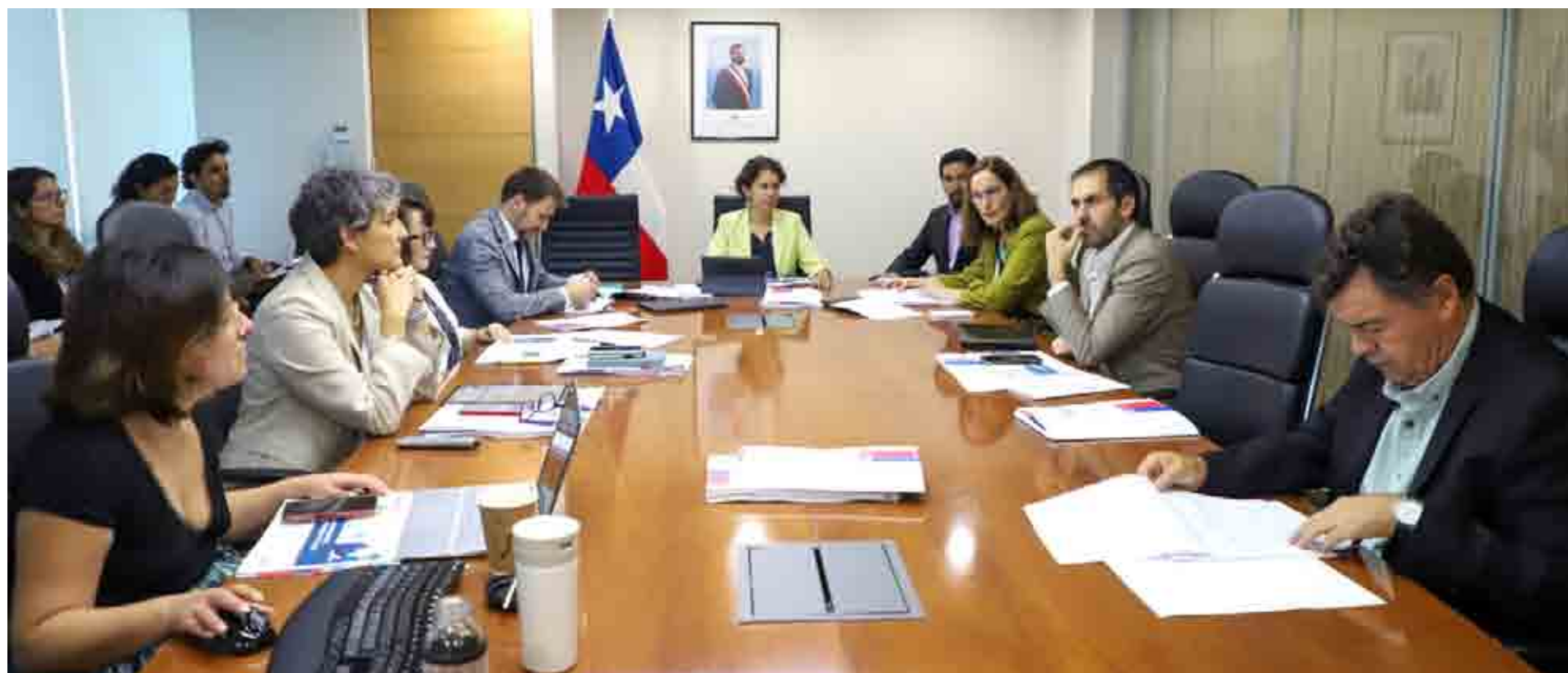
El comité de ministros será eliminado.