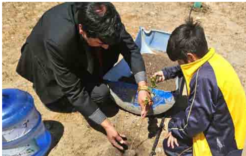
Los propios estudiantes de la Escuela Patricio Zeballos reforestaron el establecimiento.