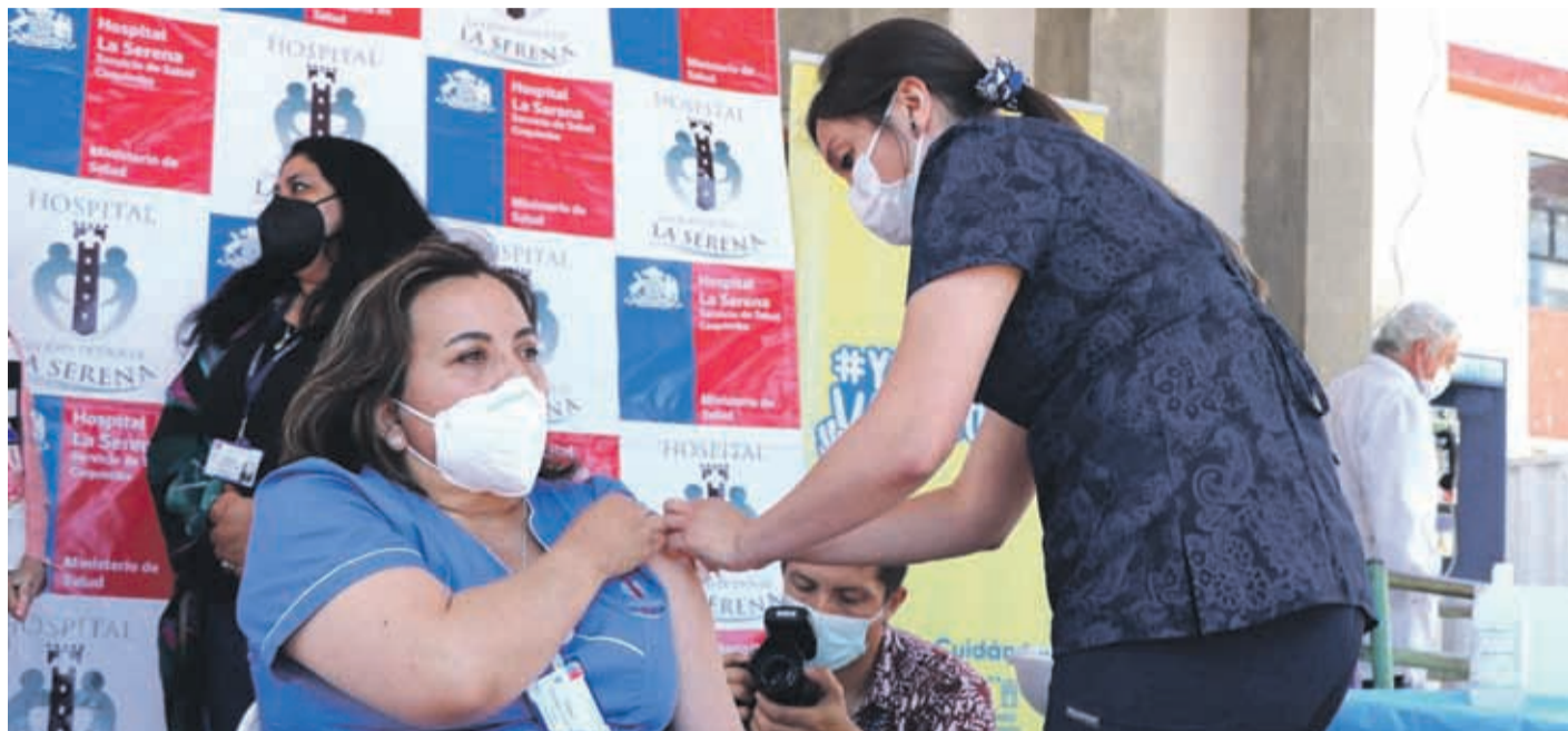
La cuarta dosis de la vacuna ya comenzó a administrarse al personal de salud de la región de Coquimbo.

En relación al reporte diario se anunció dos nuevas personas fallecidas a nivel regional a causa de Covid_19, una de Ovalle y una de Illapel. En el balance también destacaron 35