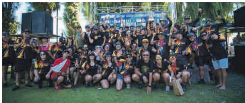
Ya quedaron atrás las exigentes seis fechas del Campeonato de MTB que se celebra en Limarí y el team Fénix festejó el título.

El torneo se desarrolló con fechas en las localidades de Barraza, Huampulla,