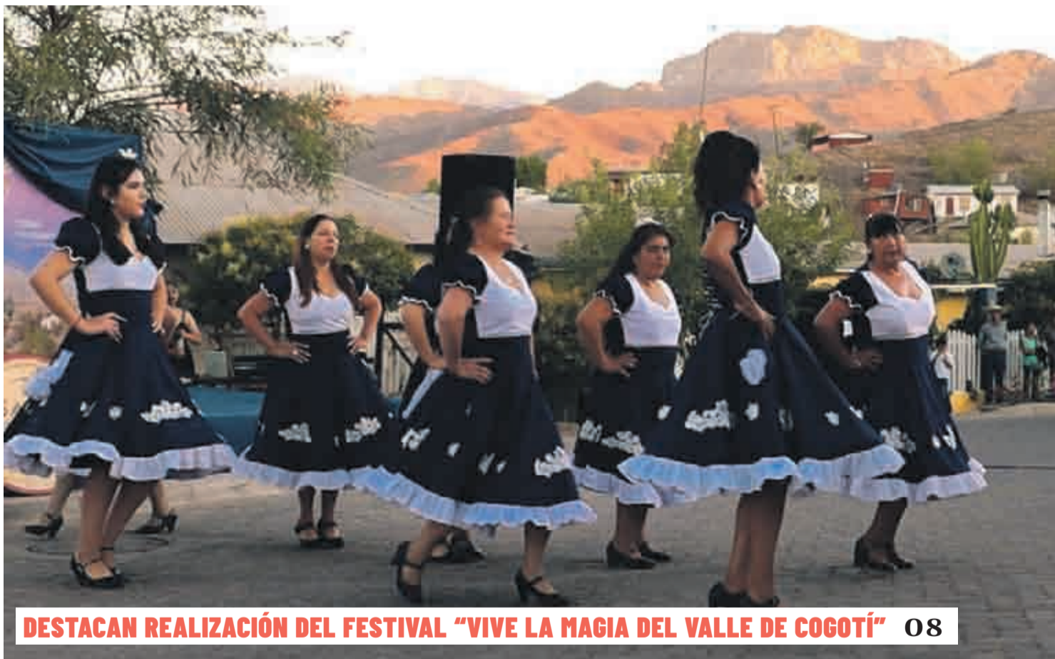
DESTACAN REALIZACIÓN DEL FESTIVAL "VIVE LA MAGIA DEL VALLE DE COGOTÍ" 08