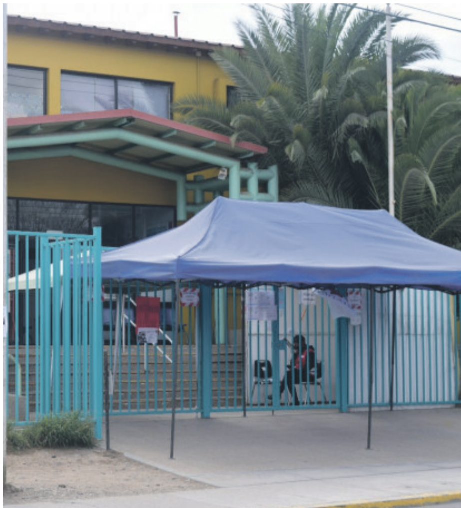
Recientemente, el Cesfam Marcos Macuada de Ovalle fue el escenario de una agresión hacia un médico por parte de un usuario