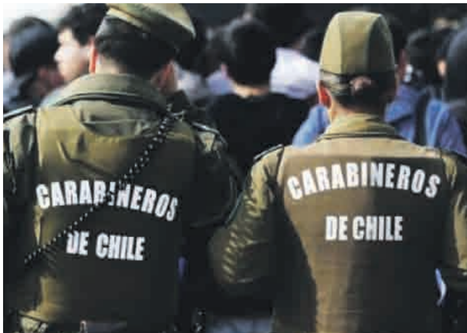
Según reportó Carabineros, el aviso se recibió de parte de un poblador del lugar.

Según reportó Carabineros, el aviso se recibió de parte de un poblador, quien manifestó que esa misma tar-