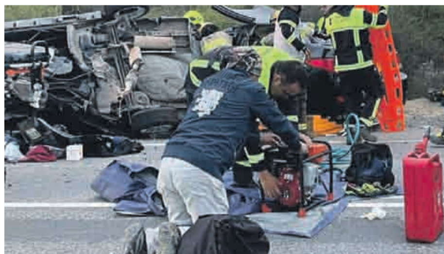
Según los antecedentes del caso, el hecho se registró en el kilómetro 14 de la ruta, a la altura del sector Peralillo

Por causas que se investigan, uno de los móviles, descrito como un