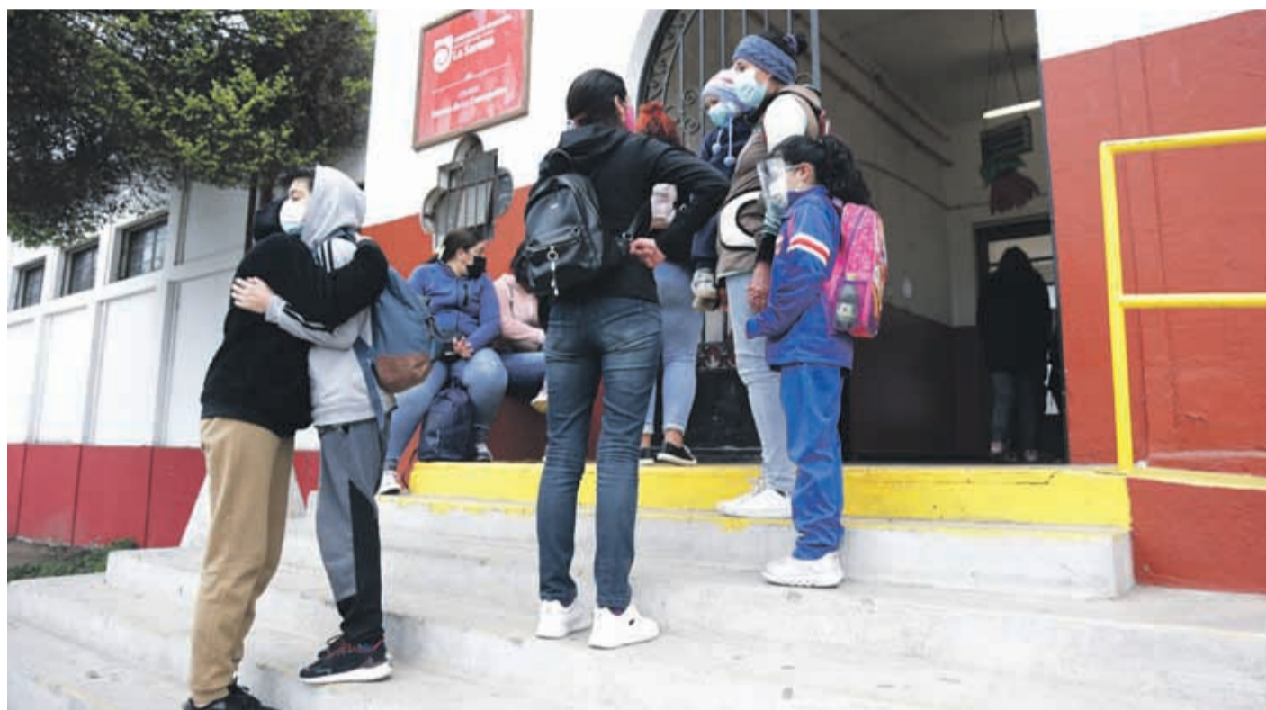
Los estudiantes vuelven a las aulas tras dos años en sistemas remotos y mixtos, por lo que el apoyo es fundamental.

A pocas semanas del comienzo del año escolar y del regreso a las aulas, surgen dudas y preocupaciones por el bienestar y la seguridad de los estudiantes y cómo los afectará psicológicamente este proceso. Por ello, expertos en educación entregan recomendaciones y hacen hincapié en la importancia de prevenir el acoso escolar.