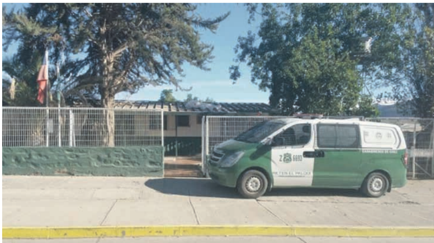
La denuncia de la mujer fue realizada en el retén de Carabineros de El Palqui.

Según relata la mujer, la denuncia fue realizada en Carabineros, con todos