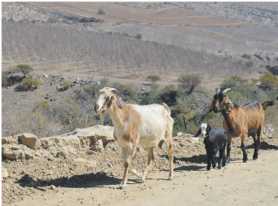
La trashumancia es un arraigado método de ganadería que vendría desde épocas prehispánicas.