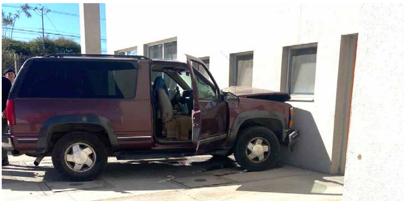
El accidente ocurrió la mañana de este martes, donde afortunadamente no hubo vidas que lamentar.

"Tras más de una hora después de estar en estado de recuperación, el equipo médico procede a darle el alta y le entrega de manera escrita y verbal a la mujer que lo cuidaba, la indicación de no conducir el vehículo con el que llegó al hospital y preferir usar un taxi. Lamentablemente ambos no siguieron las indicaciones y el paciente de 81 años trató de