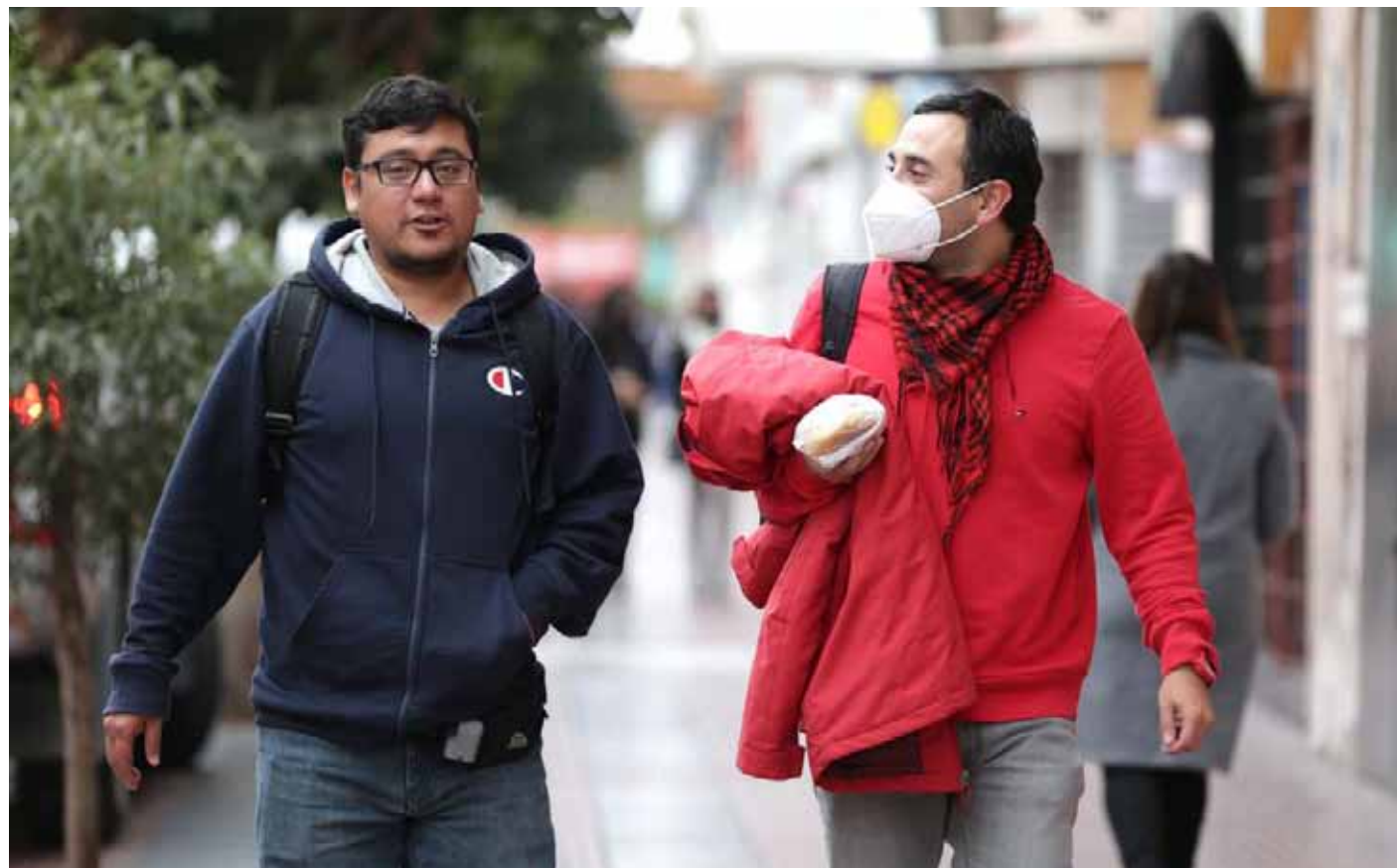
¿Se volverán a observar las mascarillas en las calles? Lo cierto, es que la circulación del patógeno continúa incrementándose.