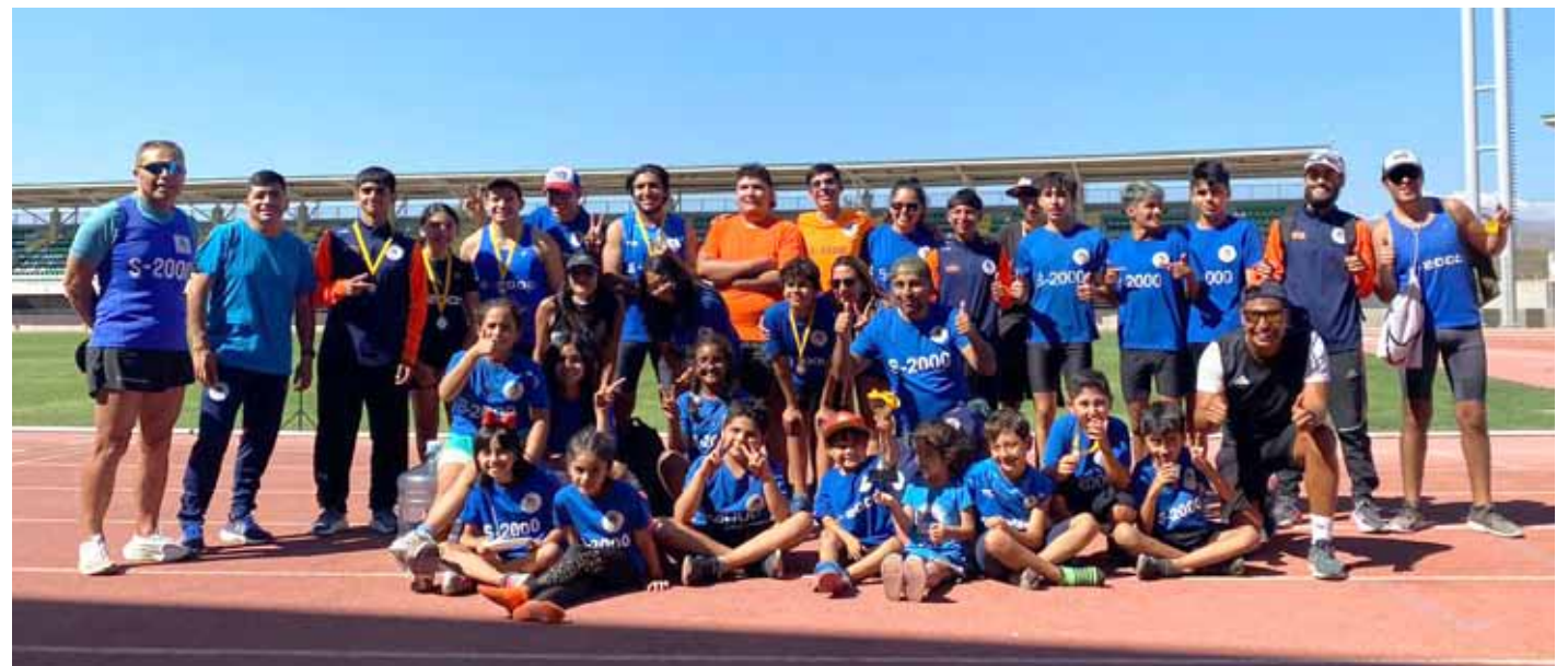
El club S-2000 celebrará este sábado 24 de febrero sus 28 años con la realización de un campeonato.