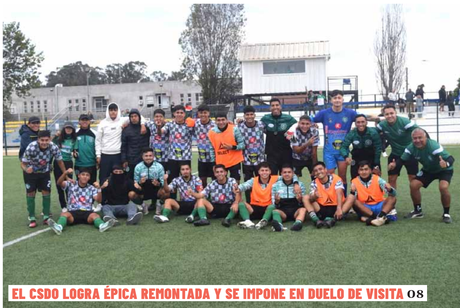
EL CSDO LOGRA ÉPICA REMONTADA Y SE IMPONE EN DUELO DE VISITA 08

Los relatos de descendientes de aquellos cientos de extranjeros que hace décadas se establecieron en la zona, los recuerdos de esta tierra que aún se mantienen en la memoria de aquellos ovallinos que brillan en otros rincones y la experiencia de dos profesores que decidieron salir a recorrer el mundo, son parte de los relatos recogidos en el Especial de El Ovallino por los 193 años de nuestra querida ciudad.