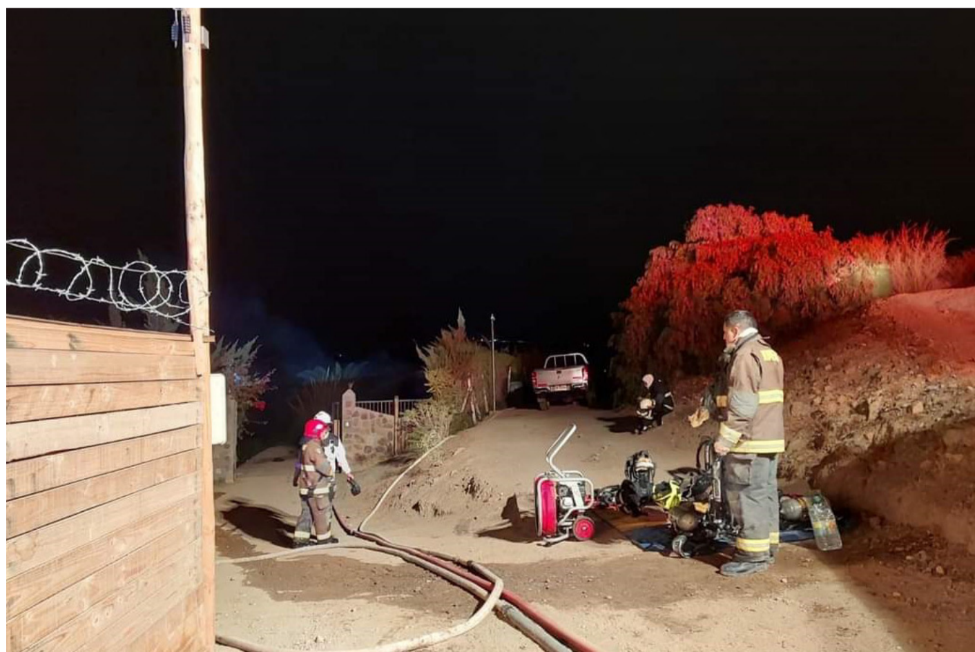
Bomberos de Monte Patria trabajan por dos horas y media en el incendio de la vivienda.

“Con nuestro equipo social y de emergencia nos hemos puesto en contacto con la familia y estaremos aportando desde estas áreas para apoyar a superar este difícil momento”, sostuvo.