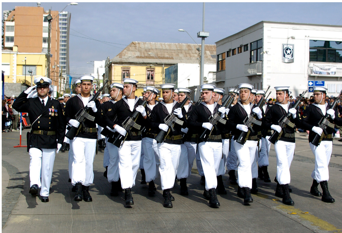
Desde la Gobernación Marítima destacaron la presencia de niños y niñas en el desfile que se tomó las calles de la comuna puerto.