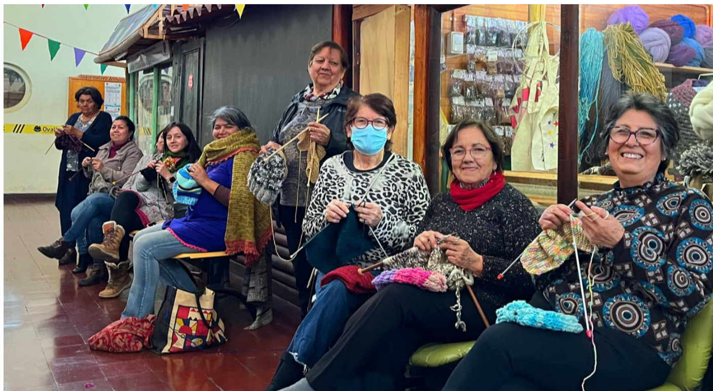
La convocatoria es para las 14:00 hrs de este sábado 24 de junio, en el Mercado Municipal.

La representante del mercado también realizó un llamado a la comunidad "invitamos a todas las personas a sumarse este sábado que es la segunda jornada, necesitamos alcanzar la meta. La idea es que puedan traer sus implementos y venir en familia, incluso si no sabe tejer aquí puede aprender, solo hay que venir con ganas de ayudar. Habrá presentaciones artísticas, actividades por el Año Nuevo Indígena y rico mate para compartir".