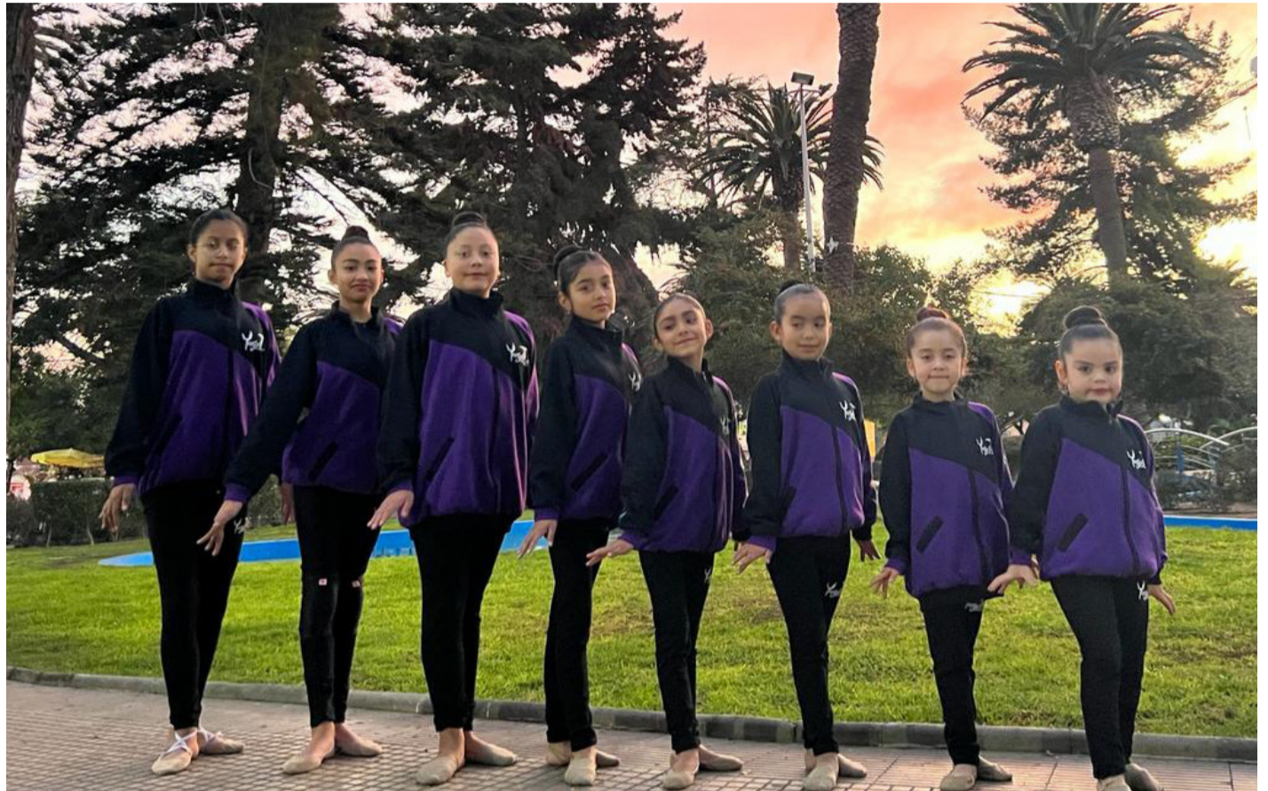
Un total de 8 gimnastas de la academia Jugarte participarán del torneo nacional federado.

Por otro lado, la academia Jugarte junto a la academia municipal de gimnasia rítmica de Ovalle se encuentran organizando un encuentro deportivo para este sábado 24