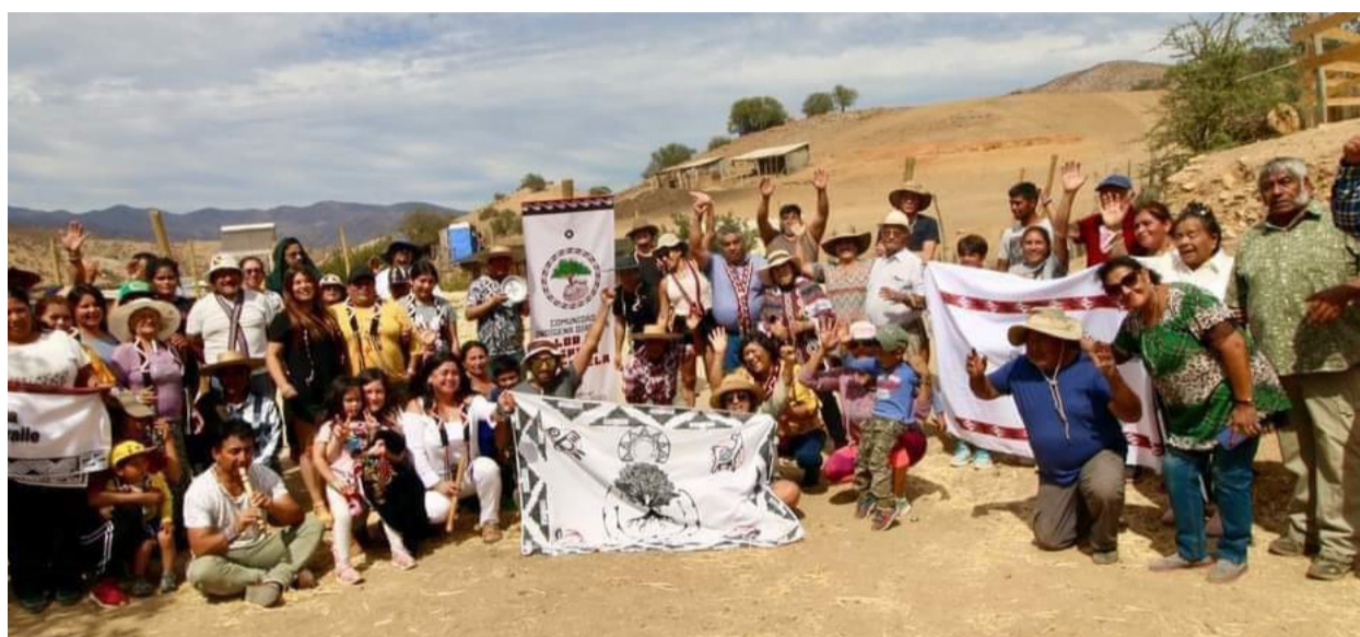
Encuentro de comunidades Diaguitas en Canela.

"Esta fue una actividad comunal que empezó a las 12 del día con una muestra de bailes típicos de los pue-