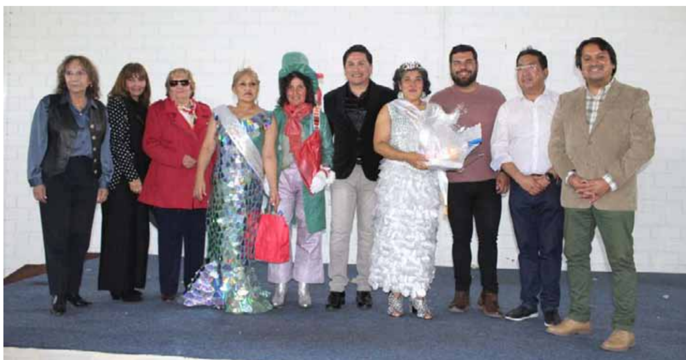
Imagen de las autoridades comunales y las representantes de los centros de madres, con sus trajes elaborados para la ocasión.