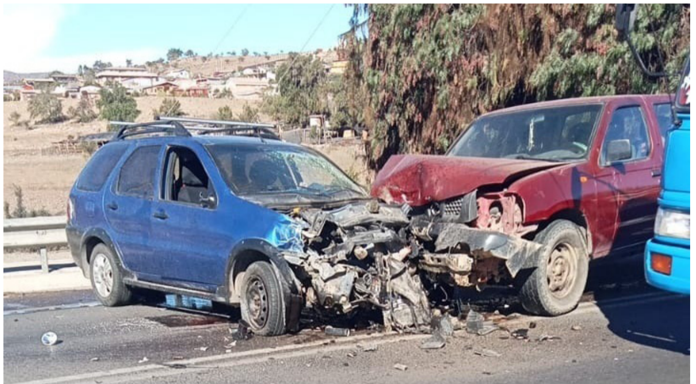
Un automóvil Station Wagon y una camioneta chocaron frontalmente en la tarde de este lunes.

“Yo pienso que hace falta un semáforo, no hace muchas semanas atrás que hubo otro accidente en el cruce de Los Leíces, y fue de día, y este choque frontal también fue de día, por eso yo pienso que se necesitan semáforos en el lugar. También faltan