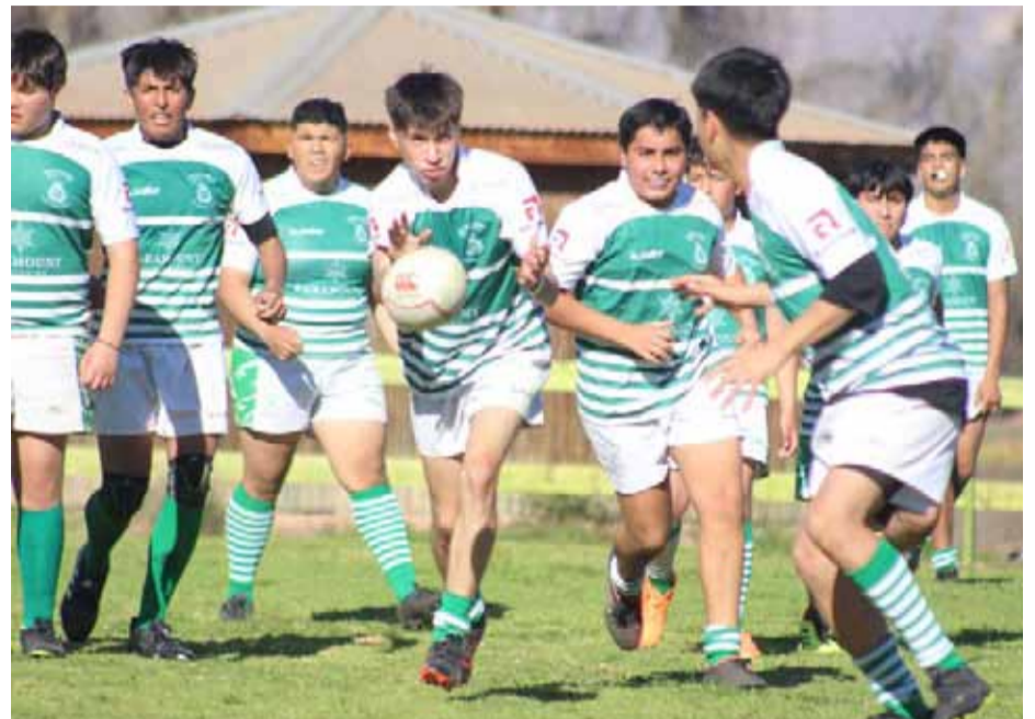
En la imagen, los representantes de Seminario Rugby Club de La Serena.

El club ovalino agradeció a sus colaboradores, ya que sin su apoyo esto no sería posible: Liceo Agrícola Tadeo Perry Barnes y SNA Educa; Aguas Purificada La Paloma; Oficina de la Juventud de la IMO; Clínica Secuelas; Botillería Pueblo Nuevo, la Ilustre Municipalidad de Punitaqui, la Ilustre Municipalidad de Ovalle y Diario El Ovallino.