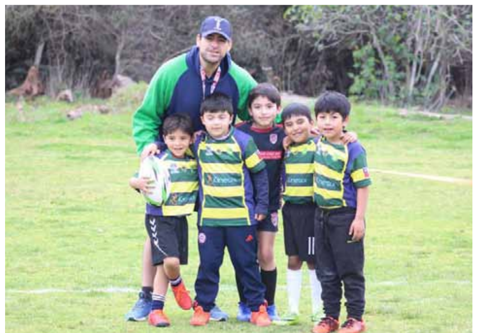
En la imagen, los dueños de casa, Ovalle Rugby Club.