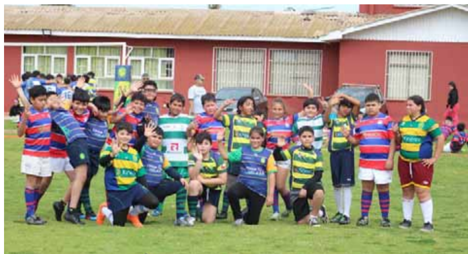
Cerca de 150 niños y jóvenes se reunieron en el festival de rugby.