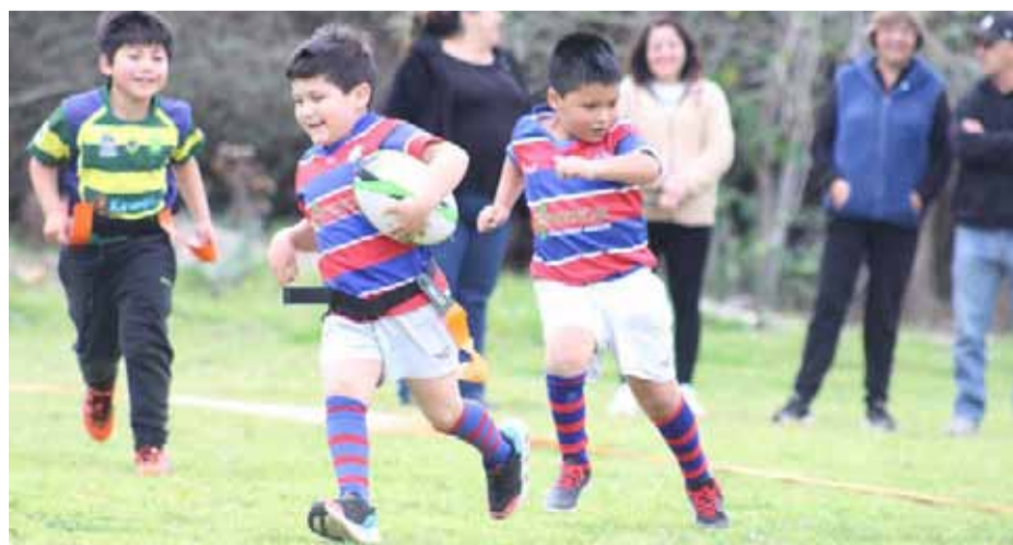
Desde los 6 años los equipos comienzan a desarrollar las escuelitas de rugby.