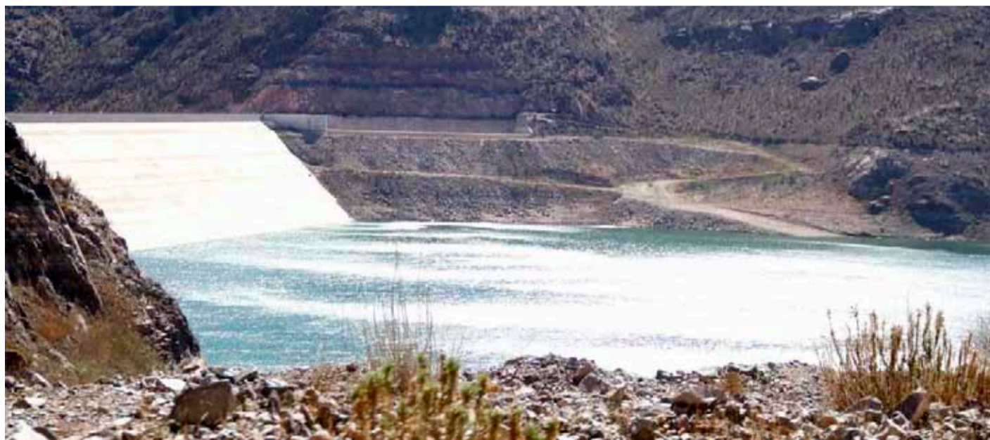
A un 14% de su capacidad se encuentra el embalse Puclaro, de acuerdo a la DGA.