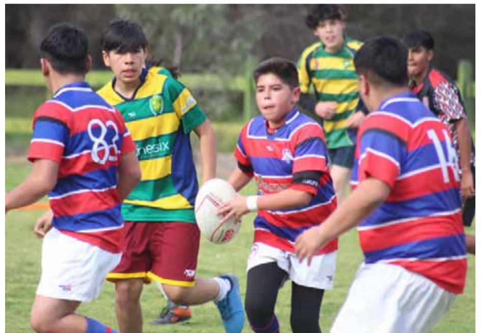
Carneros RB también participaron en la actividad.