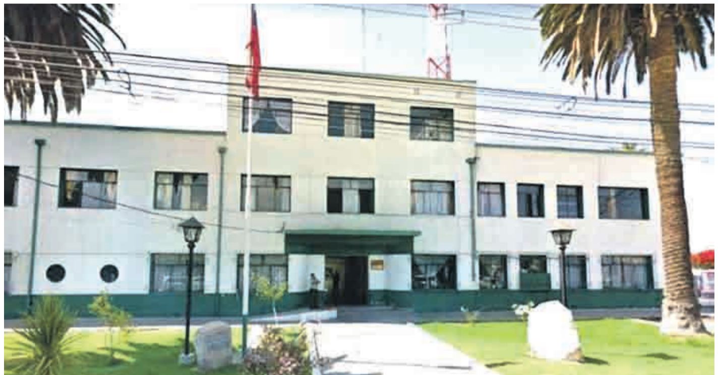
Desde el Alto Mando de Carabineros se aseguró que no se aceptarían “manzanas podridas” en la institución, tras la baja de siete uniformados en Ovalle.

Siete funcionarios policiales fueron apartados de la institución tras detectarse una posible falsificación de un parte en un caso de drogas en el sector rural. La comunidad espera sanciones para los responsables, pero alerta su preocupación por la merma en el contingente disponible para enfrentar contingencias en el territorio.