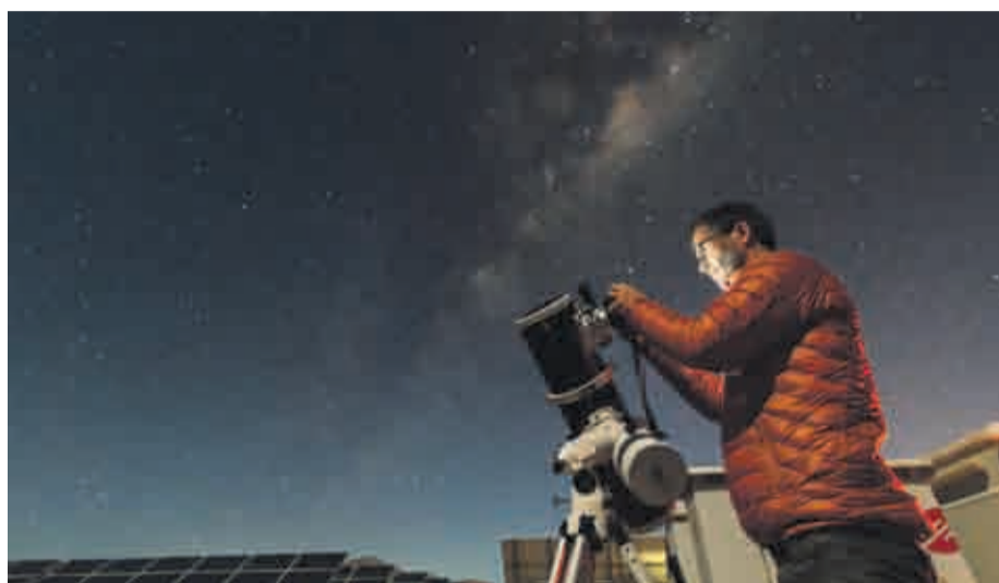
En la provincia sostienen que no tienen nada que envidiarle a los cielos del Elqui. Por ello buscan desarrollar una actividad que, actualmente, tiene una gran demanda turística.

En esas labores están varios alcaldes y sus equipos, en conjunto con instituciones, entidades y emprendedores,