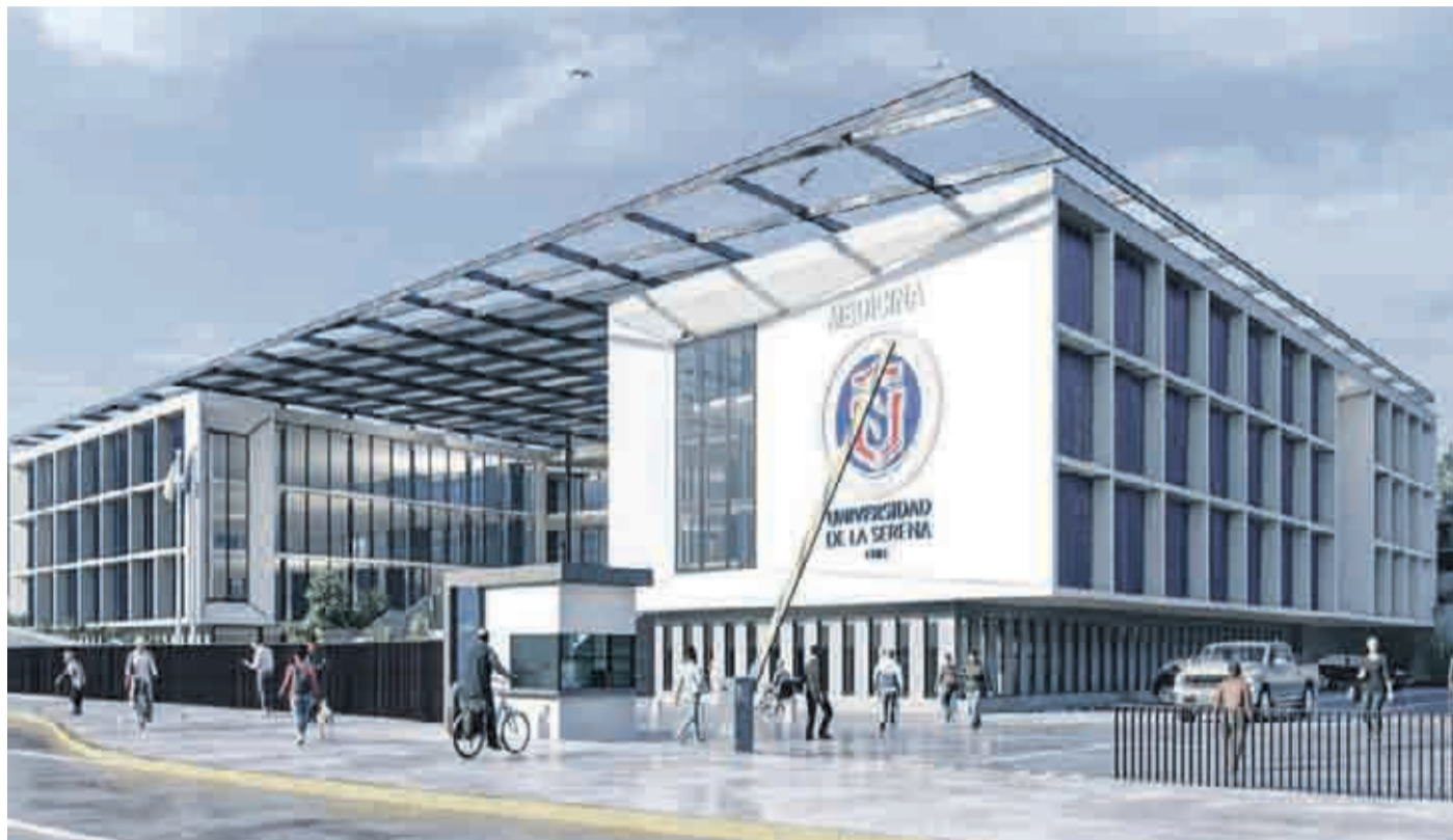
Imagen proyectada del futuro edificio que albergará la carrera de Medicina de la Universidad de La Serena.