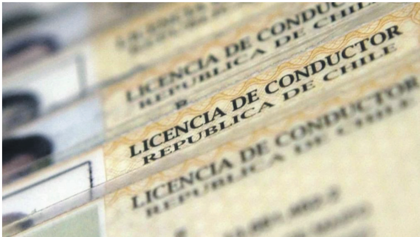
El vencimiento de la licencia de conducir complica a conductores y autoridades quienes deben reducir aforos y extremar protocolos

Por otra parte el panorama en el municipio de la comuna de Monte Patria este diferente, la máxima au-