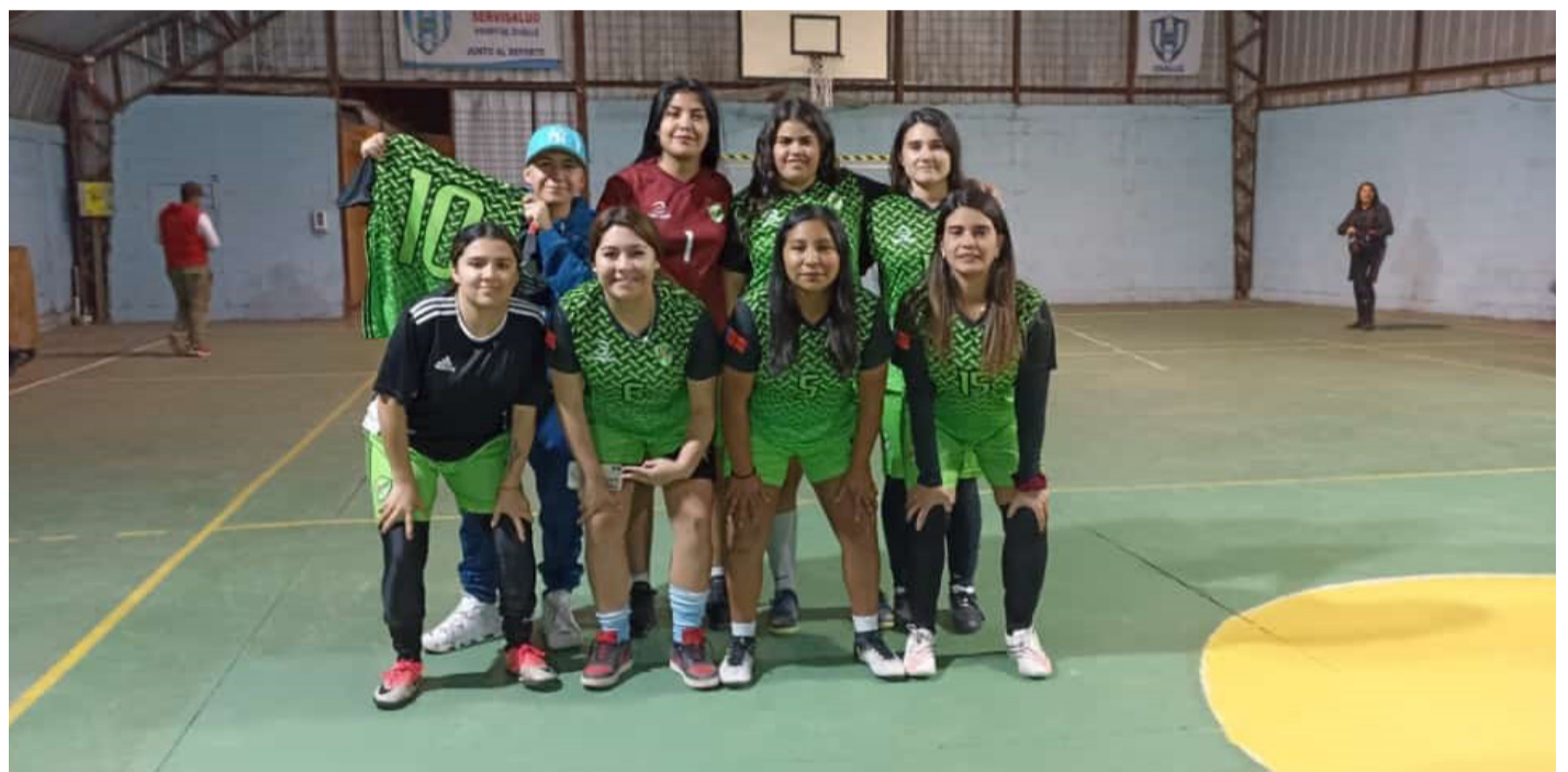
El equipo femenino Atlético Ovalle obtuvo el primer lugar del cuadrangular.

Con partidos de baby fútbol varones y un cuadrangular de damas, durante junio-julio se celebró un nuevo aniversario del Deportivo Servisalud, quienes realizaron un campeonato que fortaleció la camaradería y el deporte entre los funcionarios del hospital de la comuna.