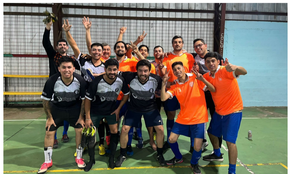
Los equipos estuvieron conformados únicamente por personal del Hospital de Ovalle.

PRESIDENTE SERVISALUD HOSPITAL DE OVALLE