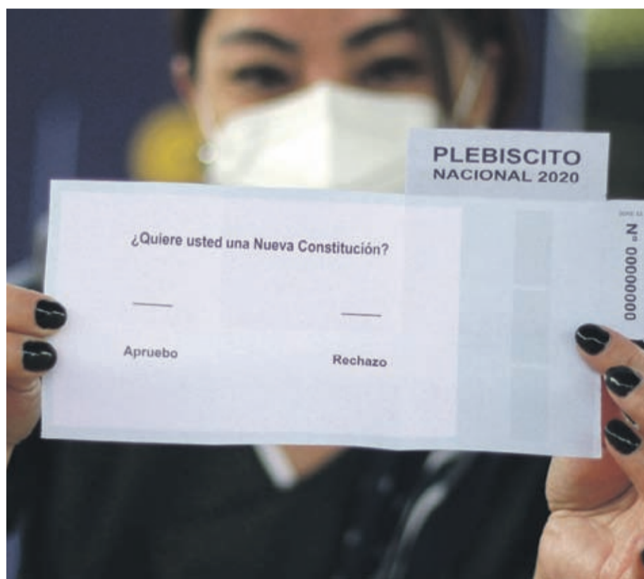
Más de 91 mil personas están habilitadas para sufragar este domingo en Ovalle.

Atrás quedó eso y los distintos comandos se reformularon, a través de puerta a puerta o en caravanas. Así lo hizo el comando Apruebo Chile Digno, integrado por el Partido Comunista y el Partido Progresista. Recorrieron las principales arterias de la ciudad, dando por finalizado el período de