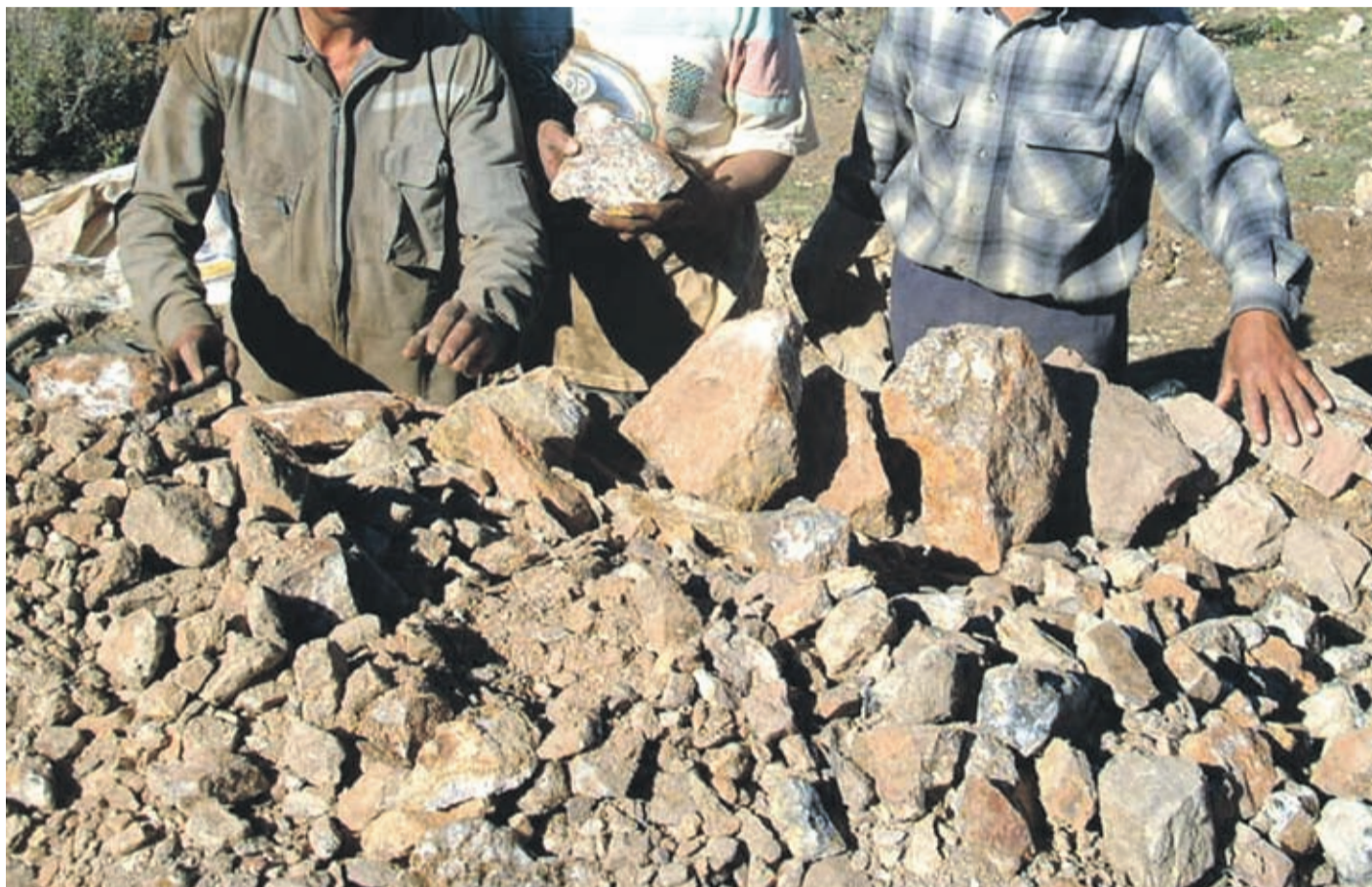
Los más afectados serían los pirquineros adultos mayores de la región.

Parte de las gestiones para tratar de resolver esta problemática, el dirigente sostuvo que junto al seremi de Minería, Roberto Vega, "se han barajado las posibilidades de la reducción del pago y dividirla en cuota, pero hasta el día