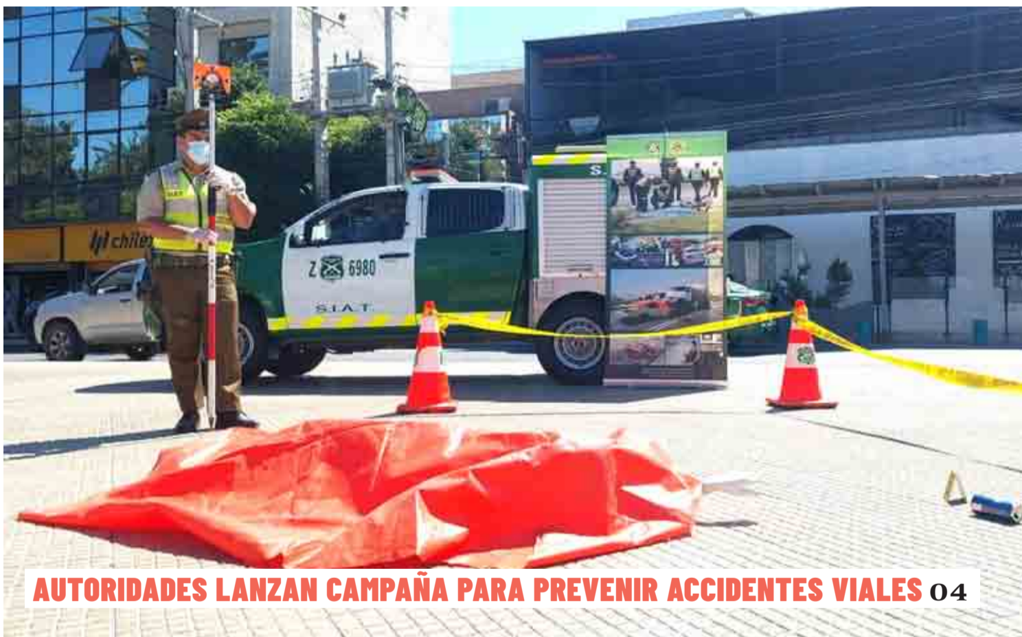
AUTORIDADES LANZAN CAMPAÑA PARA PREVENIR ACCIDENTES VIALES 04

Esta semana se llevó a cabo un procedimiento de la PDI por microtráfico, logrando incautar marihuana y pasta base de cocaína. En este contexto, vecinos y concejales expresaron su preocupación por este tipo de ilícitos, que muchas veces desembocan en otros delitos, como robos y asaltos. 02