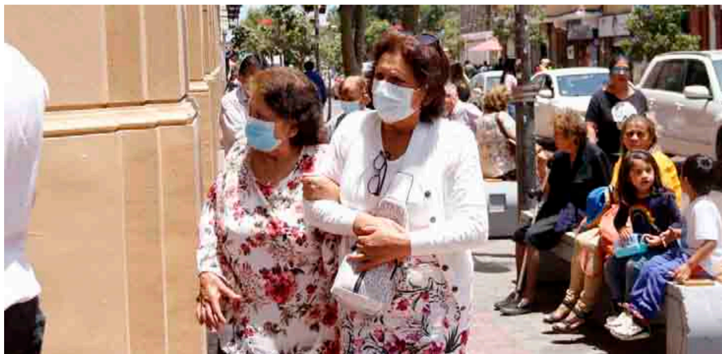
Como una forma de evitar riesgos, se recomienda utilizar mascarilla al salir a lugares públicos.