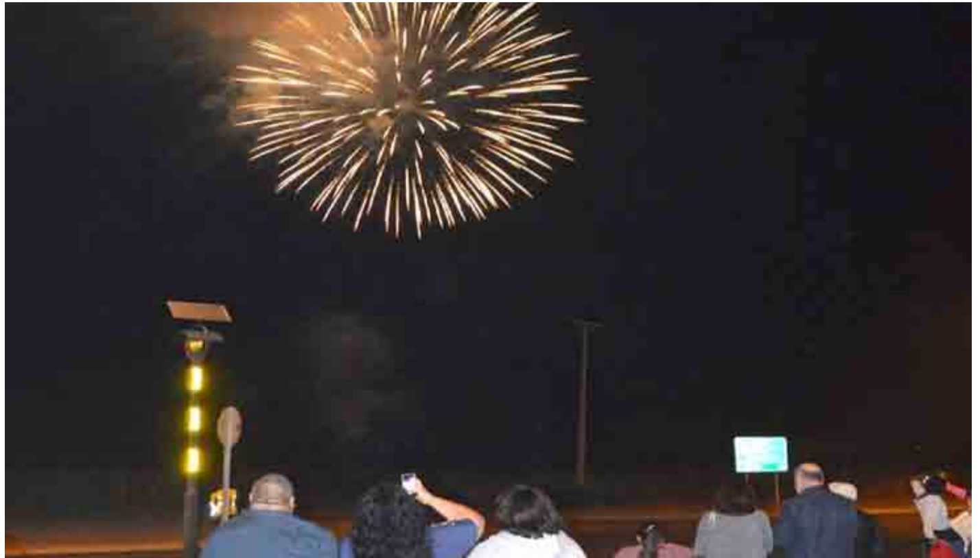
Desde hace bastantes años que no se ha suspendido el lanzamiento de fuegos artificiales en Ovalle y las otras comunas del Limarí.

En ese contexto, el alcalde punitaquiño destaca un panorama familiar que tendrán en su comuna para estas celebraciones de cierre del 2023, "si bien no habrán fuegos artificiales este año, seguimos con la centenaria