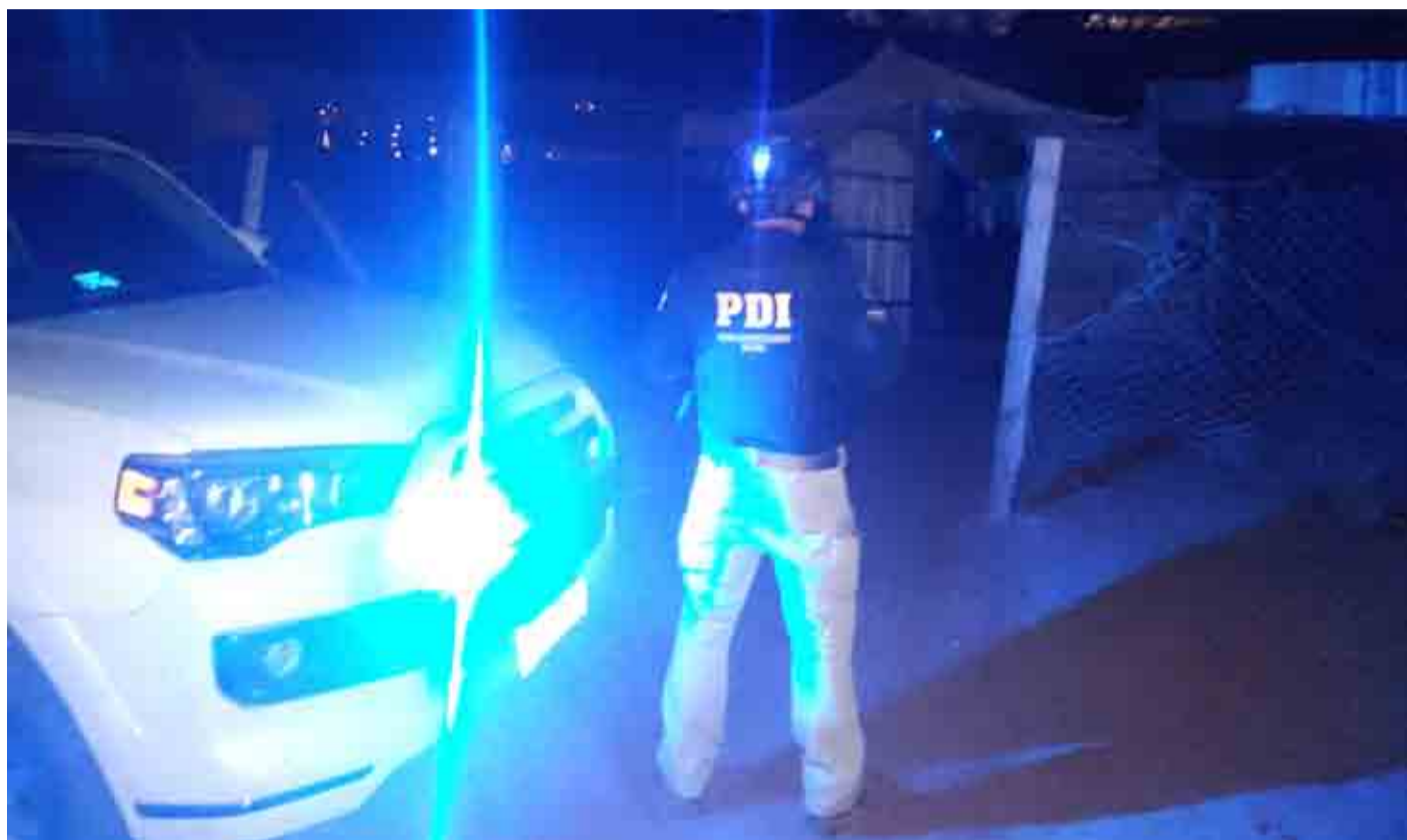
En la noche del jueves la PDI incautó droga de dos domicilios en la comuna de Combarbalá.

Esta semana se llevó a cabo un procedimiento de la PDI por microtráfico, logrando incautar marihuana, pasta base de cocaína e incluso un arma. En este contexto, vecinos y concejales de la comuna expresaron su preocupación por este tipo de ilícitos, que muchas veces desencadenan en otros delitos, como por ejemplo, robos y asaltos.