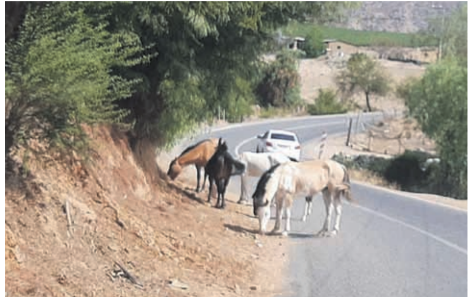
Es común ver burros y caballos en las carreteras del Limarí.

"Actualmente no contamos con una ordenanza que regule este tema de tenencia de animales de corral o caballares, se ha planteado si el poder generarla, pero no hemos podido llevarla a cabo ya que para hacer efectiva esta ordenanza necesitamos un corral municipal, ya que el animal cuando está en carretera hay que generar el retiro correspondiente y muchos de estos animales tampoco cumplen con lo que dice el SAG que tienen que estar marcados, entonces quedamos en la