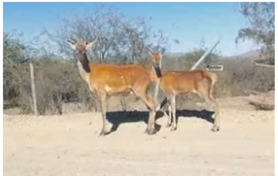
Ciervos avistados este martes 22 de febrero.