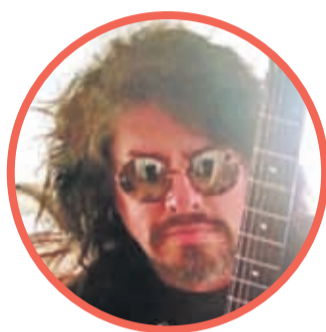
JC Blues GUITARRISTA

"En el caso mío estoy a favor del quinto retiro y esperamos que el presidente Boric esté dispuesto a apoyarnos con algún subsidio especial para nosotros"