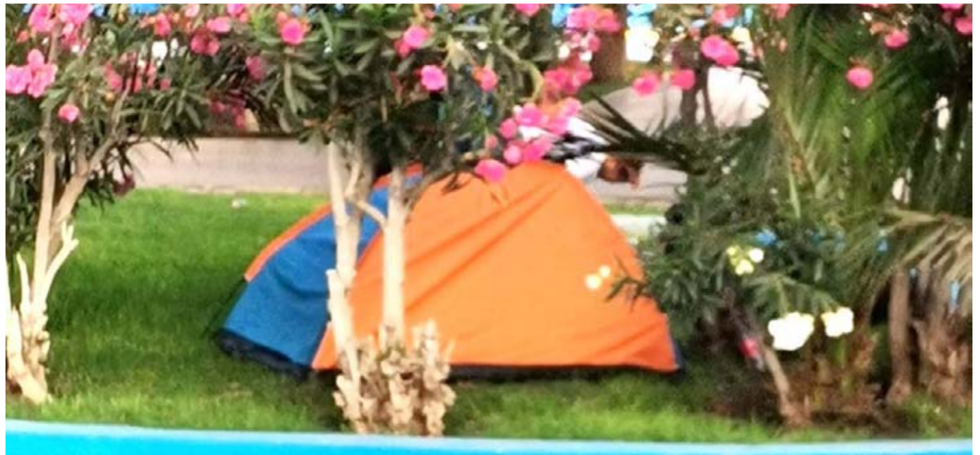
Vecinos y comerciantes acusan inseguridad y condiciones insalubres tras la pernocta de gente en carpas en la plaza central LEONEL PIZARRO

A un costado de la fuente de agua de la plaza de armas ovallina se instaló una carpa con dos ocupantes, situación que genera preocupación en la comunidad por los problemas de higiene y seguridad que esto podría provocar. Desde la Municipalidad de Ovalle aseguran que desalojan cuando este tipo de hechos ocurren en distintos puntos de la comuna, así como se realizan rondas preventivas con los vehículos de seguridad.