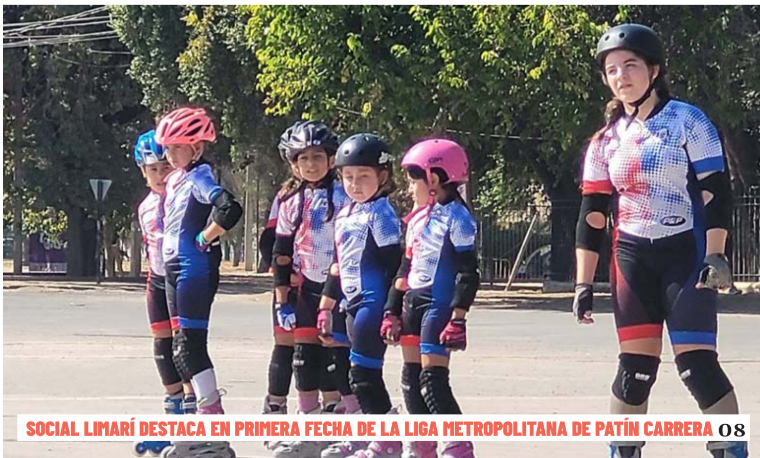
SOCIAL LIMARÍ DESTACA EN PRIMERA FECHA DE LA LIGA METROPOLITANA DE PATÍN CARRERA 08

Este miércoles un grupo de padres ingresó al colegio de la población 21 de Mayo y agredió de manera violenta a docentes y funcionarios. Un presunto episodio de agresión y abuso en contra de una alumna del establecimiento por parte de un auxiliar, habría originado el hecho. 03