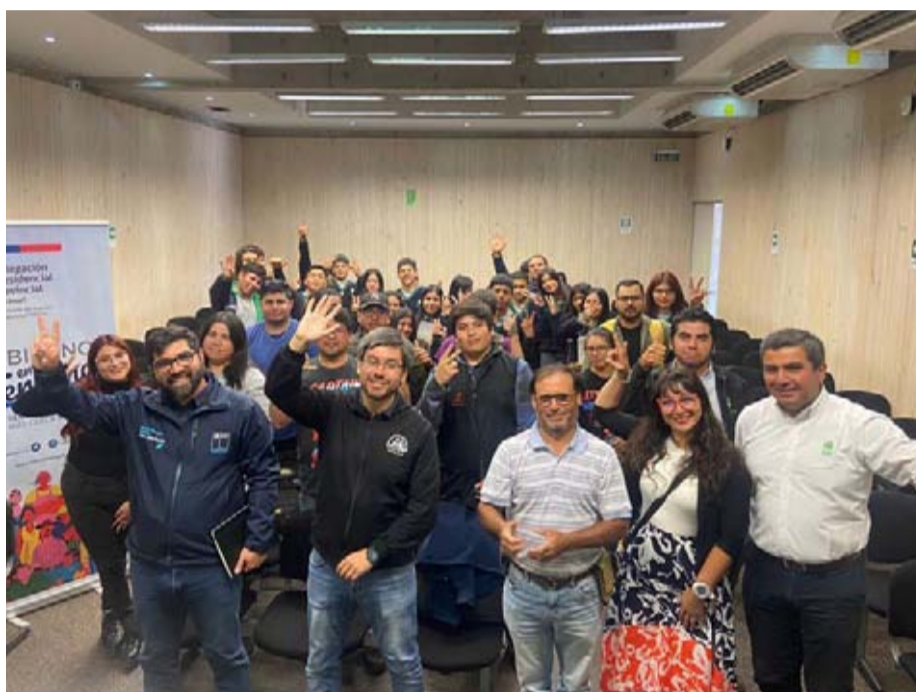
Más de cien alumnos de diferentes instituciones recibieron una charla científica en el contexto del Día Mundial del Agua.

“En esta conmemoración del día mundial del agua en una actividad logramos hacer confluír a instituciones de educación superior de la provincia, establecimientos de enseñanza media técnica profesional con instituciones científicas relevantes en para el uso eficiente del recurso hídrico. También pudimos reiterar nuestro esfuerzo y compromiso como Gobierno, de tener