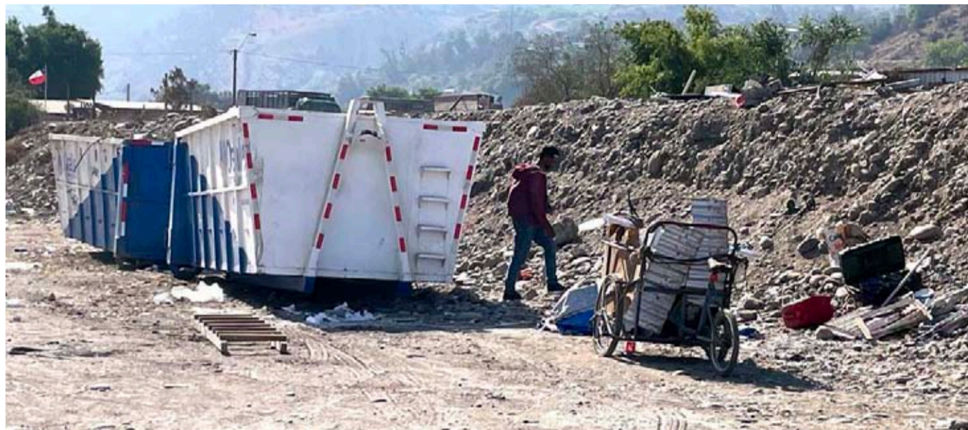
Algunos microbasurales se crean alrededor de los contenedores que son vaciados para buscar elementos para reciclar.

"La situación se ha tornado muy crítica porque varias personas, principalmente indigentes, se han tomado