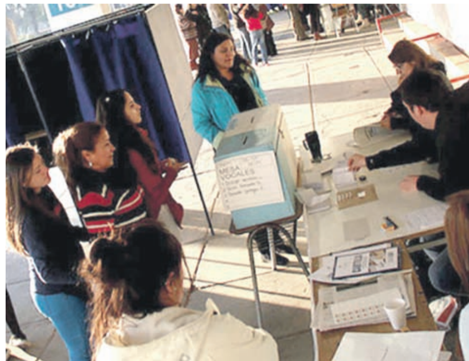
Se proyecta que el "voto joven" aumente considerablemente en este Plebiscito. EL OVALINO

La votación del 25 de octubre ya toma ribetes de histórico, porque será la primera vez en que en Chile se consulte a sus habitantes si quieren o no que se redacte una nueva Constitución. En este sentido, Marín