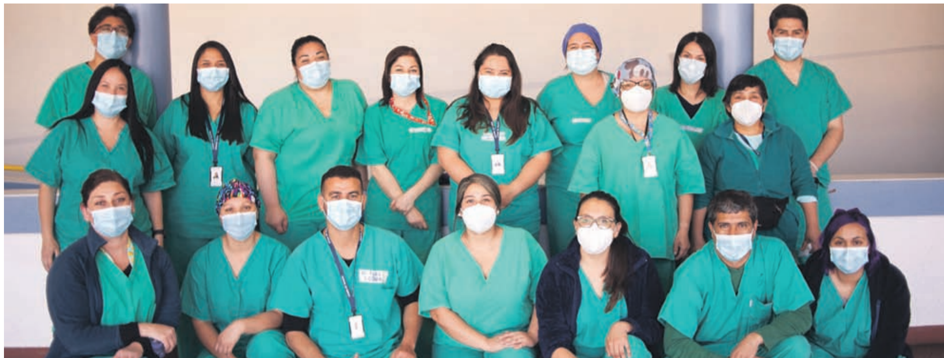
Personal de salud del último turno que le tocó laborar en el recinto habilitado exclusivamente para pacientes Covid-19.