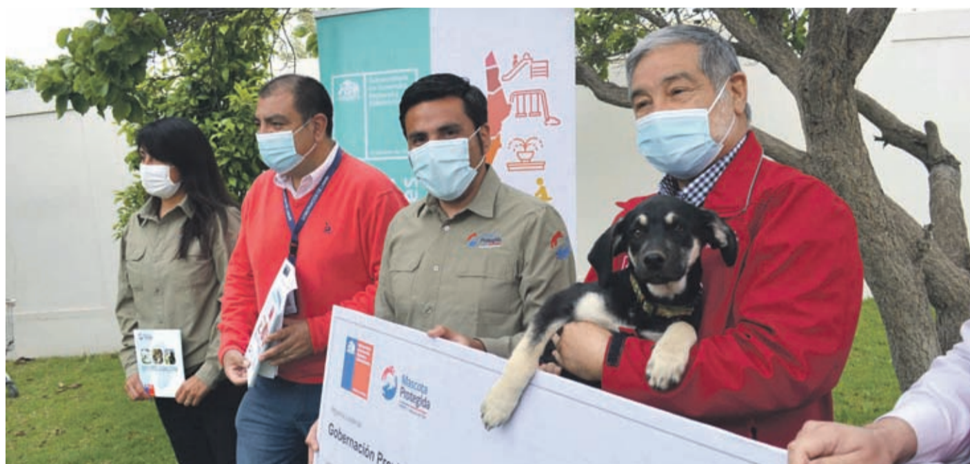
Un total de mil 200 esterilizaciones e instalaciones de chips en mascotas se realizarán en la provincia.

Señaló que el proyecto contempla la instalación de microchips de identificación y la vacunación con antiparasit-