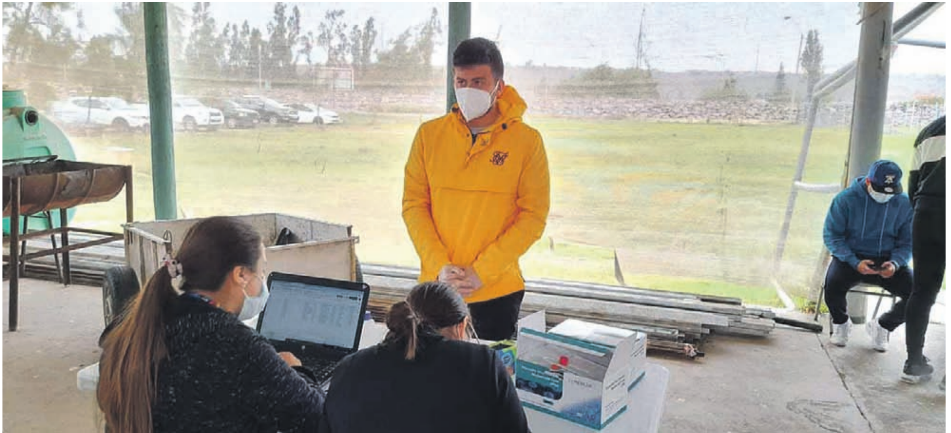
El plantel de jugadores se realizó el examen de PCR antes del comienzo de los entrenamientos.