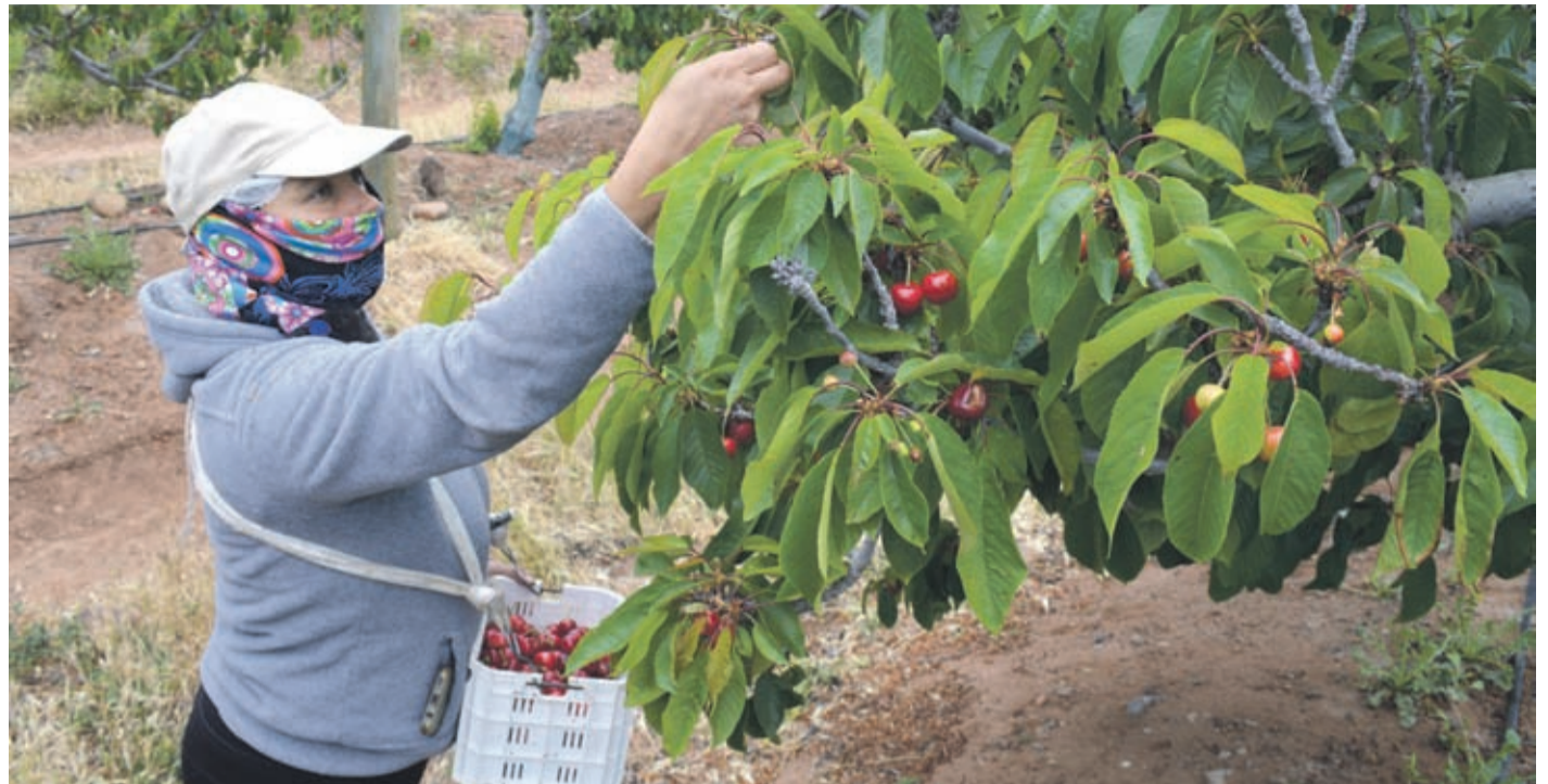
La producción de cerezas Brooks del fundo Tabalí, estaría llegando al mercado chino durante este fin de semana.

“Este año somos los primeros en el norte de Chile en sacar y poder exportar la fruta, mientras somos el segundo en el país, ya que por unos días se nos