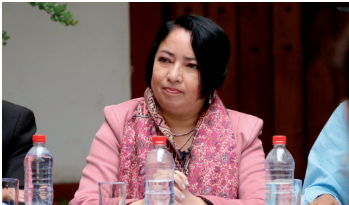
Nuevamente, la gobernadora es protagonista de una nueva polémica.