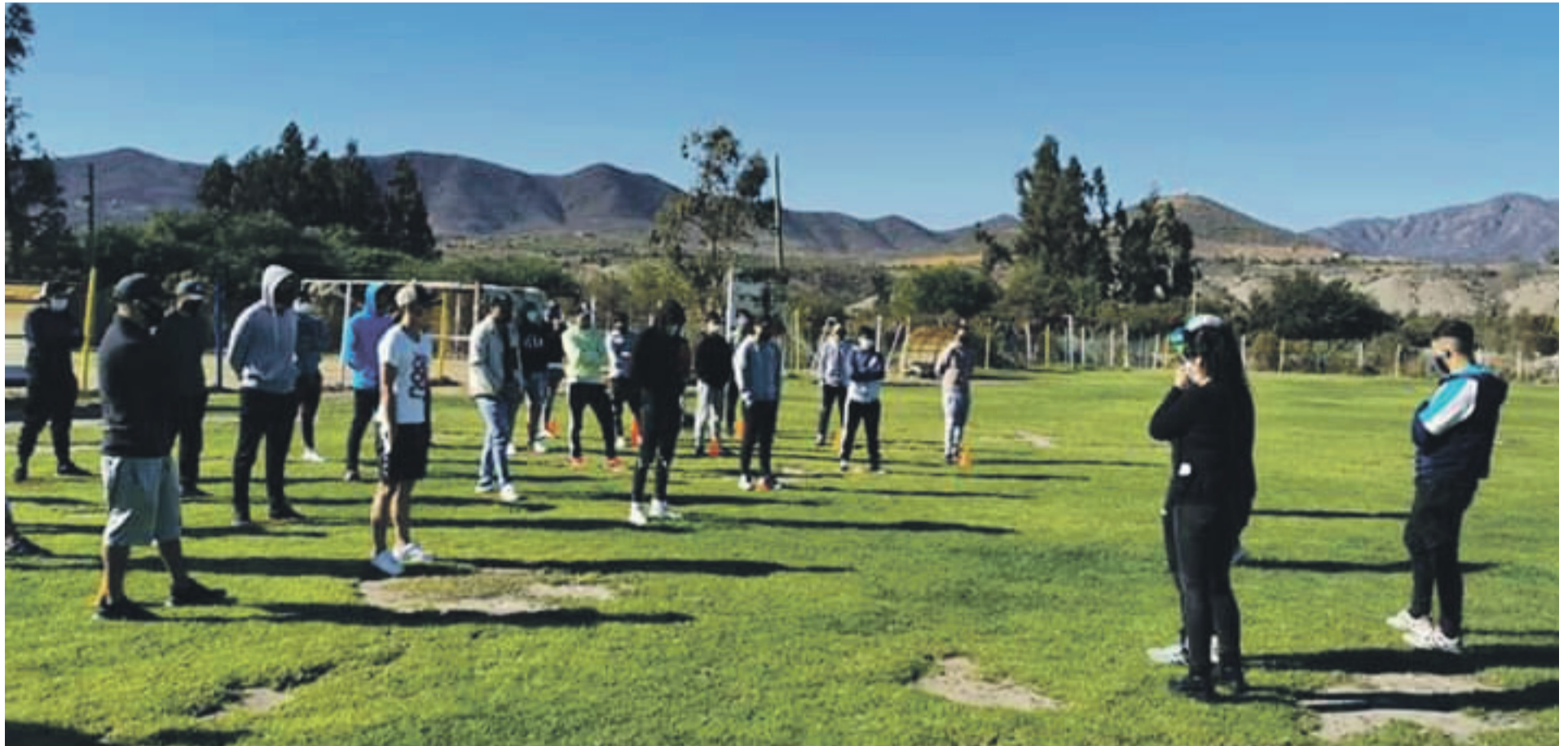
El equipo se reunió el día sábado, adoptando las medidas de seguridad necesarias para evitar contagios de Covid-19.