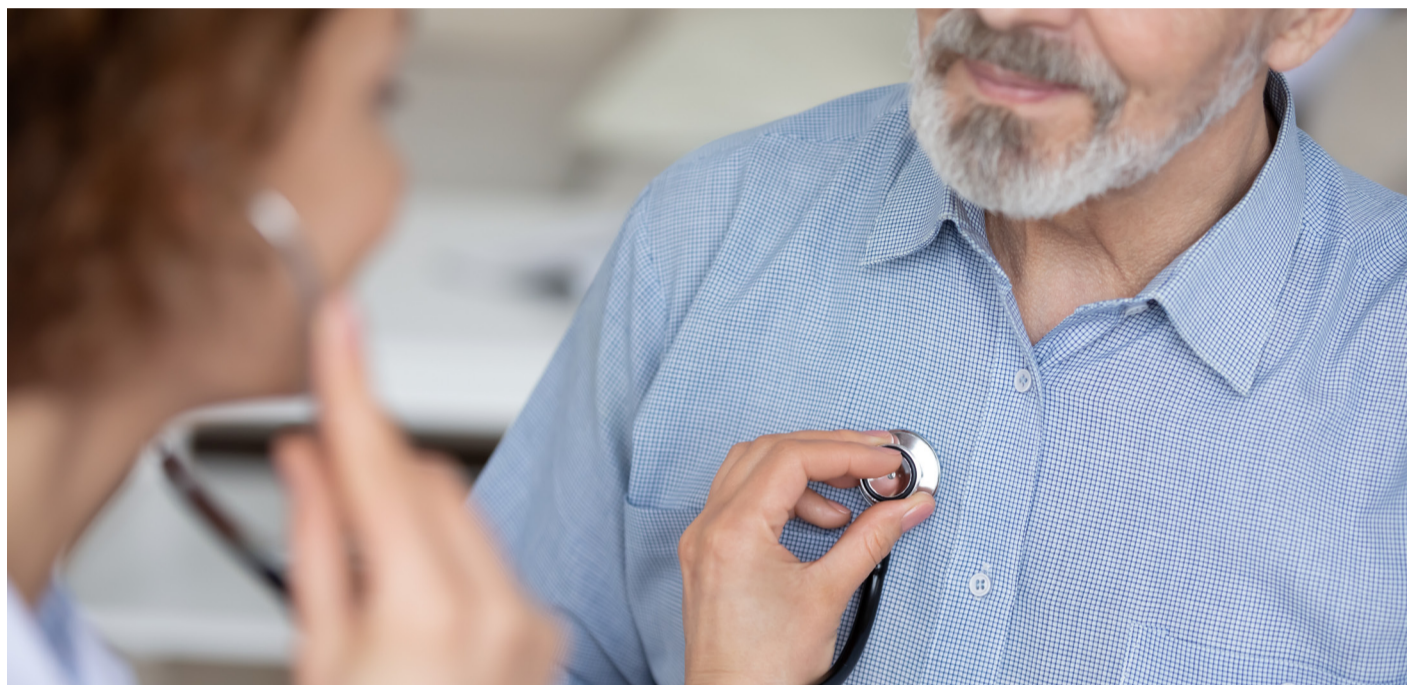
Bajo el concepto "Da un respiro a tus pulmones", FALP presentó por segundo año consecutivo su campaña educativa y de detección precoz de esta enfermedad

Al igual que otras patologías oncológicas, el cáncer de pulmón tiene un fuerte impacto a nivel regional. De acuerdo con información del DEIS, durante 2022, la Tasa Ajustada de