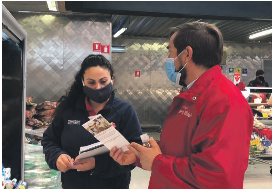
La normativa es clara. Todos aquellos trabajadores deben contar con un tiempo de dos horas para ir a sufragar.

Al respecto, el seremi del Trabajo, Matías Villalobos, explicó que “esta es una normativa que se ha implementado justamente para proteger el derecho a voto de los trabajadores, que por diferentes razones deben prestar servicios durante el día de sufragio. Por lo tanto, el llamado que hemos hecho