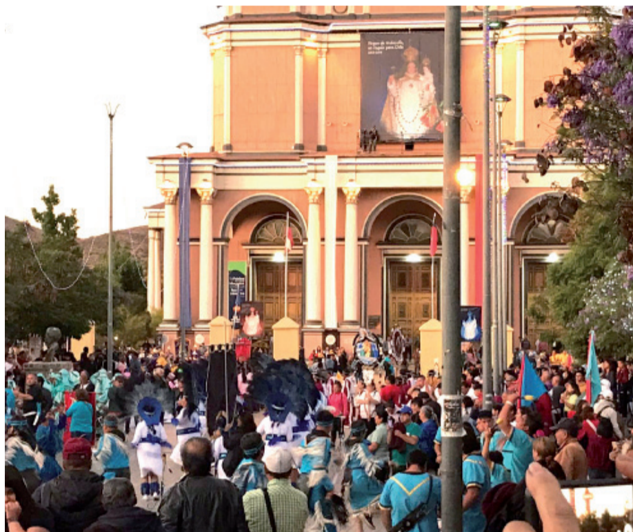
Bajo el lema de “Virgen de Andacollo, un regalo para Chile”, la Fiesta Grande de Andacollo 2023 es la segunda que se realiza desde que terminaron las restricciones sanitarias.

Cofré destaca la variedad de locales para almorzar y la buena oferta de platos. Además, valora la buena seguridad y la presencia constante de carabineros y fiscalizadores,