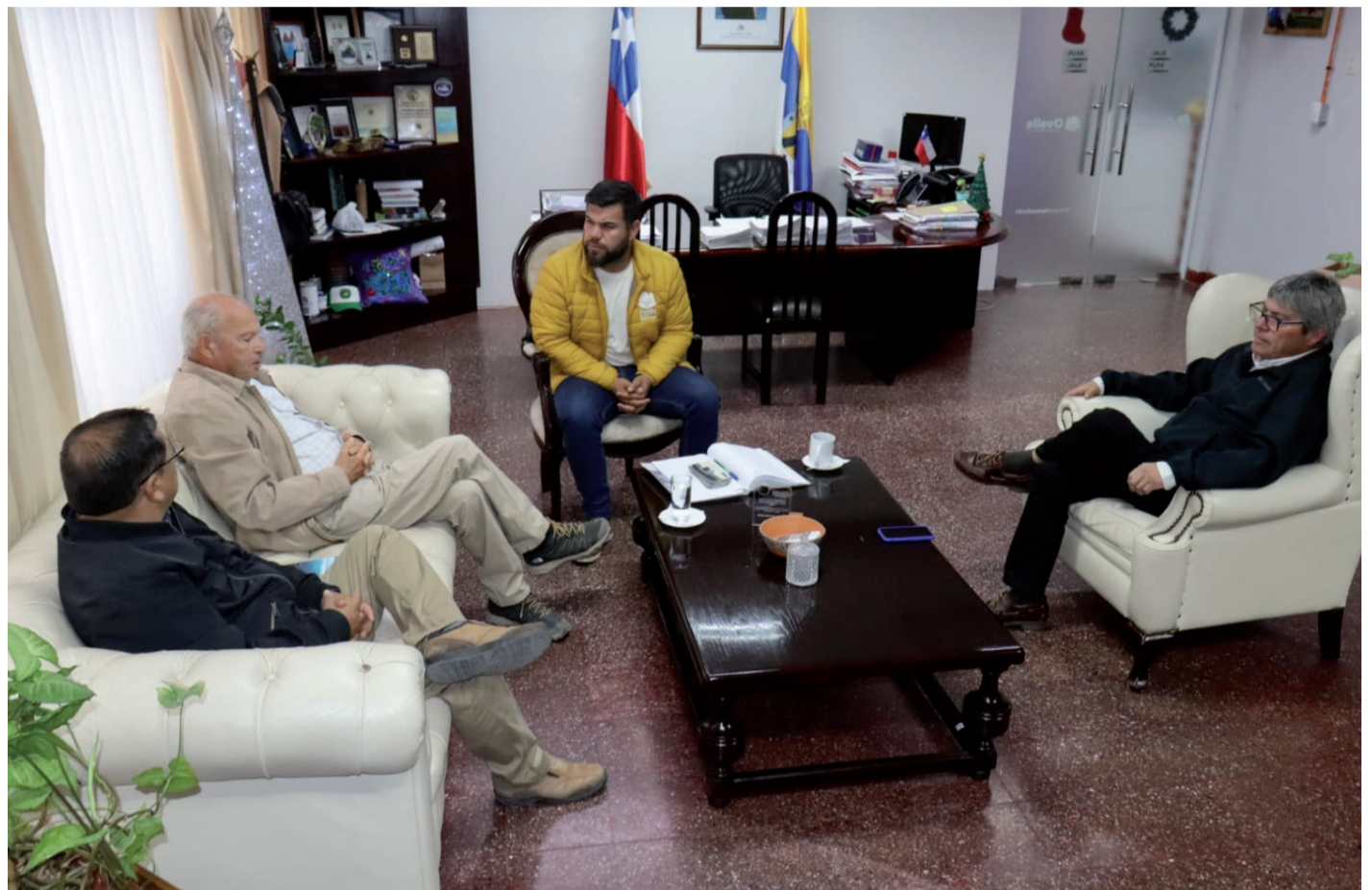
El alcalde de Ovalle recibió en su oficina a los dirigentes de la Junta de Vigilancia del Río Limarí.

El presidente de los regantes agregó que “no queremos alarmar a nadie, pero la situación es crítica y por eso, nos parece bueno conversar para prevenir” y remarcó que “más que encargarle al Estado, creo que es