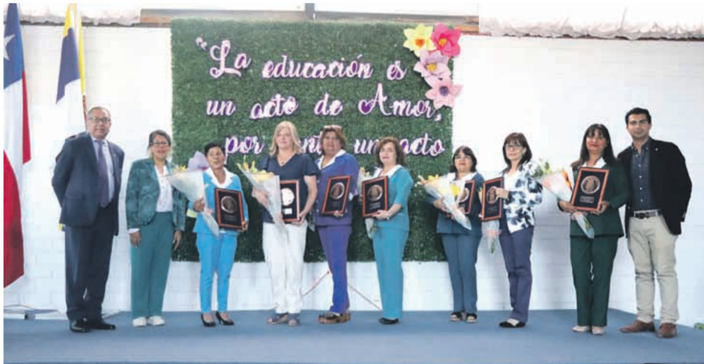
Destacadas docentes y asistentes educativas recibieron un merecido homenaje por parte del Departamento Educativo Municipal. EL OVALINO