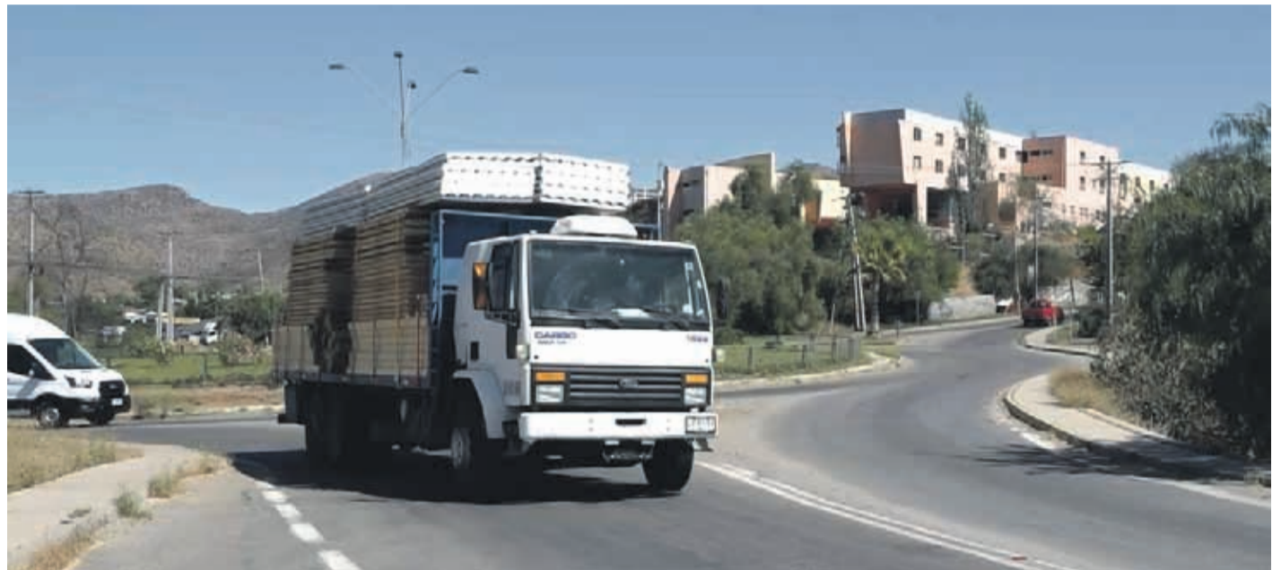
El camión que cargaba las viviendas de emergencia pudo llegar hasta la comuna de Monte Patria.

Otras de las consecuencias del paro nacional de camioneros ha sido el desabastecimiento de combustible, siendo la comuna de Monte Patria la primera gran afectada, ya que se agotó el suministro de su única