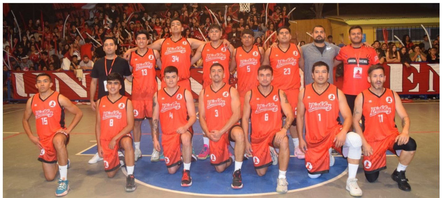
Equipo de Unión Juvenil campeón del "Clásico Nocturno" 2024.

"Se espera mejorar el tema del respeto entre nosotros como público, porque al final somos todos combarbalinos, y la idea es que esta tradicional siga creciendo y no decayendo, la fiesta es el deporte y las actividades sociales y culturales, no tenemos que caer en cosas más allá del fanatismo", sostuvo.