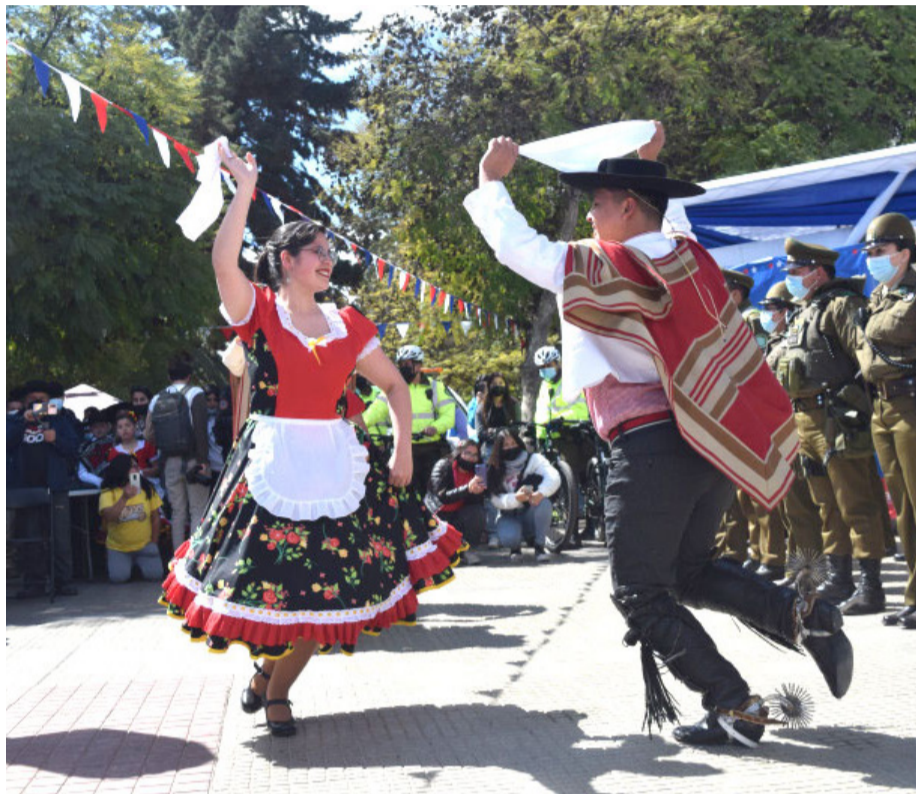
El lanzamiento oficial de la Fonda Los Peñones se realizará el miércoles 6 de septiembre.

una nueva edición de esta tradicional pampilla ovallina, pero todavía se mantienen en incertidumbre los detalles de esta, incluso cuando falta menos de un mes para el inicio de