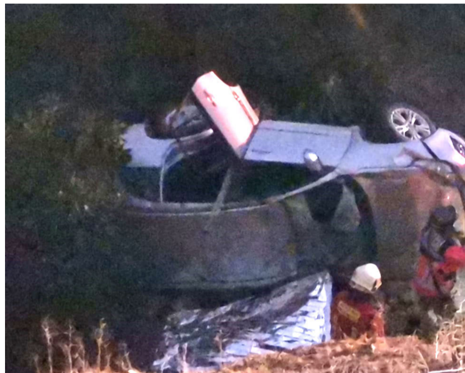
Las causas del desbarrancamiento en Pulpica Bajo aún están en investigación.

“Lo esencial es conducir siempre atento a las condiciones del tránsito. Hay que viajar con el tiempo suficiente, para no conducir apurado. También hay que recordar que no hay que conducir en estado de ebriedad o con algún otro elemento psicotrópico que afecte la conducción”, manifestaron desde la Tercera Comisaría de Carabineros