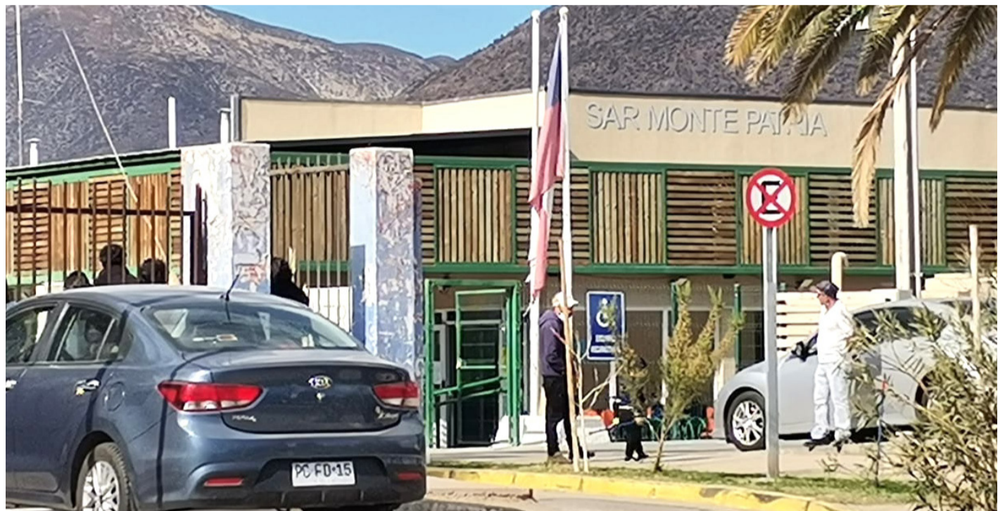
Fue en el SAR de Monte Patria donde la pequeña niña de 2 años y 7 meses falleció producto de un agudo cuadro respiratorio.

En ese momento, familiares expresaron sus aprehensiones en torno a la calidad de la atención que recibió