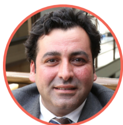
Marcelo Telias Ex seremi de Desarrollo Social, asoma como opción a alcalde.