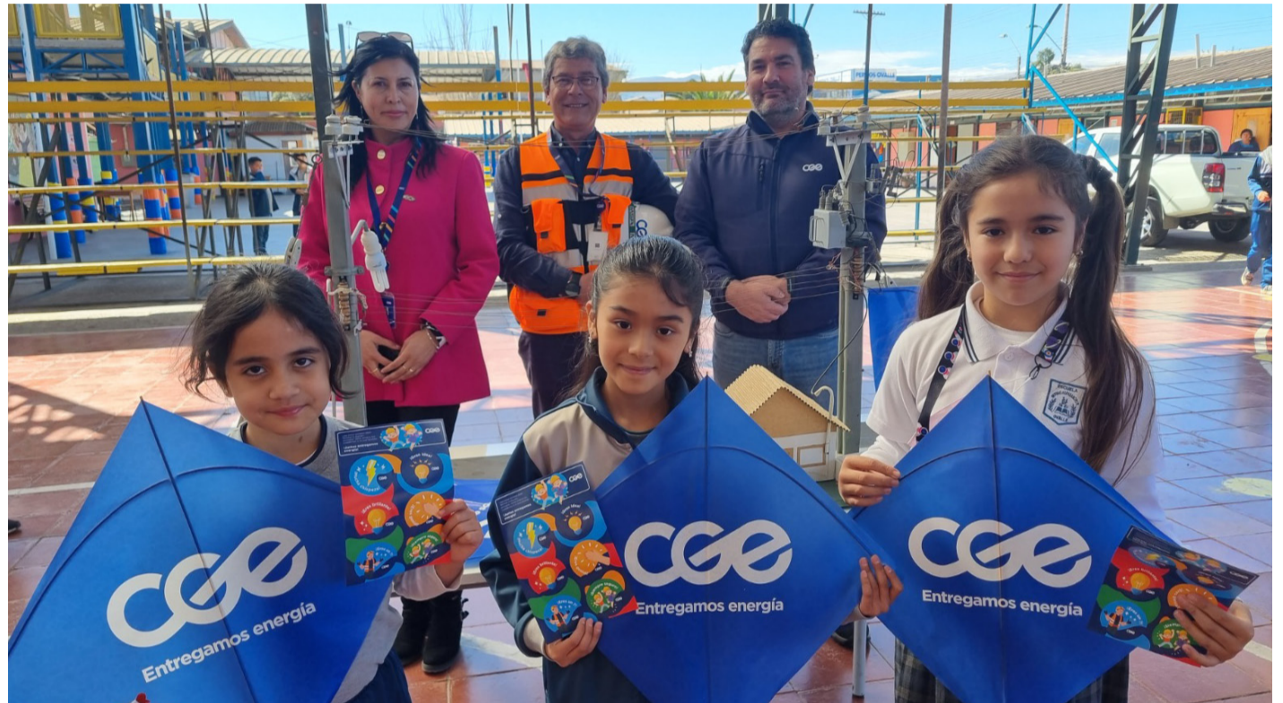
La campaña realizada por CGE en la escuela Arturo Alessandri Palma tuvo por objetivo concientizar a los niños y niñas sobre los peligros de elevar volantines cerca de los cables eléctricos. A manera de presente, también les hicieron entrega de un volantino a chicos y chicas.

Eso precisamente realizó CGE -empresa de distribución eléctrica que atiende a más de 3 millones de clientes entre las regiones de Arica y Parícuta y la Araucanía- junto a la Municipalidad de Ovalle y Carabineros, quienes se dieron cita en la escuela