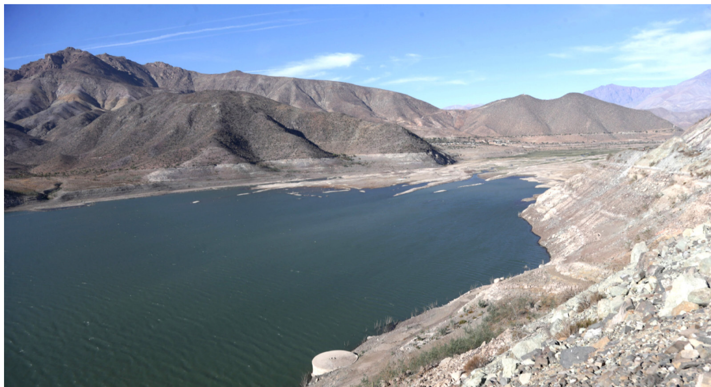
La falta de lluvias tiene a los embalses de la región en niveles mínimos respecto al agua embalsada.

Además se debe considerar que El Niño no es el único factor de influencia en la precipitación a escala estacional