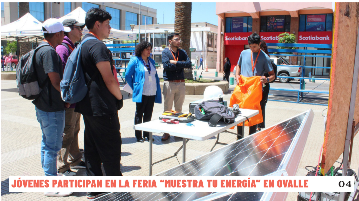
JÓVENES PARTICIPAN EN LA FERIA "MUESTRA TU ENERGÍA" EN OVALLE 04

Asaltos en la calles y hurtos en las viviendas son algunos de los delitos que vienen sufriendo los vecinos del sector desde hace un tiempo. Por ello, solicitan celeridad para poner en marcha un proyecto de cámaras de televigilancia y mayor efectividad en los patrullajes. 02