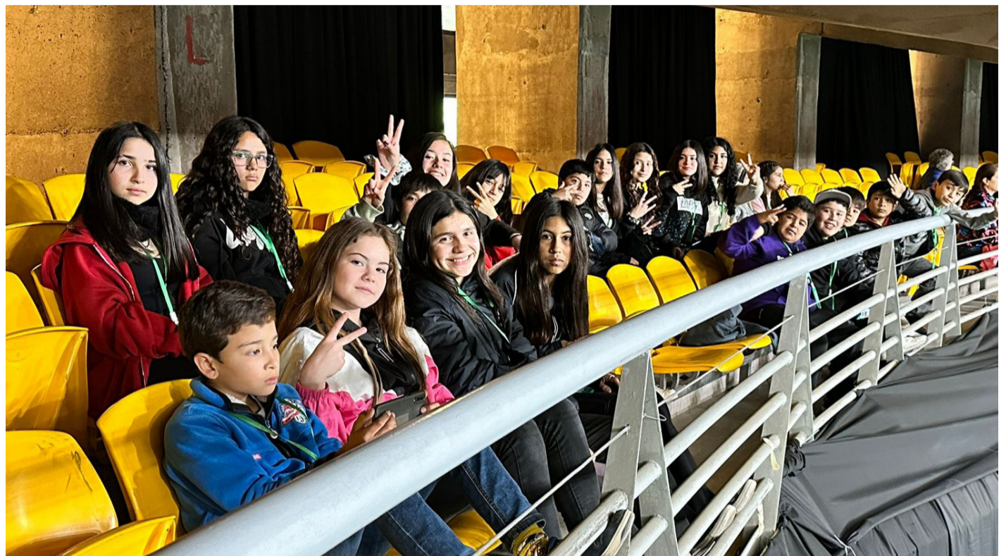
Los estudiantes montepatrininos disfrutaron de su viaje a la Región Metropolitana.