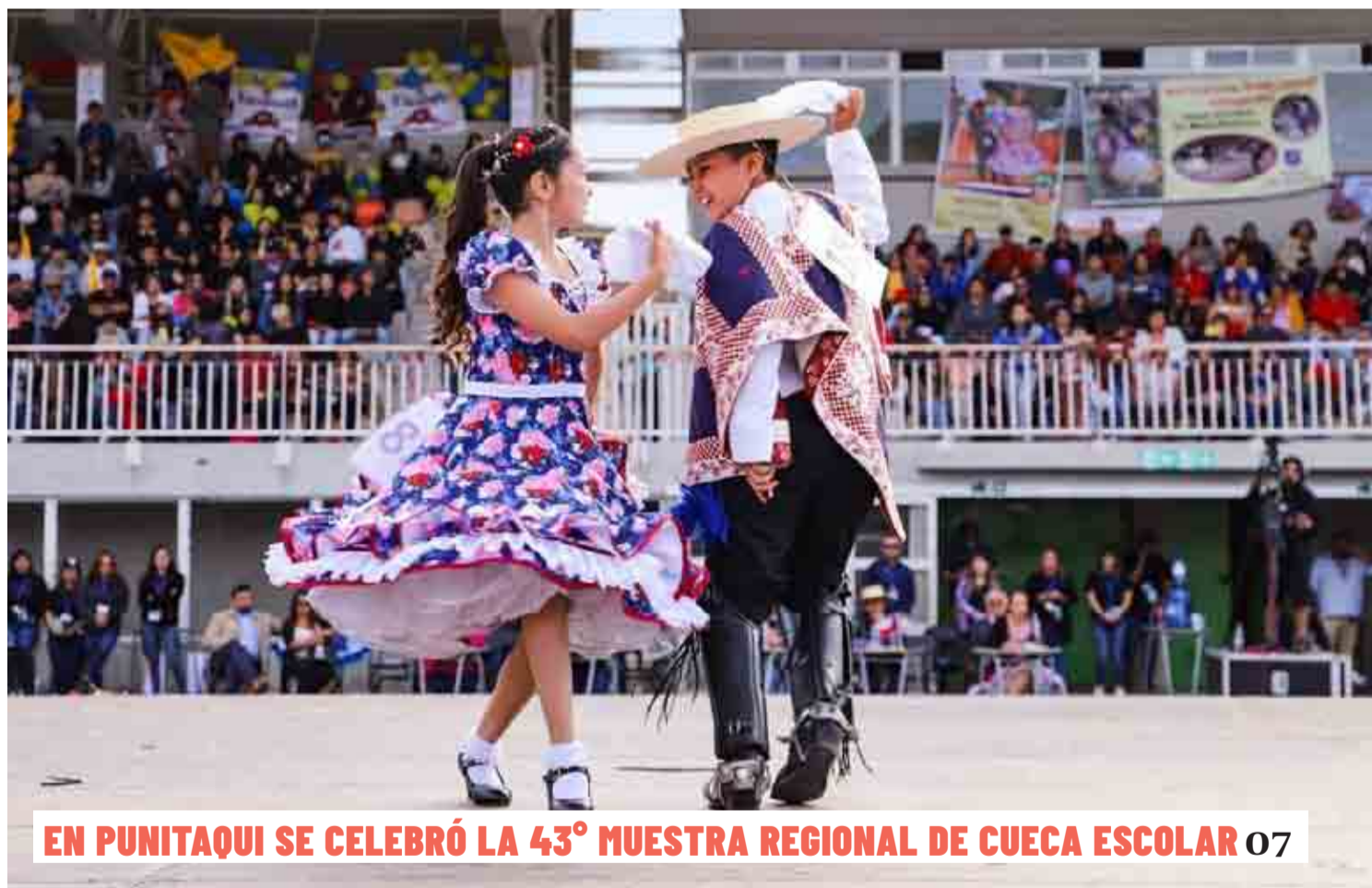
EN PUNITAQUI SE CELEBRÓ LA 43° MUESTRA REGIONAL DE CUECA ESCOLAR 07