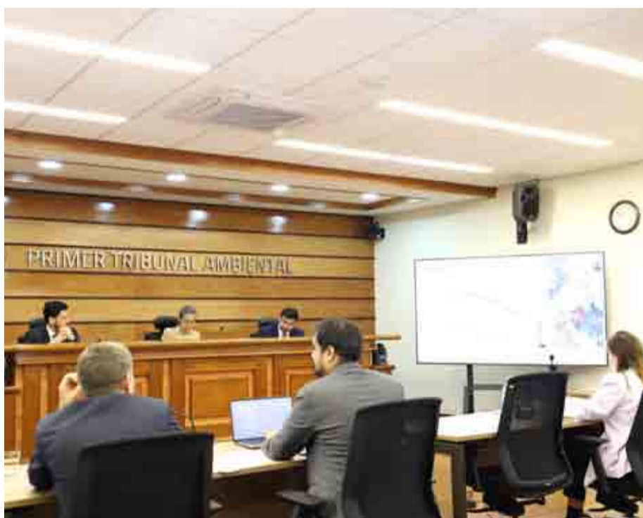
El Primer Tribunal Ambiental de Antofagasta ya revisó la causa anteriormente. CRISTIAN SILVA

Luego que el proyecto minero portuario fuese rechazado por el Comité de Ministros, Andes Iron presentó un recurso de reclamación ante la instancia jurídico ambiental acusando que la decisión se basó en un "actuar absolutamente refundacional" y vulnera la fuerza obligatoria de una sentencia dictada previamente.